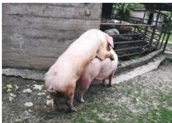
Slika 4. Pojedinačni pripust