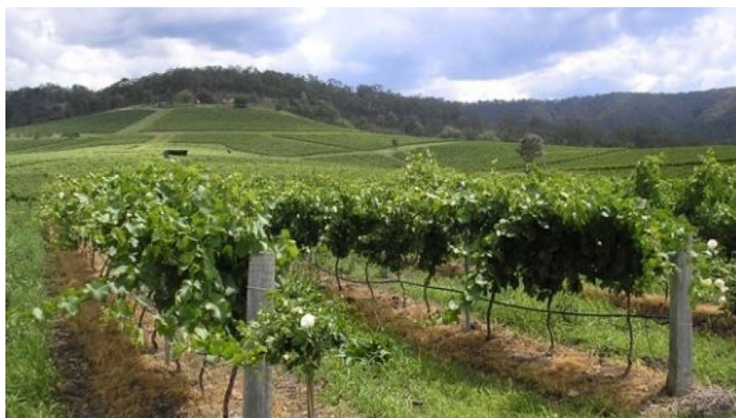
Slika 1. Vinogradarstvo u Vukovarsko-srijemskoj županiji