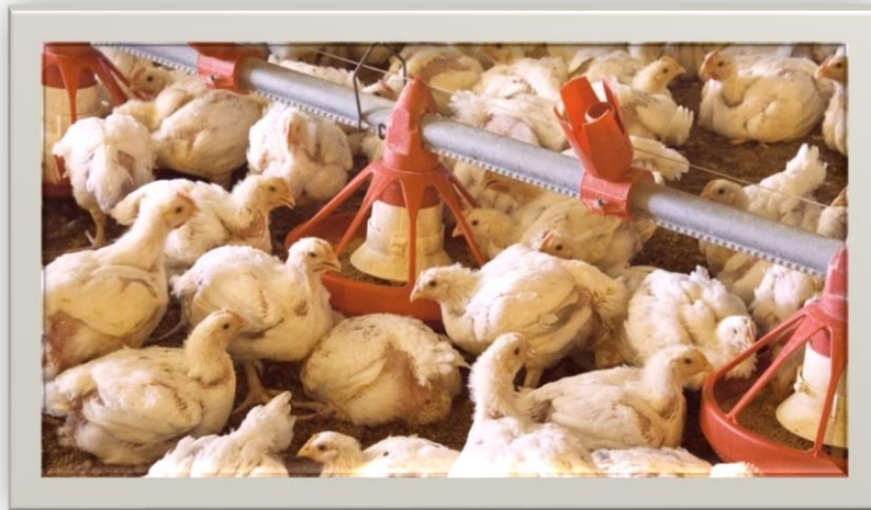
Slika 5. Hranidba peradi

U ekološkoj proizvodnji nije dopuštena upotreba mesnog brašna, koštanog brašna i genetski modificirane hrane te tvari kojima se potiče rast i proizvodnja (antibiotici, kokcidiostatici, stimulatori rasta). Hrana i svježa voda trebaju biti dostupni životinjama cijeli dan. Što se tiče vode za napajanje, treba naglasiti da ona mora kvalitetom i količinom zadovoljavati potrebe životinja. Naime, uzgoj na ekološki prihvatljiv način podrazumijeva konzumiranje (potrošnju) zdravstveno ispravne vode, a organoleptički, fizikalno, kemijski i bakteriološki parametri ocjenjuju se po istim kriterijima kao i oni u vodi za piće ljudi (Pravilnik o zdravstvenoj ispravnosti vode za piće – NN 46/94). Naime, pogoršana kvaliteta vode može negativno utjecati na zdravlje životinja kao i na njihove proizvodne sposobnosti, prirast, nesivost i kvalitetu jaja. Osigurati dovoljne količine vode zavisi o potrebi životinja za vodom. Dnevne količine za perad zavisno da li se radi o nesilicama ili brojlerima te o dobi iznose.