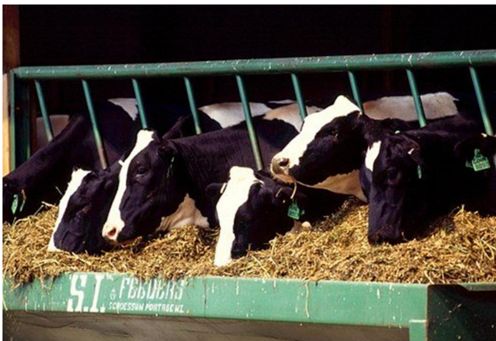
Slika 8. Hranjenje tovne junadi