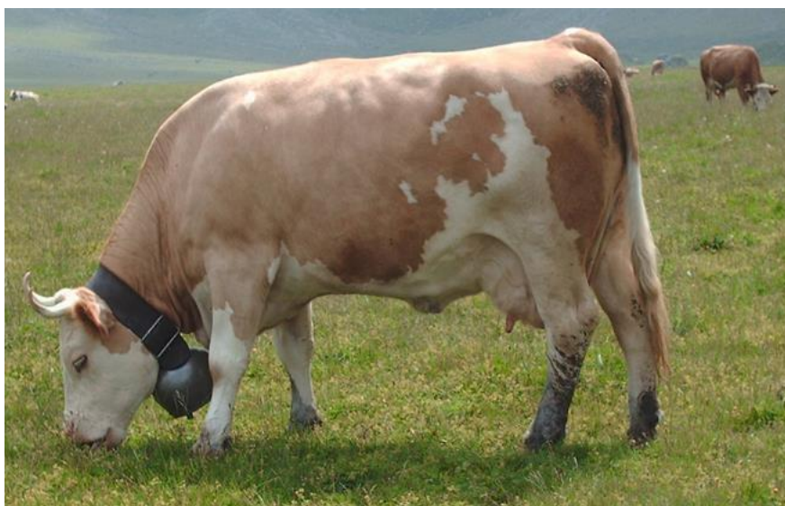
Slika 6. Simantalsko govedo