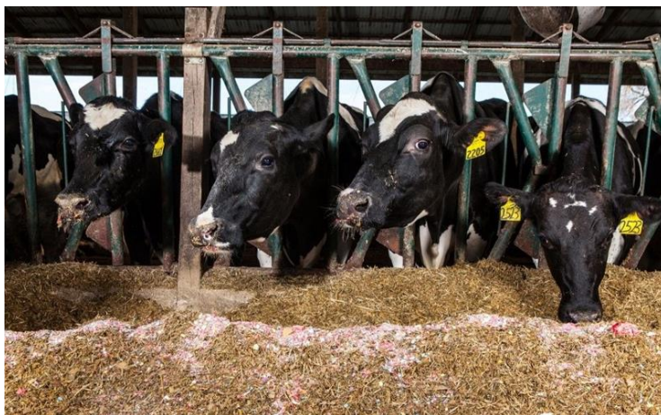
Slika 1. Intenzivan oblik tova junadi

Farma se sastoji od dvije proizvodne farme na kojima se uzgajaju grla goveda različitih uzrasta (telad i junad). U sklopu farmi na ulazima nalaze se stočne vage i prostor za dezinfekciju. Farma posjeduje dvije garaže za strojeve (otvorenu i natkrivenu), štale za držanje životinja, objekte za skladištenje hrane, objekte za spremanje slame, sušaru, toster, stacioniranu mješaonicu hrane i objekte za skladištenje stajskog gnoja.