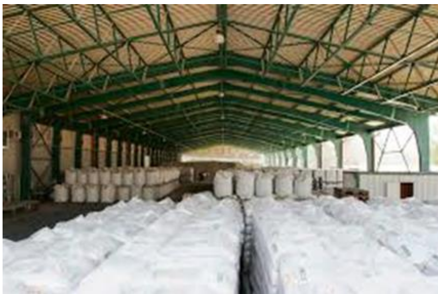
Slika 5. Nadstrešnica za sijeno i slamu