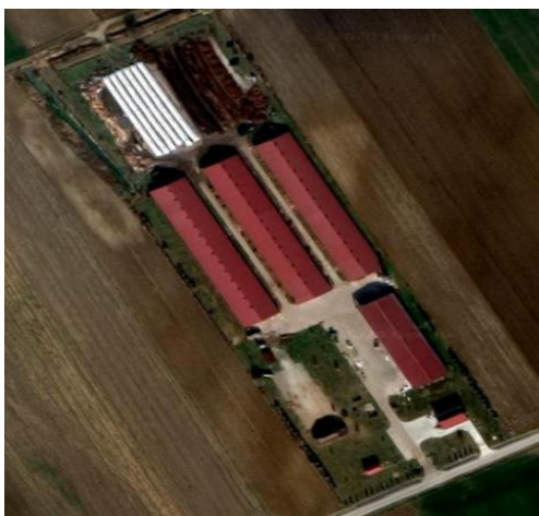
Slika 2. Simentalna Commerce d.o.o. farma za tov teladi

Objekti na farmi Simental Commerce namijenjeni su za tov goveda, a njihova izvedba je suvremena i praktična za bavljenje djelatnostima tova. Objekti su građeni tako da je olakšan pristup mehanizaciji i strojevima što dovodi do lakšega i bržeg rada i drastičnog smanjenja ljudskog fizičkog rada na farmi. Farma za tov teladi sastoji se od tri štale kapaciteta 2500 grla. U svakoj štali nalazi se po sedam odjela gdje su smještene životinje.