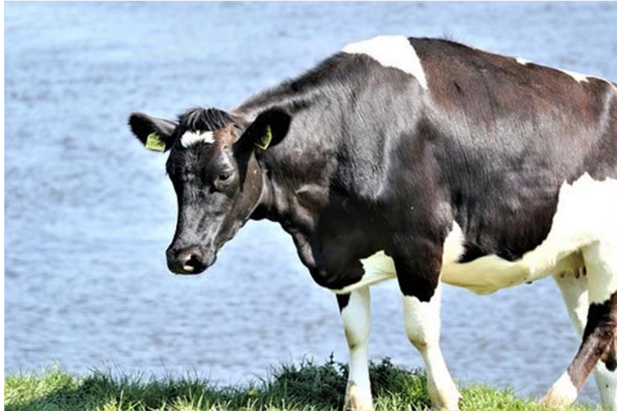
Slika 7. Belgijsko plavo govedo