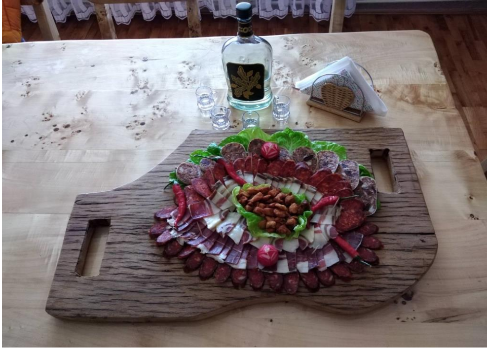
Slika 7. Suhomesnati proizvodi od svinja uzgojenih na OPG-u Snežana Nešković