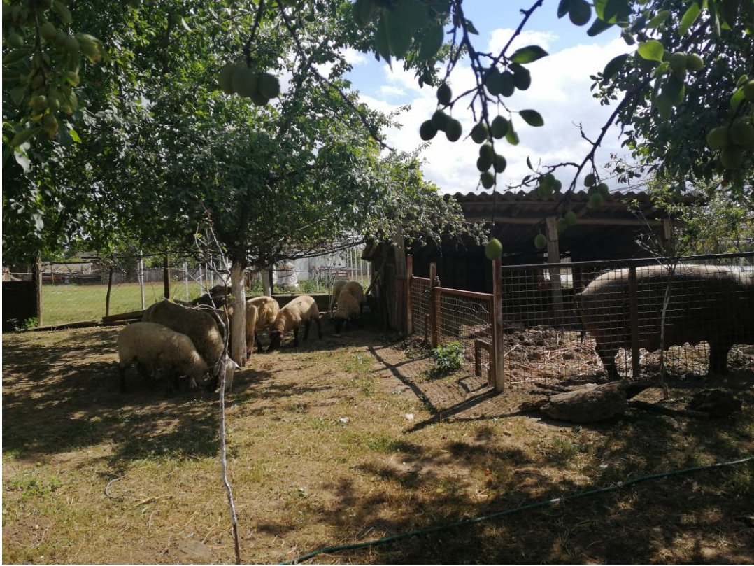
Slika 6: Simbioza s drugim životinjama na OPG-u Snežana Nešković