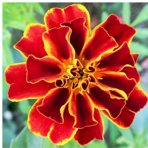
Slika 10. Afrička kadifica ( Tagetes erecta L.)

Afrička kadifica ( Tagetes erecta L.) jednogodišnja je biljka. Sačinjena je od uglaste stabljike bez dlačica i perstih listova s vrlo rijetkim žlijezdama. Listovi su dugi 5 do 10 cm i imaju 11 do 17 usko kopljastih, zašiljenih, oštro nazubljenih liskih dugih do 5 cm. Afričku kadificu krase velike i guste, višestruke cvjetne glavice, obično su promjera do 12 cm. Prekrasne su narančaste boje s žuto obrubljenim laticama. Ove kadifice cvjetaju od proljeća do jeseni ( https://www.plantea.com.hr/kadifica/ ).