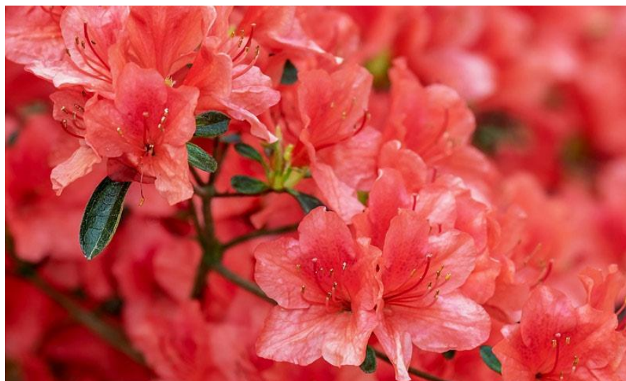
Slika 4. Rhododendron L.