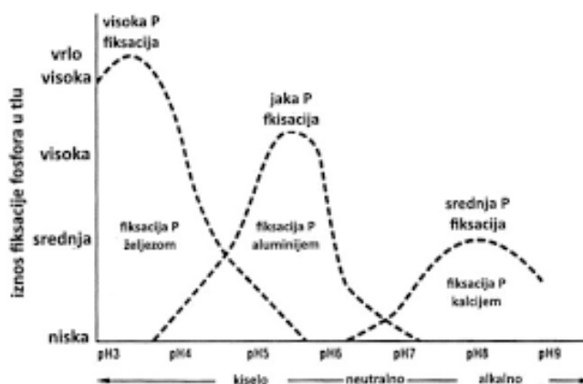
Slika 1. Kemijska fiksacija fosfora iz gnojiva u tlu (Đurđević, 2014.)

„Zakiseljavanje tla može izazvati i industrijska polucija, posebice kisele kiše u širem području velikih energetskih postrojenja, ali uzrok mogu biti i prirodni procesi. Proces zakiseljavanja je vrlo štetan (odmah iza erozije po globalnim efektima degradacije tala) jer uzrokuje niz problema u ishrani bilja. U kiselim tlima mineralno-koloidna frakcija podvrgnuta je dugotrajnom ispiranju vodenom otopinom kiselina (huminska i druge) i postupno prelazi u glinene kiseline koje se lako premještaju u dublje slojeve soluma. Nakupljanje gline na određenoj dubini dovodi do stvaranja vodonepropusne zone uz sve izraženije uvjete za dalju redukciju. U takvim okolnostima ( \text{pH} < 5,5 ) najčešće višak \text{H}^+ na adsorpcijskom kompleksu aktivira ione aluminija i željeza koji u većim količinama djeluju otrovno na biljke, blokiraju snabdijevanje fosforom i drugim elementima (Vukadinović i Vukadinović, 2011.).“