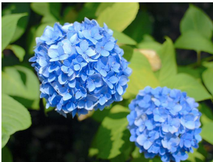
Slika 7. Plava hortenzija

Većina istraživanja se temelji na reakciji tla. Cvjetovi na kiselim tlima su pretežno plavi, na neutralnim crvenkasti, na alkalnim ružičasti. Osim kemijske reakcije tla, bitnu ulogu kod boje cvijeta ima i kultivar koji se uzgaja (Šilić i Mrdović, 2013.).