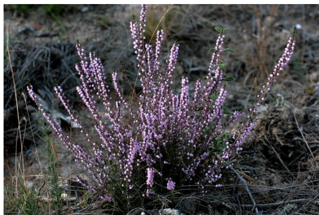
Slika 9. Vrijesak ( Calluna vulgaris (L.) Hull)