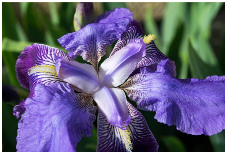
Slika 15. Perunika ( Iris )