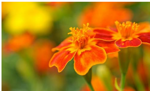
Slika 12. Tagetes tenuifolia

promjera do 2,5 cm, žutih ili narančastih cvjetića. Cvjetaju od kraja proljeća do jeseni u cimoznim cvatima ( https://www.plantea.com.hr/kadifica/ ).