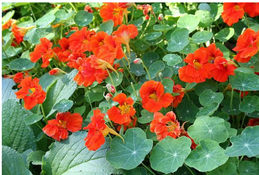
Slika 16. Dragoljub ( Tropaeolum majus )

Sjeme mu je veličine graška, lako nikne i pojedini primjerci mogu narasti poprilično bujno. Biljka treba puno sunca ili polusjene, a pogodna je za (lagano) pjeskovito ili (srednje) ilovasto tlo, s razinom pH između 6,1-7,8 ( http://heritagegarden.uic.edu/nasturtium-tropaeolum-majus ).