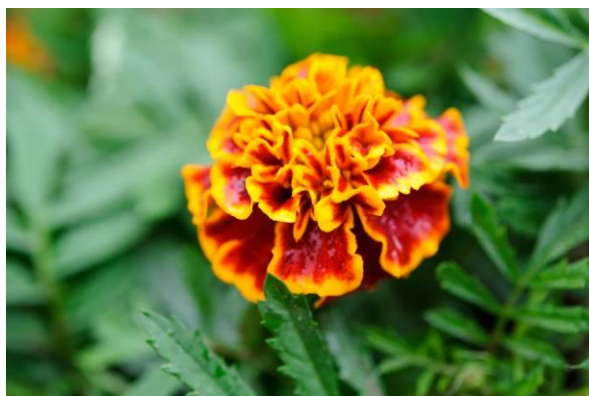
Slika 11. Francuska kadifica ( Tagetes patula L.)

Francuska kadifica ( Tagetes patula L.) jednogodišnja je biljka. Sačinjena je od prošarane grimizne stabljike bez dlačica i peraste duge listove do 10cm. Liske su kopljaste i nazubljene, dužine do 3 cm. Višestruke cvjetne glavice su obično pojedinačne, promjera do 5 cm, s ponešto crvenosmeđih, žutih, narančastih ili šarenih zrakastih cvjetića i obično nekoliko plosnatih cvjetića. Cvjetaju od kraja proljeća do jeseni ( https://www.plantea.com.hr/kadifica/ ).