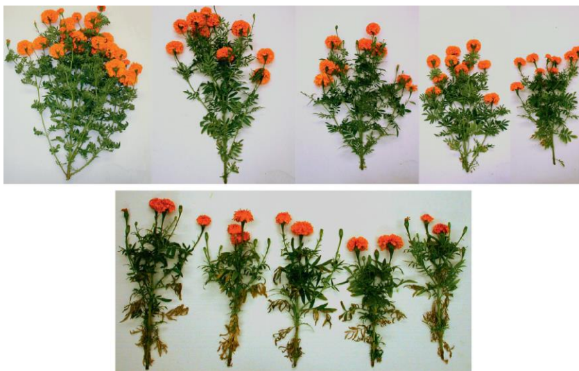
Slika 13. S lijeva na desno, biljke Tagetes patula L. uzgajane tlu s pH vrijednošću 6,4 (gornji red), te biljke Tagetes patula L. uzgajane na tlu s pH vrijednošću 7,8 (donji red).