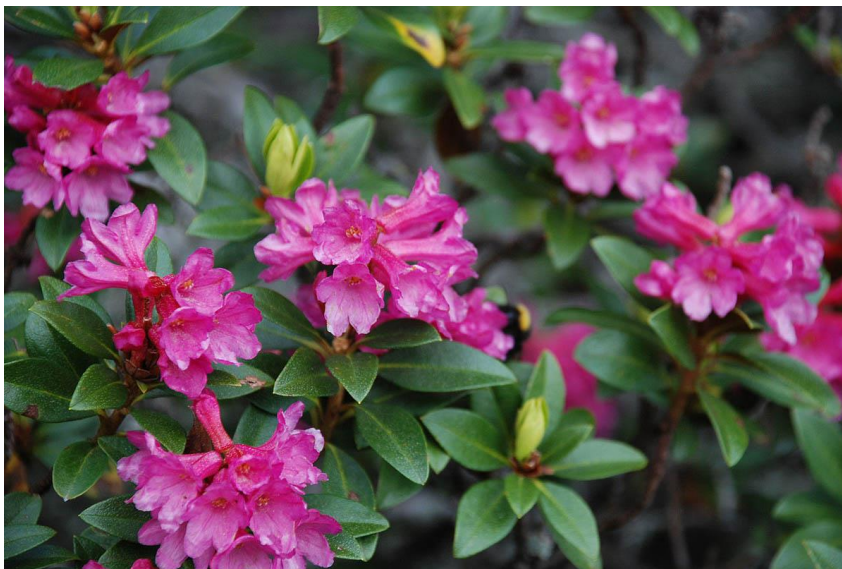
Slika 3. Rhododendron hirsutum