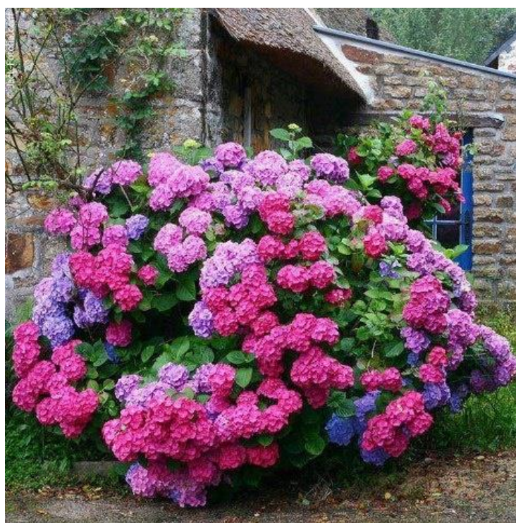
Slika 6. Hydrangea

Cvjetne glavice sačinjene su od dvije vrste cvjetova. Neugledni fertilni cvjetovi smješteni su unutar glavice, okružuju su većim sterilnim cvjetovima. Oni su sastavljeni od četiri laticice. Oni se javljaju u bijeloj, plavoj, ružičastoj i grimiznoj boji ili bijeloj koja prelazi u blijedozelenu kod Hydrangea paniculata var. grandiflora . Sterilnih cvjetovi su ružičaste boje, ali zavisno od uvjeta uzgoja i kultivara boja može biti plava ili bijela (Šilić i Mrdović, 2013.). Hortenzije imaju dvije su vrste cvatova, bujni cvatovi nalik na pompone i okrugli, plosnati cvatovi s plodnim cvjetovima u sredini okruženi neplodnim cvjetovima ( https://hr.wikipedia.org/wiki/Hortenzija ).