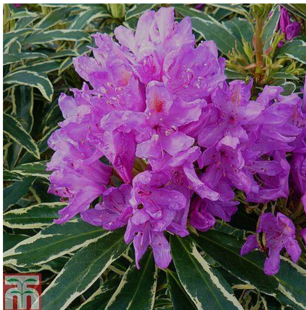
Slika 5. Rhododendron ponticum

Ljepota rododendrona dolazi do izražaja kada se uzgaja u većim grupama. Predstavlja ukrasnu biljku u krajobraznoj arhitekturi. Pojedine vrste rododendrona su otrovne jer se u listovima, stabljici i cvjetovima nalazi grayanotoxin. Toksin je pronađen u sljedećim vrstama: Rhododendron ponticum , Rhododendron flavum i Rhododendron simsii . Konzumacija bilo kojeg dijela otrovne biljke može dovesti do iritacije želuca, vrtoglavice, mučnine, bolova u trbuhu, grčenja mišića, ubrzanog rada srca, osipa na koži, zamagljenog vida, glavobolje. Otrovnost je i za ljude i za životinje koje brste stabljike i listove. Smrt je zabilježena u rijetkim slučajevima (Forenbacher, 1998.).