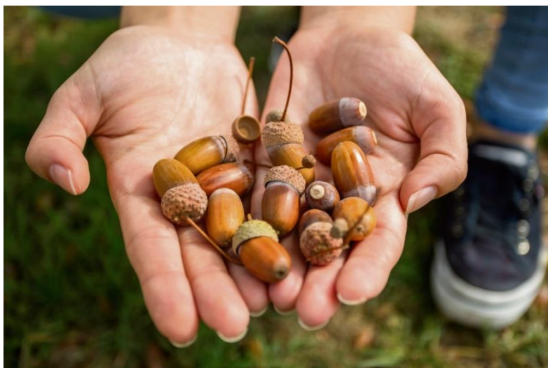
Slika 4. Prikaz žira hrasta