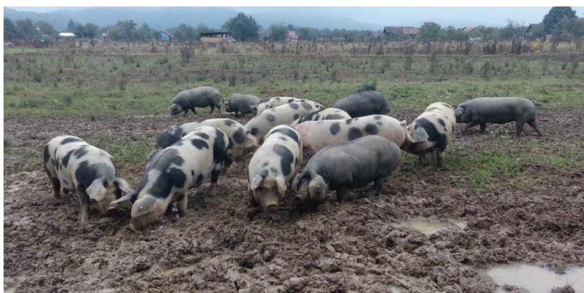
Slika 1. Prikaz hranidbe crne slavonske svinje u ekstenzivnom načinu držanja

Svinje uzgajane u silvo – pastoralnom sustavu odlikuju se sporijom stopom rasta i dobrom otpornosti (Edwards, 2005.). Prednosti držanja svinja u ovom sustavu su manja financijska ulaganja i ekološka prihvatljivost. Kretanjem svinja po šumskim površinama ostvaruje se pozitivan učinak na dobrobit i zdravlje, te kvalitetu završnih proizvoda. Uz prednosti ovog sustava, postoje i njegovi nedostaci poput mogućnosti uništavanja mladih stabala drveća, križanje s divljim svinjama te mogućnost prijenosa zaraznih bolesti. Prilikom hranidbe svinja u ekstenzivnom uzgoju zabilježen je veći udio oksidativnih vlakana što uzrokuje povećan udjel mioglobina, koji je i razlog tamnije boje mesa (Gvozdanović i sur., 2019.).