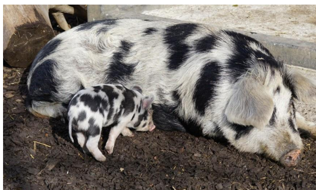
Slika 5. Prikaz turopoljske svinje

Turopoljska svinja naša je najstarija pasmina svinja, stvorena na području Turopolja, po kojem je i dobila ime. Nastala je u predantičko doba (VI. stoljeće) križanjem šiške i krškopoljske svinje, proširene na području Turopolja. Prilagođena je biotopu močvarnih pašnjaka i livada te hrastovim i bukvinim nizinskim šumama gdje može boraviti gotovo cijele godine (Barać i sur. 2011.). Pasma je srednje plodna s oko 6 – 7 prasadi po leglu, prosječne mase od 1,25 kg. Tovna sposobnost turopoljke je dobra, te u kasnom tovu dostiže masu od 200 do 220 kg. Tov turopoljske svinje žirom odvija se u šumi do dobi od 18 do 24 mjeseca, nakon tova žirom nastupa razdoblje tova kukuruzom. Meso je izrazito ukusno, te ružičaste boje. Paša i žir turopoljskim je svinjama bila energetska osnova obroka, dok su rovaranjem gujavica, puževa i ličinki svinje osiguravale izbor bjelančevina u obroku. Žir hrasta ima pozitivan učinak na dobrobit i zdravlje svinja, te na vrlo visoku kvalitetu finalnih proizvoda.