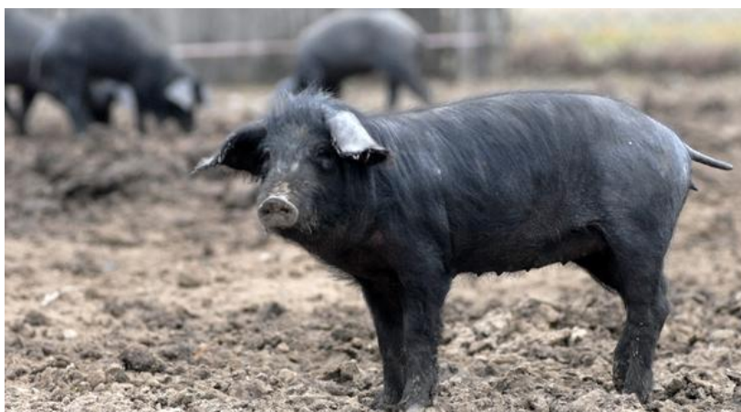
Slika 6. Prikaz krmače crne slavonske svinje

Na imanju grofa Karla Pfeiffera u blizini Osijeka, 1860. godine nastala je pasmina crna slavonska svinja koja je ujedno i jedna od hrvatskih autohtonih pasmina. Grof Pfeiffer ovu pasminu je dobio križanjem 10 nazimica lasaste mangulice s nerastima berkshire pasmine. Nakon dobivanja nove pasmine svinja, grofov sin Leopold najbolje žensko potomstvo svakih je 10 godina križao s nerastima Poland China pasmine. Tim križanjima pasmina se nastojala unaprijediti, te postići željena pasminska svojstva. Uz svoje dobre proizvodne sposobnosti, crna slavonska svinja isticala se i izvrsnom otpornošću jer je u to vrijeme bila namijenjena tadašnjem načinu držanja u krajevima Slavonije i Baranje koji se temeljio na ispaši na pašnjacima i šumama, uz dohranu kukuruzom tijekom zimskih mjeseci.