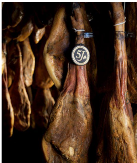
Slika 8. Prikaz iberijskog pršuta koji nosi crnu oznaku u znak proizvodnosti od stopostotne iberijske svinje

pršut proizveden od stopostotne pata negre (iberijske svinje) proizvedene u slobodnom uzgoju, točnije svinje hranjene isključivo žirom i korijenjem, te je taj pršut odležao minimalno 3 godine (Niseteo, 2018.).