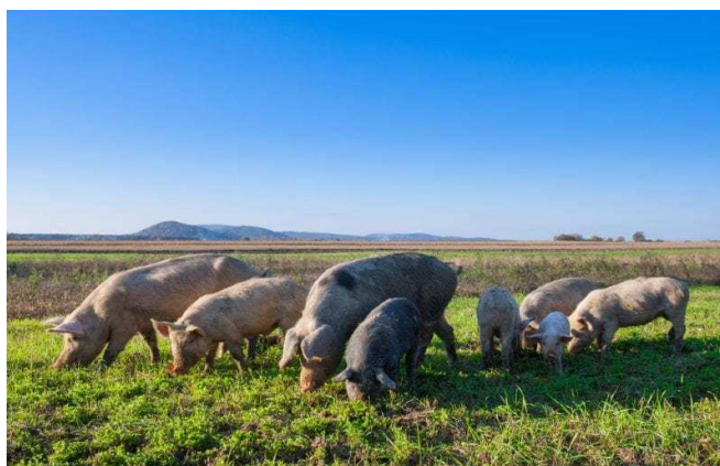
Slika 2. Prikaz hranidbe svinja na pašnjaku