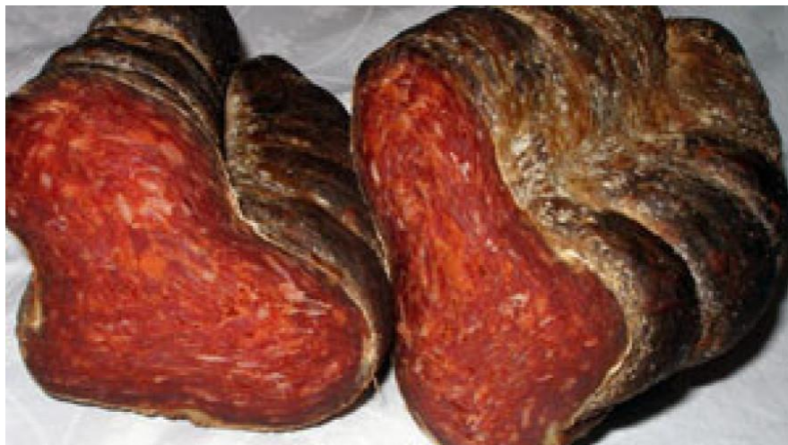
Slika 7. Prikaz tradicionalnog slavonskog kulena

Dugo je vremena uzgoj svinja prvenstveno bio namijenjen uzgoju slanine i masti, što se mijenja nakon poboljšavanja hranidbenog i uzgojnog rada prilikom proizvodnje. Uz uznapredovao razvoj mesnog obrta oblikuju se i drugi izvorni proizvodi poput kulena, šunke i kobasice. Od svih tradicionalnih proizvoda domaći slavonski kulen i danas je sastavni dio tradicionalne kulture slavonskog kraja. Kulen se proizvodi od odabranih visokokvalitetnih dijelova mesa I i II klase, soli i prirodnih začina (crvena paprika i češnjak), te se nadjeva u svinjsko slijepo crijevo. Nakon izjednačavanja temperature nadjeva, kulen se dimi, fermentira, suši i podvrgava procesu zrenja (Karloyi i sur., 2010.). Tradicijski se slavonski kulen radi od kvalitetnog mesa svinja koje su većinu svog vremena boravile u šumama na paši, te se prehranjivale žirom u hrastovim šumama. Utjecaji na kakvoću slavonskog kulena su razni, ali ponajviše na kakvoću utječu načini držanja tovljenika i njihova hranidba (npr. hranidba žirom), genotip svinja, pred klaonički postupci i uvjeti nakon klanja.