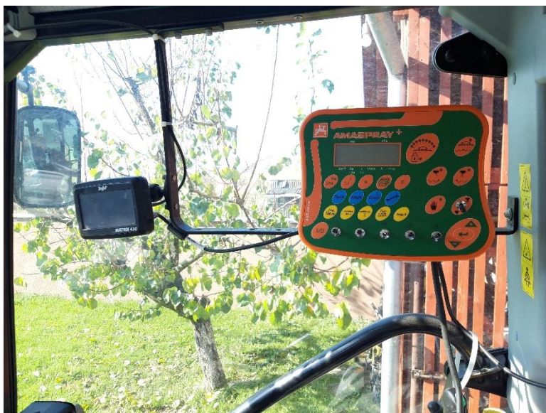
Slika 15. Uređaj „Amaspray+“