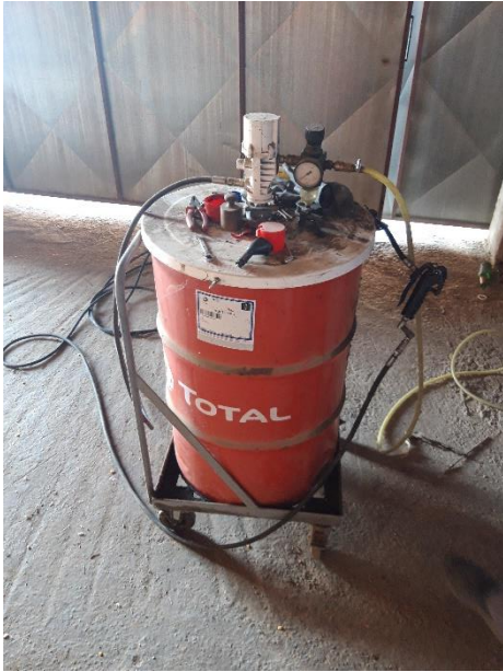
Slika 2. Pneumatski podmazivač