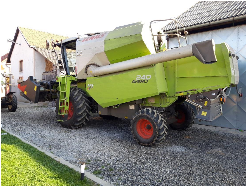
Slika 6. Claas Avero 240

Kombajn je nabavljen 2019. godine te se koristi za žetvu na vlastitim površinama, ali i za uslužnu žetvu.