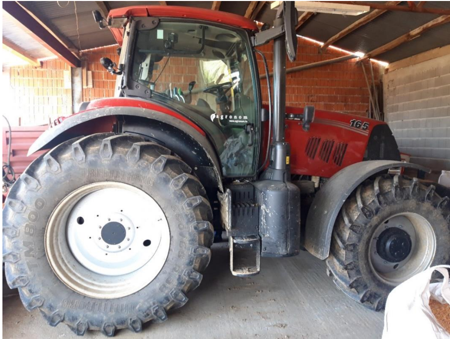
Slika 5. „Case Puma 165x“

pogon na 4 kotača i ima poboljšani TLS ovjes. Hidraulički sustav koristi elektronsko upravljanje priključkom, odnosno EHC sustav, a maksimalna masa koju stražnji hidraulički sustav može podići je 8257 kilograma. Broj okretaja priključnog vratila iznosi 540 ili 1000 okretaja u minuti, ovisno o potrebi. Maksimalna brzina koju ovaj traktor može razviti je 50 km/h. Masa stroja je 7700 kilograma.