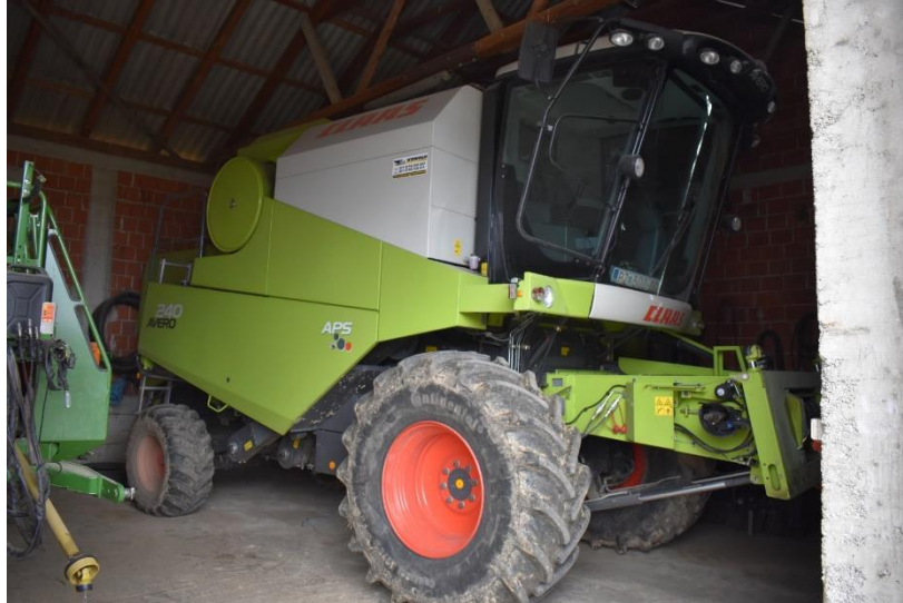
Slika 17. Garažiranje kombajna na „P.P. Marić“

Strojevi se na „P.P. Marić“ garažiraju u zatvorenom i poluzatvorenom prostoru. U zatvorenom prostoru su garažirani traktori, kombajn, žitni heder i kukuruzni adapter.