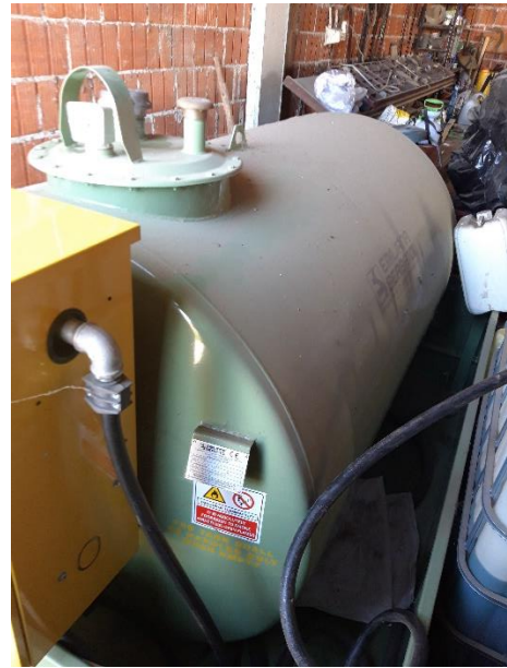
Slika 3. Cisterna za gorivo