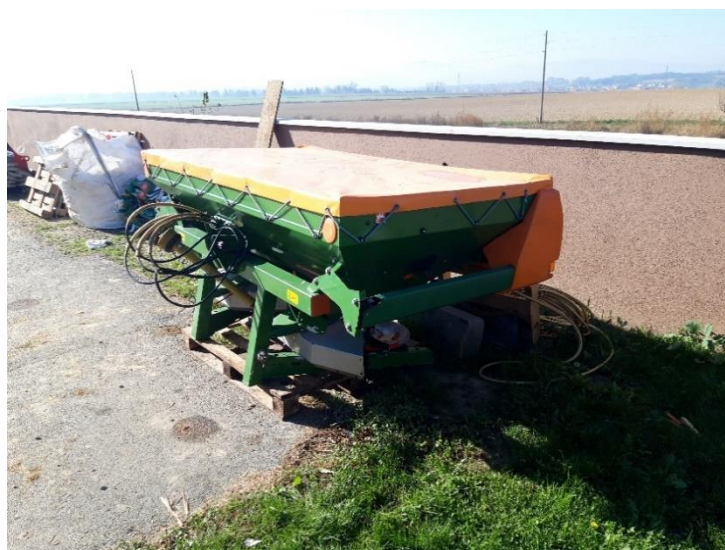
Slika 16. Rasipač „Amazone ZA-M 2001“

Rasipač „Amazone ZA-M 2001“, slika 16., je nošeni rasipač. Radni zahvat je podešen na 15 metara kako bi se mogli koristiti isti prohodni tragovi u usjevima kao i kod prskanja. Zapremnina stroja je 1000 litara. Rasipač za apliciranje mineralnih gnojiva koristi 2 diska od nekorodirajućeg čelika. Rasipač je opremljen Amazone-ovim SBS ( Soft Ballistic System ) sustavom koji omogućuje precizniju i ravnomjerniju raspodjelu gnojiva. Također se kao i kod prskalice koristi GPS sustav radi preciznije aplikacije, te samim time dolazi i do smanjenja troškova proizvodnje.