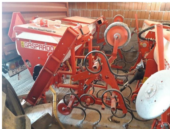
Slika 13. Kultivator „Gaspardo HP-4“

Kultivator „Gaspardo HP-4“, slika 13., je nošeni kultivator radnog zahvata 4 reda. Radni organi su zupci na elastičnim nosačima. Na kultivatoru se nalaze 2 spremnika koji služe za gnojivo, te se prilikom kultiviranja može gnojivo unijeti u tlo. Na gospodarstvu se kultivator koristi za kultiviranje kukuruza i suncokreta.