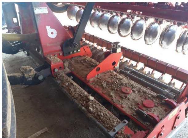
Slika 10. Rotodrljača „Breviglieri Mekfarmer 170“

Rotodrljača „Breviglieri Mekfarmer 170“, slika 10., je nošena rotodrljača radnog zahvata 3 metra. Sastoji se od rotirajućih noževa koji pogon dobivaju kardanskim vratilom preko priključnog vratila traktora, te od valjka sa šiljcima. Na stroju se također nalazi hidraulički sustav koji omogućuje serijsko agregatiranje strojeva. Na gospodarstvu se hidraulički sustav koristi za priključivanje sijačice kako bi se u jednom proходу obavilo dodatno usitnjavanje tla i sjetva.