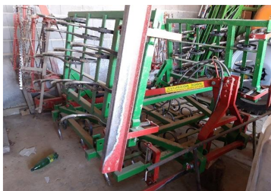
Slika 9. Sjetvospremač „Zvijezda 2005“

Sjetvospremač „Zvijezda 2005“, slika 9., je nošeni sjetvospremač radnog zahvata 5 metara. Zbog mogućnosti lakšeg transporta sjetvospremač ima hidraulički sustav pomoću kojeg se sklapa te omogućuje sigurno gibanje na prometnicama. Stroj se sastoji od četiri reda nepomičnih zubaca koji se nalaze na okviru. Na stražnjem kraju stroja se nalaze dva šuplja nazubljena valjka smješteni jedan iza drugoga. Sjetvospremač se koristi za dopunsku obradu i pripremu tla za sjetvu kada je to potrebno. Na gospodarstvu se nalazi od 2018. godine.