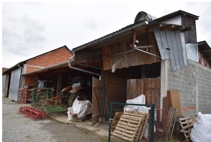
Slika 18. Poluzatvoreni garažni prostor na „P.P. Marić“

Drugi garažni objekt izveden je kao poluzatvoreni prostor (nadstrešnice) s čvrstim zidom sa tri strane. U sklopu ovog garažnog prostora nalazi se sušara za kukuruz, koja se koristi za vlastite potrebe kao i za uslužnu djelatnost sušenja kukuruza. U ovom prostoru garažiraju se priključni strojevi (kultivator, sijačica, sijačica za kukuruz, sjetvospremač, rotodrljača i prskalica).