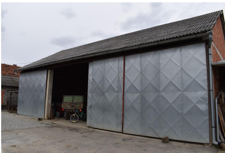
Slika 1. Zatvoreni garažni prostor na „P.P. Marić“