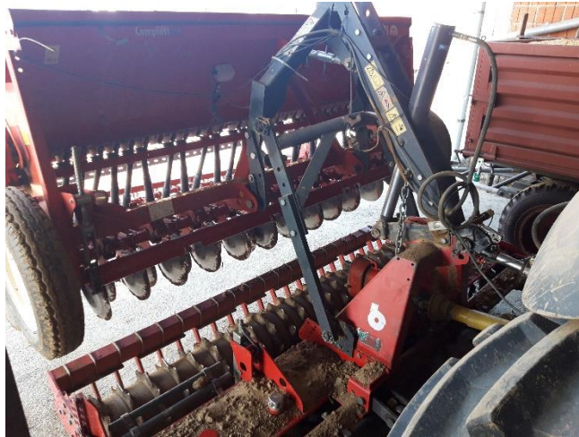
Slika 11. Sijačica „Gaspardo Nina 300“

Sijačica „Gaspardo Nina 300“, slika 11., nošena je žitna sijačica radnog zahvata 3 metra. Volumen spremnika sijačice iznosi 500 litara. Sijačica sije 25 redova u jednom proходу, te se na njoj nalaze ulagači sjemena s raončićima i diskovima. Sijačica također ima mogućnost centralnog podešavanja dubine sjetve. Na gospodarstvu se koristi za sjetvu žitarica i uljane repice, te se uvijek koristi agregatirana sa rotodrljačom.