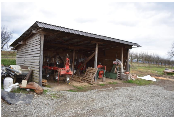
Slika 19. Manji poluzatvoreni garažni prostor na „P.P. Marić“

dva garažna prostora. Strojevi koji se ovdje nalaze su plug, tanjurača i rasipač mineralnog gnojiva. Nedostaci ovog garažnog prostora su ti što podloga na kojoj se strojevi nalaze nije betonska nego su strojevi od zemljane površine odignuti na paletama.