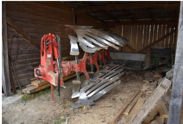
Slika 7. Plug „Vogel Noot 1050 xm“

Plug „Vogel Noot 1050 xm“, slika 7. je četverobrazni plug premetnjak i na gospodarstvu se nalazi od 2008. godine. Plug je opremljen pretplužnjacima (koji osiguravaju dobro zaoravanje kukuruzovine i unošenje stajnjaka) i diskosnim crtalima. Radni zahvat pluga se može podešavati u rasponu od 35 cm do 51 cm. Na gospodarstvu se koristi za prašenje strništa i jesensko oranje.