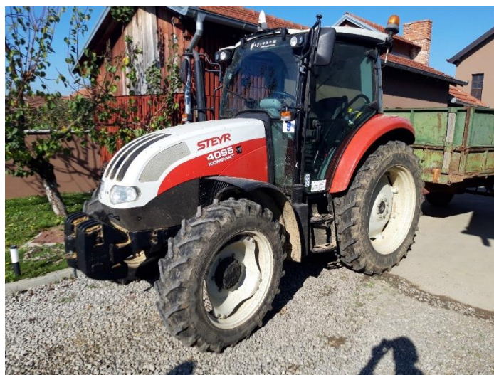
Slika 4. „Steyr 4095 kompakt“

Traktor „Steyr 4095 kompakt“, slika 4., koristi novi FPT F5C 4-cilindrični diesel motor sa „common-rail“ sustavom ubrizgavanja goriva. Snaga se sa motora prenosi dalje pomoću 24x24 Synchronshift mjenjača koji omogućuje kretanje traktora sa 24 brzine za hod u naprijed, odnosno 24 brzine za hod u natrag. Traktor ima pogon na sva četiri kotača. Hidraulički sustav koristi elektronsko upravljanje priključkom, odnosno EHC sustav ( Electronical hitch control ), maksimalna masa koju stražnji hidraulički sustav može podići je 3700 kilograma. Broj okretaja priključnog vratila je kao i kod ostalih modernih traktora 540 ili 1000 okretaja u minuti, ovisno o potrebi. Maksimalna brzina koju ovaj traktor može razviti je 40 kilometara na sat. Masa stroja je 3700 kilograma. Traktor je opremljen GPS (Global Positioning System) sustavom koji se koristi prilikom zaštite bilja i apliciranja mineralnih gnojiva.