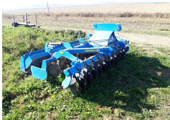
Slika 8. Tanjurača „Agristal“

Tanjurača „Agristal“, slika 8., je nošena tanjurača radnog zahvata 3 metra. Tanjurača se sastoji od 24 diska postavljena u 2 reda sa razmacima između diskova od 75 centimetra. Diskovi su promjera 51 centimetar. Iza diskova je smješten valjak sa šiljcima. Masa tanjurače je 1360 kilograma, a snaga traktora za vuču ove tanjurače (koju propisuje proizvođač) je od 75 do 90 kW. Tanjurača se koristi za dopunsku obradu u predsjetvenoj pripremi tla. Na gospodarstvu se nalazi od 2019. godine.