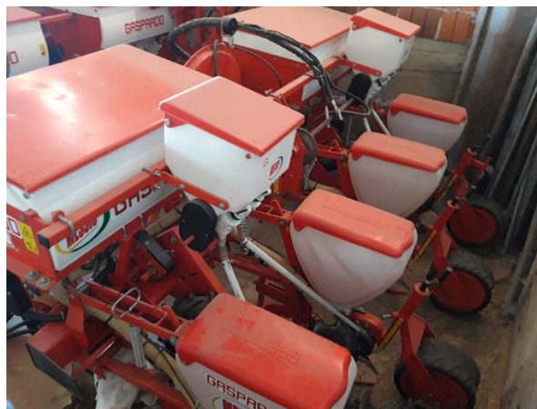
Slika 12. Sijačica za kukuruz „Gaspardo SP 540“

Sijačica za kukuruz „Gaspardo SP 540“, slika 12., je nošena pneumatska sijačica koja u jednom proходу ima mogućnost sisanja četiri reda. Maksimalni razmak između redova je 75 centimetara. Sijačica posjeduje spremnike za gnojivo, te prilikom sjetve ovom sijačicom postoji mogućnost prihrane usjeva. Na gospodarstvu se sijačica koristi za sjetvu kukuruza i suncokreta.