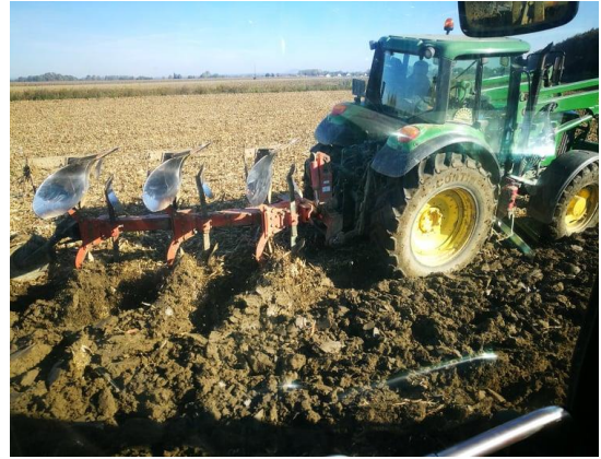
Slika 10: John Deere 6830 predsjetveno oranje