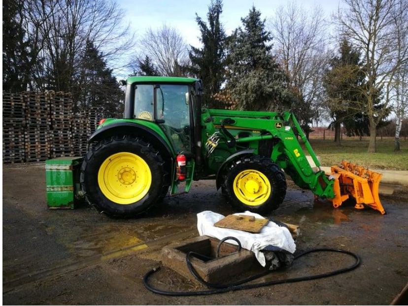
Slika 15: Traktor John Deere 6830 konzervacija i priprema za zimu