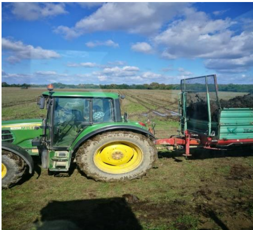
Slika 7: John Deere 6430 razbacivanje krutog stajskog gnojiva