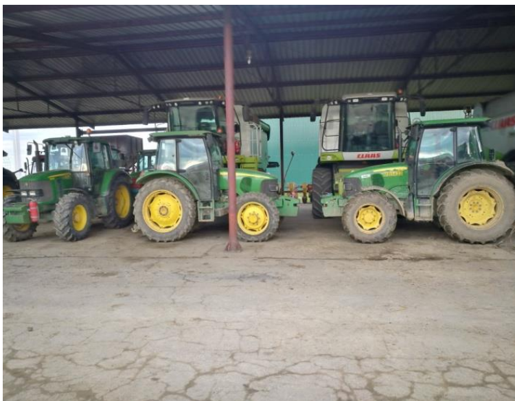
Slika 17: Traktori John Deere 5820 x2 i 6430 (pod nastrešnicom)