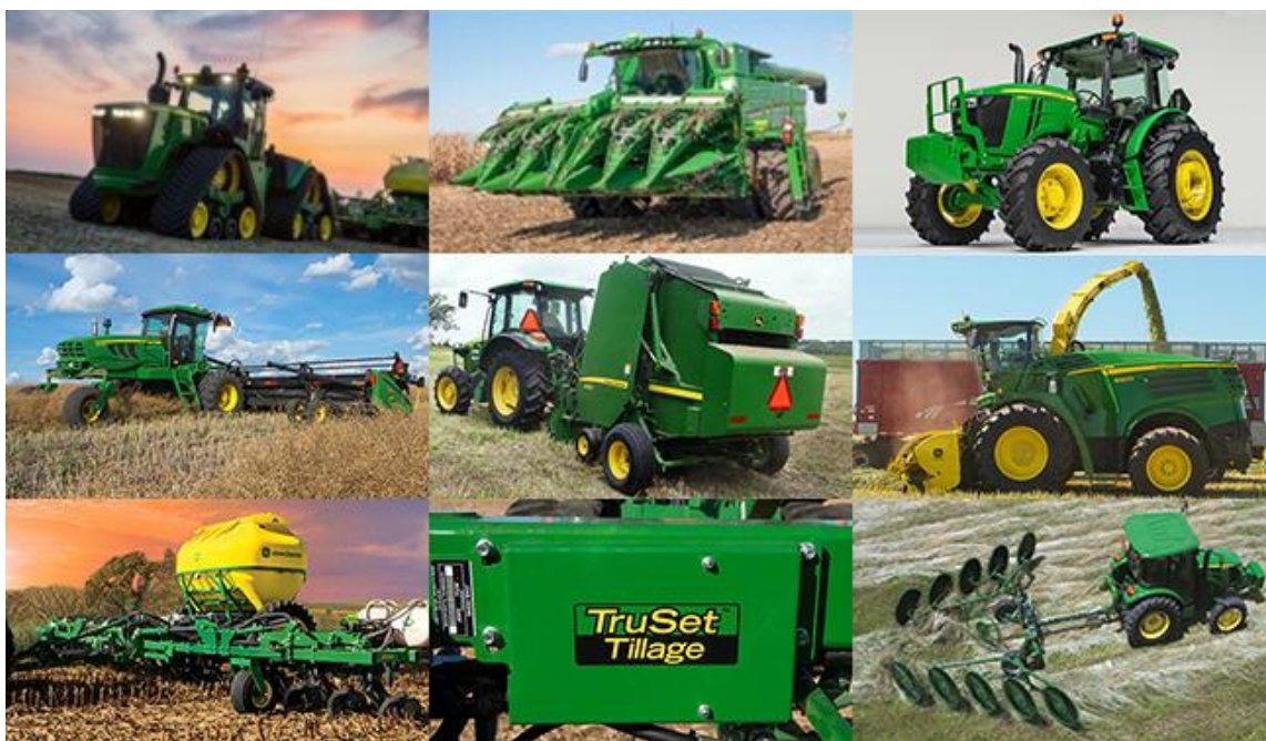
Slika 3: Neki od strojeva marke „John Deere“ dostupni na tržištu

Na Matakovu se koriste samo traktori marke „John Deere“ zbog dokazane pouzdanosti tijekom duljeg perioda poslovanja firme. Lakša opskrba dijelovima, mogućnost brzog i efikasnog popravaka te mnoštvo dostupnih informacija vezanih za traktore i njihove radne strojeve još su neke od prednosti koje su dovele do odabira baš ove marke traktora.