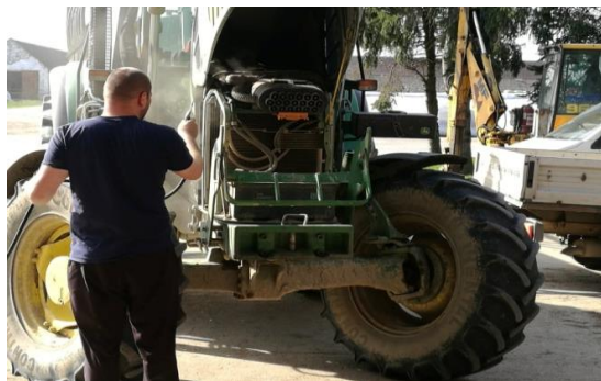
Slika 4: Ispirivanje komprimiranim zrakom nakon obavljanja posla. John Deere 6830

Uz sve navedeno ponekad se dogode i izuzeci kada je povećan opseg posla. Kao što znamo, poljoprivreda i poslovi u poljoprivredi uvelike ovise o vremenskim uvjetima te se neki od navedenih zahvata znaju propustiti jer nisu od relativne važnosti u tim situacijama, kao i oni za koje je siguran da nisu potrebni uzevši u obzir višegodišnje iskustvo rada sa strojevima.