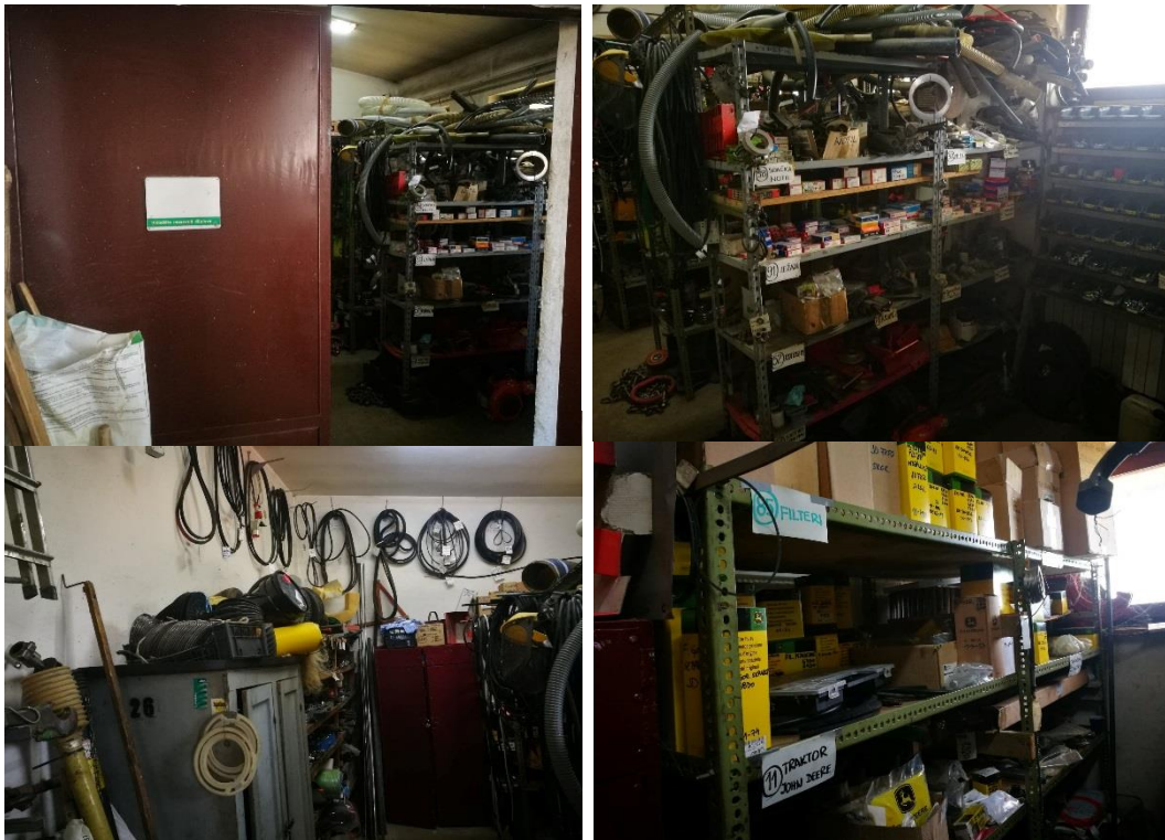
Slika 2: Skladište rezervnih dijelova