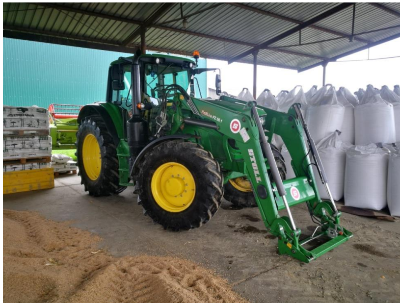
Slika 18: Traktor John Deere 6155 konzervacija i priprema za zimu (pod nastrešnicom)