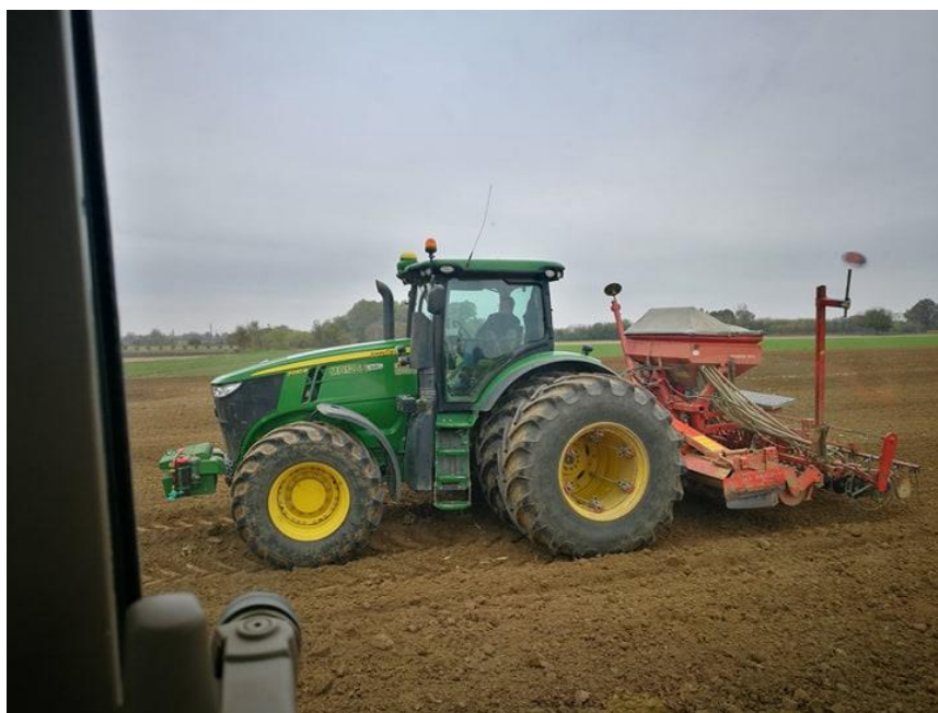
Slika 14: John Deere 7230R sjetva pšenice