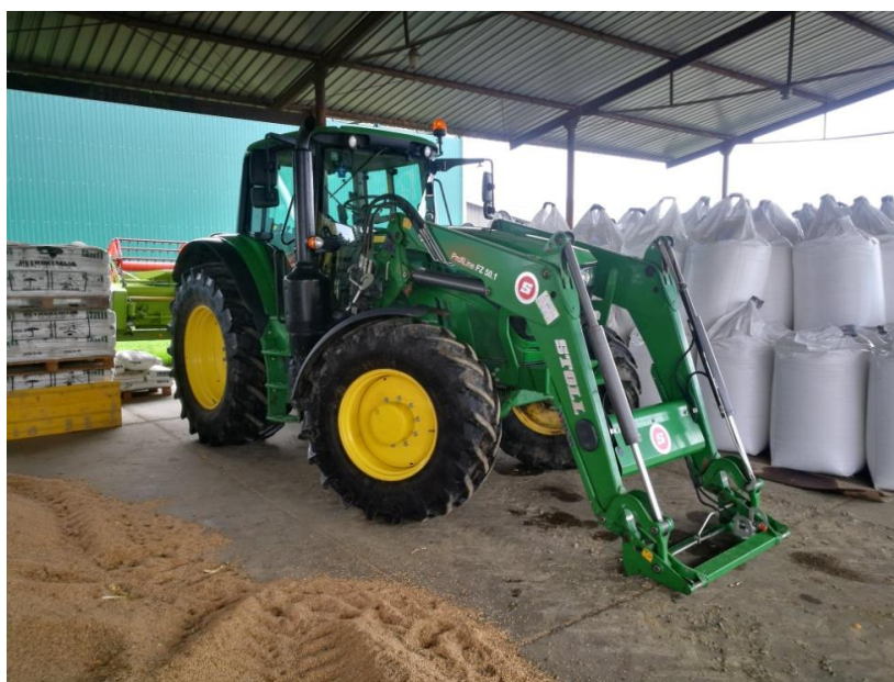
Slika 18: Traktor John Deere 6155 konzervacija i priprema za zimu (pod nastrešnicom)