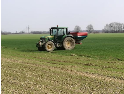
Slika 5: John Deere 6330 razbacivanje umjetnog gnojiva

Manji traktori tvrtke prikazani su na slijedećim slikama: (Slika 5.-8.)