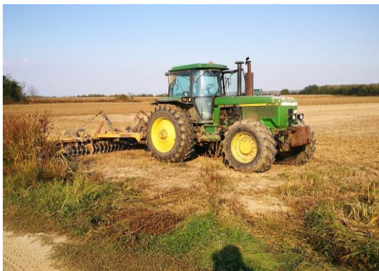
Slika 12: John Deere 4755 tanjuranje

Teški traktori u vlasništvu tvrtke u radu prikazani su na slijedećim slikama: (Slika 12.-14.)