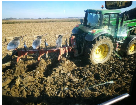
Slika 10: John Deere 6830 predsjetveno oranje