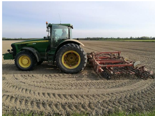
Slika 13: John Deere 8230 drljanje