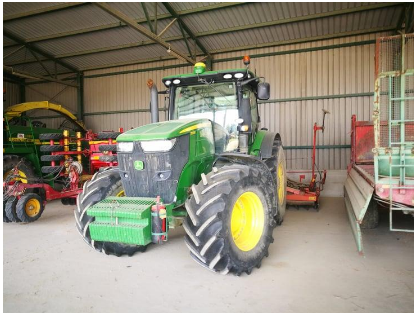
Slika 16: Traktor John Deere 7230R konzervacija i priprema za zimu (pod nastrešnicom)