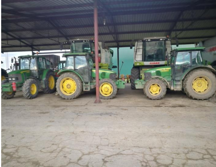
Slika 17: Traktori John Deere 5820 x2 i 6430 (pod nastrešnicom)