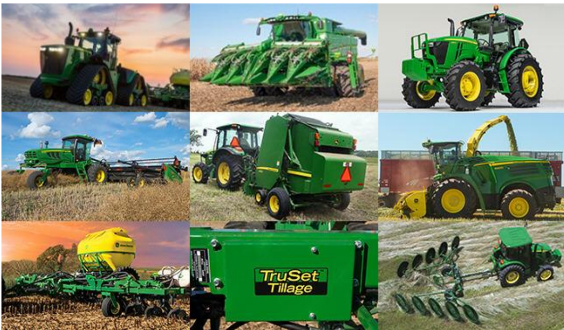
Slika 3: Neki od strojeva marke „John Deere“ dostupni na tržištu

Na Matakovu se koriste samo traktori marke „John Deere“ zbog dokazane pouzdanosti tijekom duljeg perioda poslovanja firme. Lakša opskrba dijelovima, mogućnost brzog i efikasnog popravaka te mnoštvo dostupnih informacija vezanih za traktore i njihove radne strojeve još su neke od prednosti koje su dovele do odabira baš ove marke traktora.