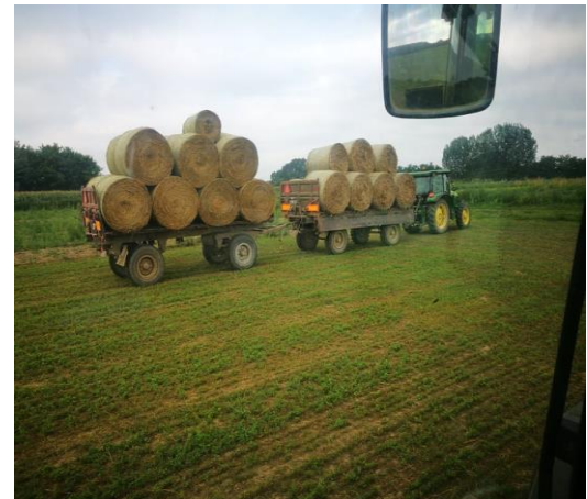
Slika 8: John Deere 6330 transport rolo bala sijena