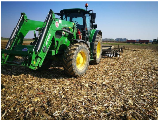
Slika 9: John Deere 6155 tanjuranje

Traktori srednje kategorije u vlasništvu tvrtke u radu prikazani su na slijedećim slikama: (Slika 9.-11.)