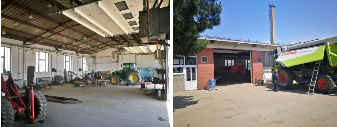
Slika 1 : Automehaničarska radionica

U nadzoru ili kao poslovođa jedan je diplomirani mehanizator te jedan ekonomist koji se bavi nabavkom i dovozom rezervnih dijelova i ostalih potrepština.