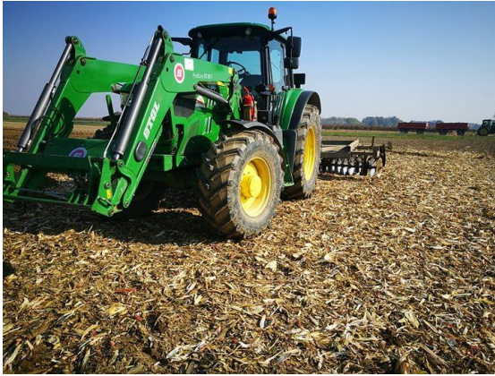
Slika 9: John Deere 6155 tanjuranje

Traktori srednje kategorije u vlasništvu tvrtke u radu prikazani su na slijedećim slikama: (Slika 9.-11.)