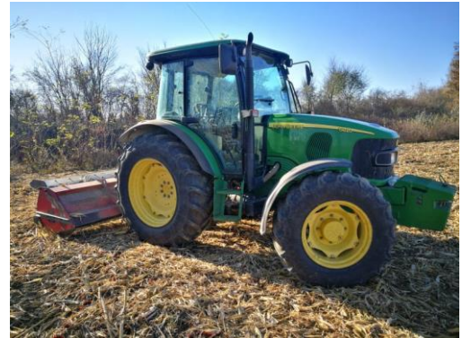
Slika 6: John Deere 5820 malčiranje biljnih ostataka kukuruza