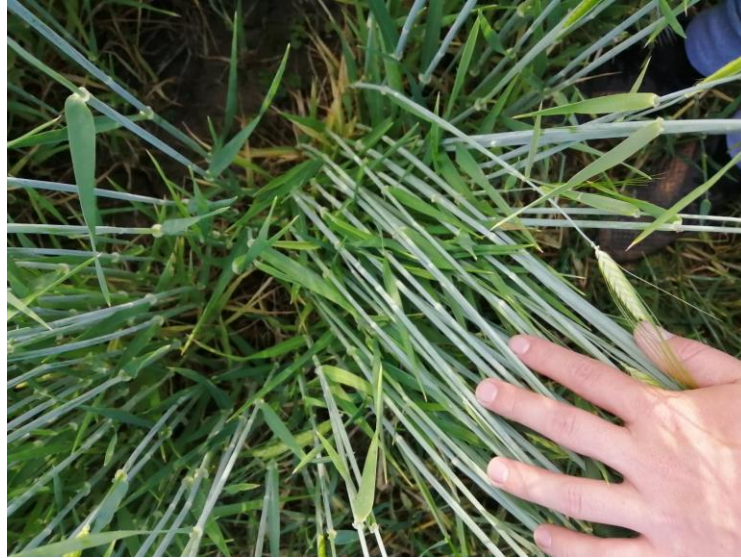
Slika 2. Stabljike ječma

Stabljika – je šuplja, člankovita i cilindrična (Slika 2.). Razvija 5-6 članaka. Boja koljenaca je do sazrijevanja zelena ili ljubičasta, a poslije slamnato-žuta. Boja stabljike je zelena ili ljubičasto-zelena od antocijana. U punoj zriobi dobije slamnato-žutu boju. U odnosu na stabljike drugih žitarica stabljika ječma je manje otporna na polijeganje (osim patuljastih sorti).