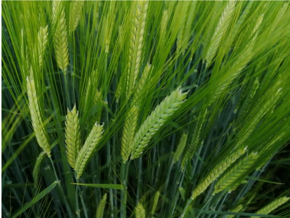
Slika 1. Ječam

Ječam je žitarica iz porodice trava (lat. Poaceae ) i zauzima peto mjesto u svjetskoj proizvodnji žitarica (Gagro 1997.)