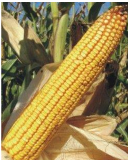
Slika 4. Klip zubana

b) Klip - formira se na vrhu bočnih izdanaka iz točke rasta u pazuhu listova na glavnoj stabljici, a može i na zapercima (Slika 4.). Sastoji se od zadebljalog vretena (oklasak) na kojem se uzdužno u parnim redovima nalaze klasići sa ženskim cvjetovima. Klip je po građi analog metlici, s tim da su reducirane bočne grane. Vreteno se klipa (oklasak) nalazi na dršci klipa, a u zreлом je stanju različite boje, od bijele do raznih nijansi crvene boje te čini 18-20 % od ukupne mase klipa. Broj redova parnih klasića može se kretati od 4 do 12. Kod većine naših hibrida kreće se od 6 do 10. Uvijek je paran, a vezan je za paran broj klasića na vretenu klipa ( http://www.pfos.hr/upload/documents ).