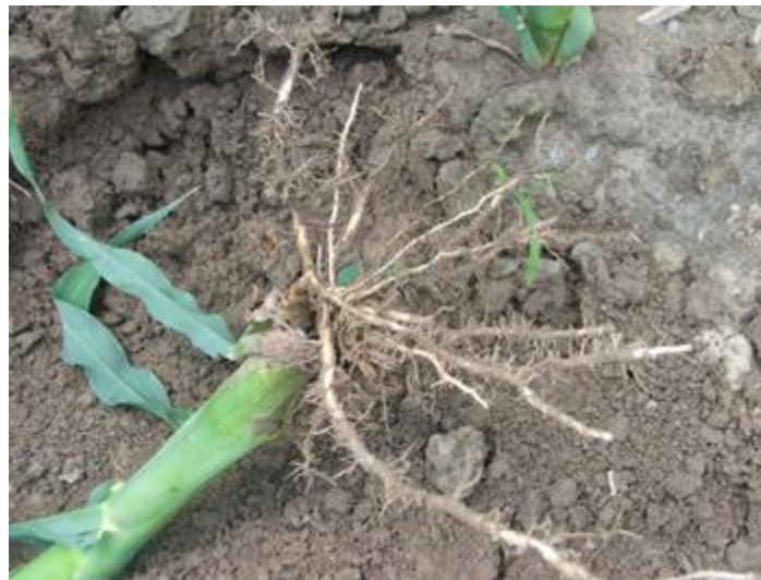
Slika 1. Korijen kukuruza

razvoja ovog korijenja dolazi najčešće u slučaju kada je sjetva preduboka (10 i više cm). Uloga ovog korijenja u ishrani biljke gotovo je beznačajna. Zračno se korijenje razvija iz nodija stabljike iznad površine tla, pa se naziva i nadzemno nodijalno korijenje. Ako agrotehničkim zahvatima (zagrtanjem) dospije u tlo, gubi zelenu boju, počne se granati, stvarati korijenove dlačice te može u cjelini ili djelomično postati funkcionalno odnosno vršiti apsorpciju hranjivih tvari. Sekundarno (adventivno) korijenje razvija se na bazalnom interkalarnom meristemu donjih podzemnih članaka stabljike, pa se naziva i podzemno nodijalno korijenje.