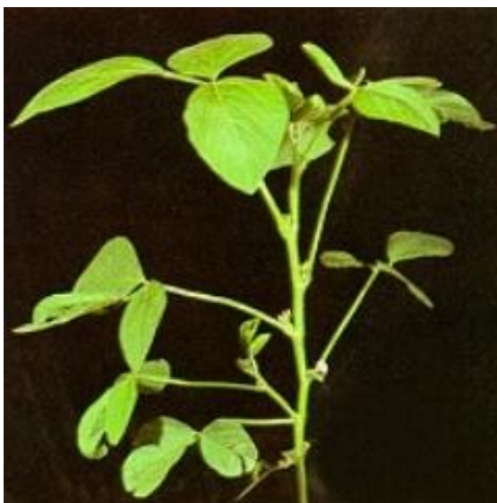
Slika 7. Stabljika soje na početku cvatnje

Stabljika – je uspravna (Slika 7.), ali postoje i forme sa polegnutom i polupolegnutom stabljikom, no one nisu zanimljive za proizvodnju. U početku svog rasta i razvoja stabljika je zelena, a kasnije odrveni i postaje vrlo gruba. Većina sorti u merkantilnoj proizvodnji ima relativno uspravnu i čvrstu stabljiku visine 80-120 cm i visine do prve mahune 4-16 cm, ovisno o sorti i načinu uzgoja. Sorte koje uspijevaju u uvjetima velikog vegetacijskog prostora u cjelini se jače grananju, tako da imaju manje-više grmolik izgled. U gustom usjevu grananje često sasvim izostaje. Za mehaniziranu žetvu je najbolje da su 10-15 cm iznad tla.