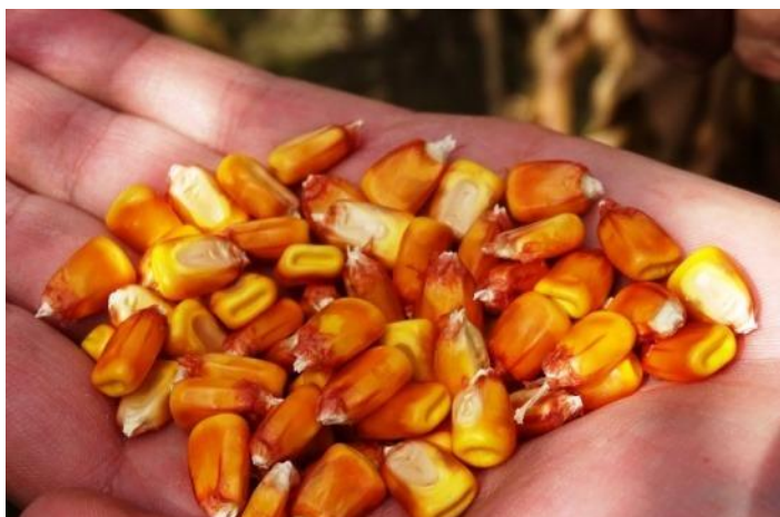
Slika 5. Zrno kukuruza