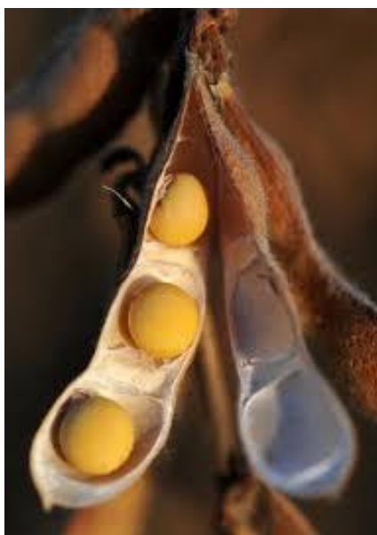
Slika 10. Plod i sjeme soje

Sjeme – je sastavljeno od klice (embrija), dva kotiledona i sjemene opne (teste) (Slika 10.). Klica se nalazi u donjem dijelu sjemena, između kotiledona, a sastoji se od klicina korijenčića i klicina pupoljka. Sjemeni opna završava se sjemenim pupkom ( hilum ), a to je mjesto na sjemenki kojim je ona pričvršćena na mahunu. Boja sjemena varira ovisno o sorti, a može biti žuta, zelena, smeđa i crna, kao i kombinacija ovih boja. Masa 1000 zrna varira od 100--300 g, a hektolitarska od 70-85 kg.