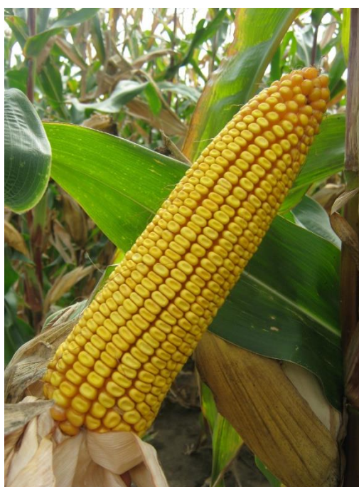
Slika 11. Klip hibrida Drava 404

Na OPG-u „Ivica Podboj“ sjetva kukuruza je izvršena pneumatskom kukuruznom sijačicom. Sjetva je započela u optimalnom agrotehničkom roku 18.04.2019., jer je za ovaj dio Republike Hrvatske optimalni rok sjetve kukuruza od 10.-25. travnja. Dubina sjetve je iznosila od 4-8 cm, na međuredni razmak od 70 cm i razmak unutar reda od 20-25 cm. Na površinama od 5 ha uzgajan je hibrid Drava 404, a na 2 ha hibrid kukuruza Tomasov 400, oba s Poljoprivrednog instituta Osijek. Najprodavaniji OS hibrid kukuruza i najtraženiji u FAO grupi 400. Drava 404 hibrid je iznimne „plastičnosti“, što znači da se odlično prilagođava proizvodnji u najrazličitijim proizvodnim uvjetima. To znači da je ovaj hibrid visoko tolerantan na uzgoj u uvjetima niske opskrbljenosti tla hranjivima i na nedostatak optimalne opskrbljenosti tla vodom. Međutim, u uvjetima primjene visoke razine agrotehnike i u povoljnim klimatskim uvjetima, ovaj hibrid daje svoj puni potencijal rodosti. Navedena svojstva, uz to što je Drava 404 namijenjena za sve vidove proizvodnje (suho zrno, branje, silaža zrna ili cijele biljke) su proizvođači prepoznali u vidu sigurnosti proizvodnje te je to razlog i daljnjeg porasta prodaje ovog hibrida. Izvrstan rani porast, robusna i lisnata stabljika produljenog zelenog stanja te pravilan i krupan klip s dubokim zrnom odlike su Drave 404 (Slika 11.).