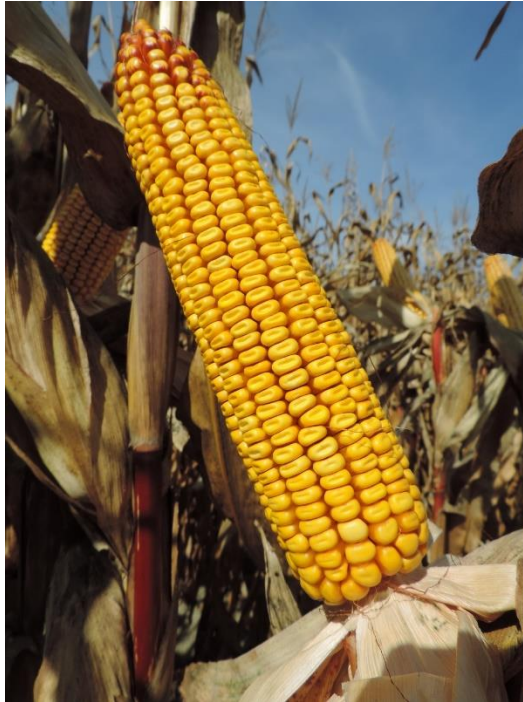
Slika 12. Klip hibrida Tomasov 400

klipom. Zrno je duboko, glatke krunice i crvenkasto pri osnovici (Slika 12.). Tomasov se također odlikuje dubokim i razgranatim korijenovim sustavom, koji mu daje bolju mogućnost crpljenja vode i hranjivih tvari. U punoj agrotehnici i u optimalnim vremenskim uvjetima Tomasov će reagirati vrhunskim prinosima zrna, a što je i njegova osnovna namjena proizvodnje.