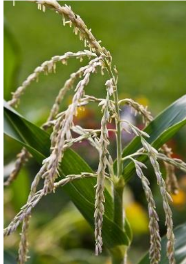
Slika 3. Metlica kukuruza