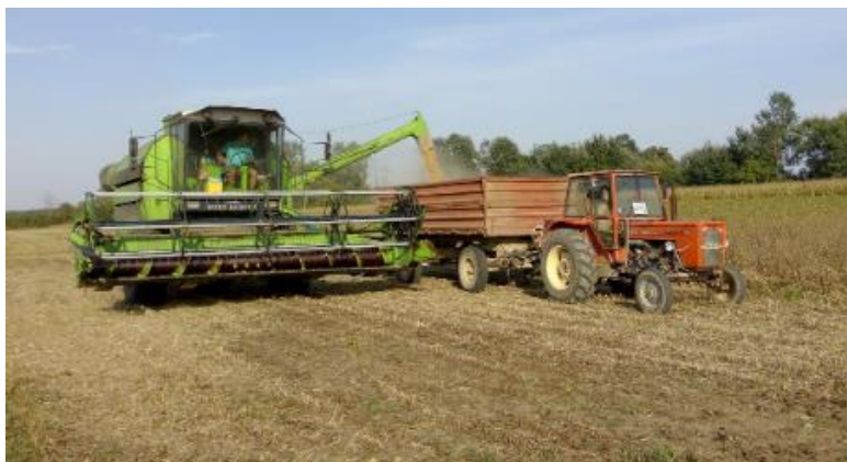
Slika 16. Žetva soje

Žetva soje izvršena je žitnim kombajnom Deutz-Fahr 10.09.2019. godine kada je vlaga bila 11,8 % (Slika 16).