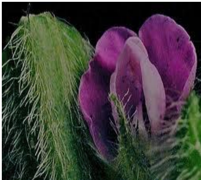
Slika 9. Cvijet soje

Cvijet - je karakterističan za sve mahunarke, a izgledom podsjeća na leptira (Slika 9.). Sastoji se od šest lapova, pet latica, deset prašnika i tučka. Gornja je latica najveća i naziva se zastavica, dvije latice sa strane nazivaju se krila, a dvije donje lađica, jer su srasle u obliku lađe. Cvjetovi su bijele, ljubičaste ili kombinirano bijeloljubičaste boje. Boja je uvjetovana antocijanom.