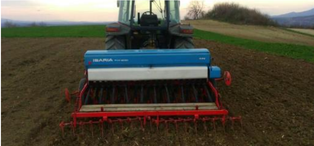
Slika 15. Sjetva soje