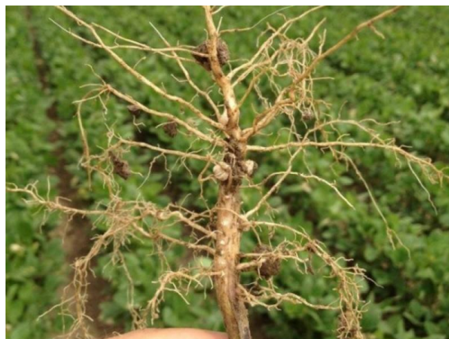
Slika 6. Korijen soje s kvržicama

Korijen – je i velike upojne sposobnosti. Sastoji se od jakog vretenastog korijena i velikog broja sekundarnog korijenja rasprostranjenog u različitim dubinama tla. Glavni korijen dopire do 60 cm dubine, a postrano korijenje i do 150 cm. Korijenove dlačice nastaju tako da žive stanice rizoderme korijena izrastu prema van i formiraju jednostanične tvorevine duge 1,15-8 mm. Budući da dlačice i drugi dijelovi rizoderme nisu prekriveni kutikulom, mogu kroz stijenku “uzimati” vodu iz tla. Dotok vode olakšavaju i tanke stijenke dlačica, koje su zbog tankoće savitljive pa se lako mogu prisloniti uz čestice tla. Na korijenu soje razvijaju se kvržice (lat. nodule ) u kojima žive kvržične bakterije, Rhizobium japonicum (Slika 6.). U kvržicama korijena bakterije žive u simbiozi s biljkom od koje dobivaju ugljikohidrate (šećere), a zauzvrat biljku opskrbljuju dušikom. Kvržice su prave "tvornice" dušika i u njima bakterije pretvaraju anorganski dušik (N 2 ) iz atmosfere, u kojoj ga ima u izobilju (gotovo 80 %) u, za biljku, pristupačni oblik (nitratni dušik, NO 3 - ). Kvržice se počinju stvarati na korijenu soje od trenutka infekcije korijena bakterijama Bradyrhizobium japonicum kroz korijenove dlačice.