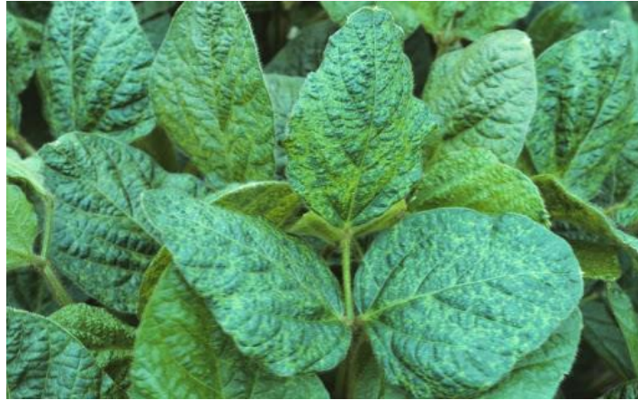
Slika 8. List soje

Cvijet - je karakterističan za sve mahunarke, a izgledom podsjeća na leptira (Slika 9.). Sastoji se od šest lapova, pet latica, deset prašnika i tučka. Gornja je latica najveća i naziva se zastavica, dvije latice sa strane nazivaju se krila, a dvije donje lađica, jer su srasle u obliku lađe. Cvjetovi su bijele, ljubičaste ili kombinirano bijeloljubičaste boje. Boja je uvjetovana antocijanom.