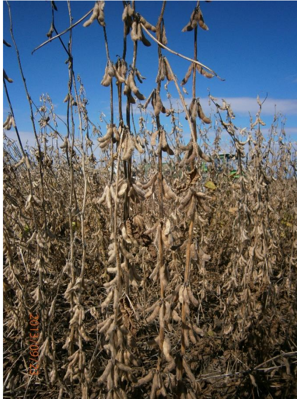
Slika 13. Stabljike sorte Ika u zriobi