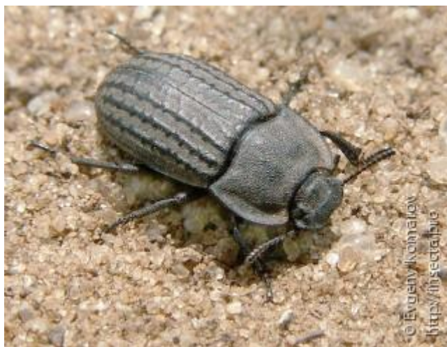
Slika 1. Imago pjeskara

Pjeskar Opatrum sabulosum (slika 1.) se uglavnom javlja pojedinačno. Tijelo mu je tamno-sive boje te ima hrapavo pokrilije. Na pokrilije se lijepi zemlja i zbog toga pjeskar ima prljav izgled. Prednost daje lakšim pjeskovitim tlima (Rees, 2004.). Napada kukuruz, suncokret, hmelj, povrće, ponik šećerne repe i brojne druge kulture. Štete koje prave ličinke nisu poznate, ali žive u tlu i hrane se prizemnim dijelovima stabljike i korjenčićima. Odrasli oblik prezimi, životni vijek je dvije godine.