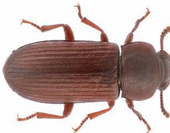
Slika 4. Imago malog brašnara

https://e-insects.wageningenacademic.com/tribolium_confusum