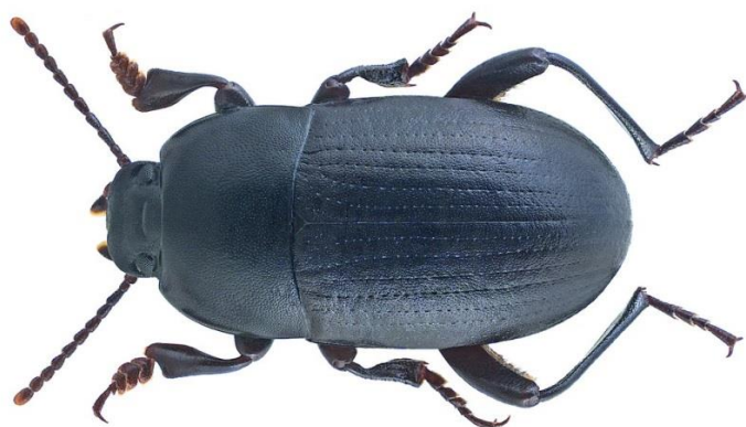
Slika 2. Imago kukuruznog crnog kornjaša

https://www.flickr.com/photos/coleoptera-us/28588508760