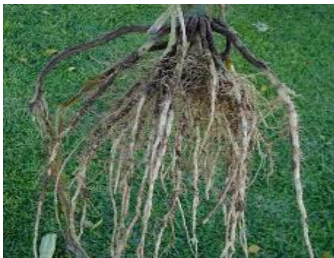
Slika 2. Korijen kukuruza šećerca