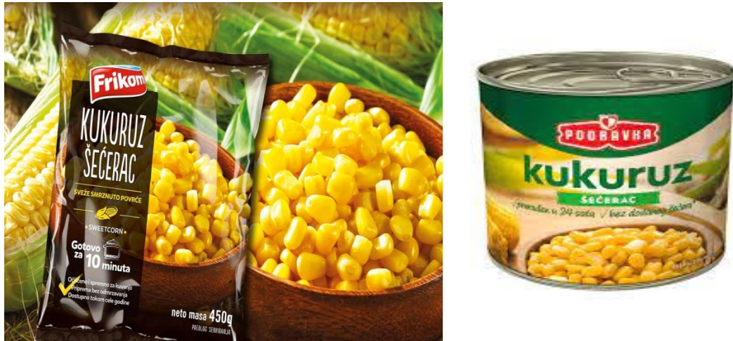
Slika 4. Smrznuti i konzervirani kukuruz šećerac