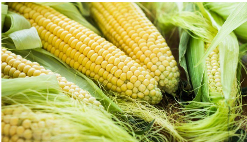
Slika 5. Klipovi kukuruza šećerca

Također, sama prednost ove biljke jeste što se svi dijelovi mogu koristiti, ostaje samo korijen kao neiskorišten dio u tlu, koji popravljaja strukturu tla, potiče mikrobiološku aktivnost tla te obogaćuje tlo organskim tvarima što predstavlja jako veliku korist korijena zaključuje Rapčan (2014.).