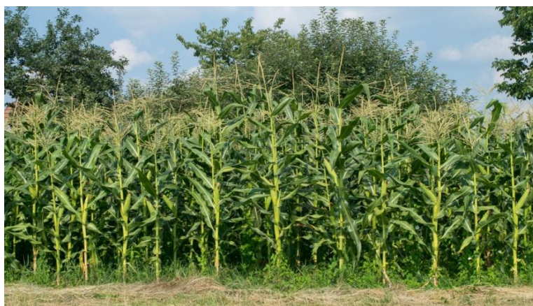
Slika 1. Polje kukuruza šećerca

Kukuruz šećerac se uzgaja u cijelom svijetu, s obzirom područje uzgoja mu je jako veliko, to mu omogućava različitu dužinu vegetacije , raznoliku mogućnost upotrebe te sposobnost da uspijeva na lošijim tlima i lošijim klimatskim uvjetima. (Slika 1.)