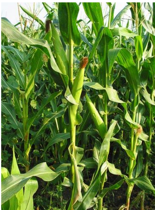
Slika 3. Prikaz stabljike i kukuruza šećerca

Inače, u odnosu na obični kukuruz stabljika kukuruza šećerca je nešto niža. Čvrsta stabljika ide u visinu 1,5-2,5m, člankovita je, s izraženim koljencima i međukoljencima. Iz svakog se koljenca razvija list koji se sastoji iz rukavca koji obuhvata stabljiku i od jako duge plojke (oko pola metra). Zaperci se razvijaju iz najnižih nodija glavne stabljike s tim da je kukuruz šećerac njima skloniji nego obični kukuruz. (Slika 3.)