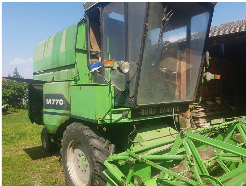
Slika 2. Kombajn M – 770