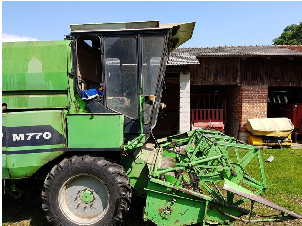
Slika 4. Kombajn M – 770