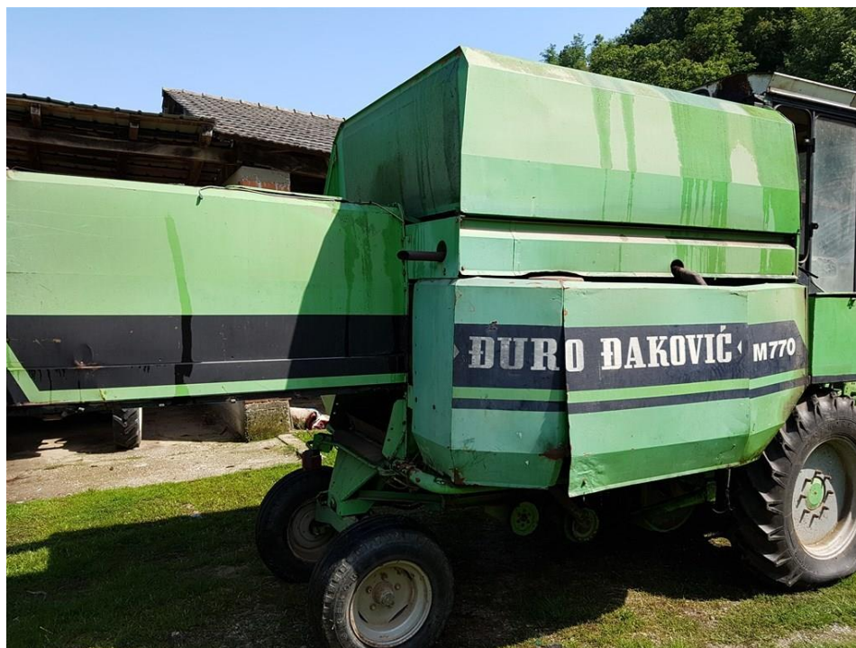
Slika 3. Kombajn M – 770