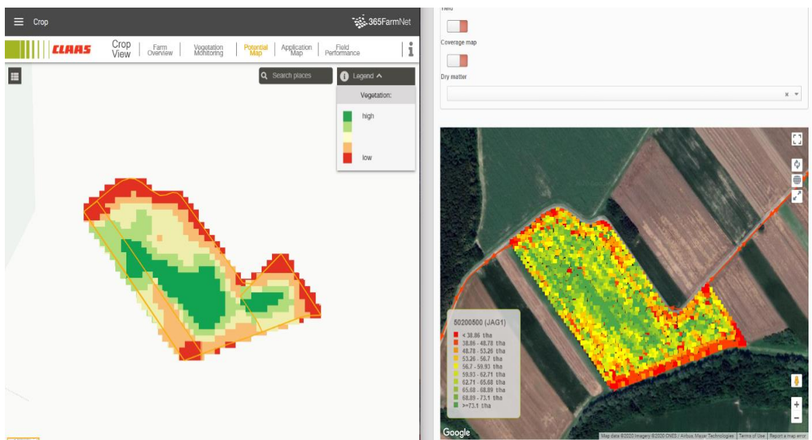
Slika 7. Satelitski snimak vegetacije i karta prinosa

Rezultat primjene ovakve tehnologije je vidljiv već u prvoj godini kako smo pravilno gospodarili s inputima potrebnim za proizvodnju, reagirali u pravo vrijeme te biljci dali količinu hranjiva koja je potrebna za njen razvoj. Jasno je kako je prinos veći a ušteda repromaterijala znatna. Da su podatci koje dobivamo iz satelitskog snimka vjerodostojni vidimo u usporedbi satelitskog snimka i karte prinosa koju smo dobili iz silokombajna nakon silaze kukurza s Claas-om Jaguar 960.