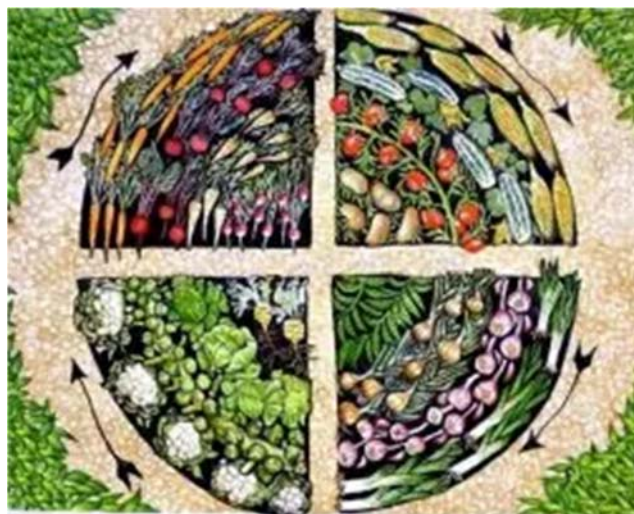
Slika 10. Rotacija usjeva