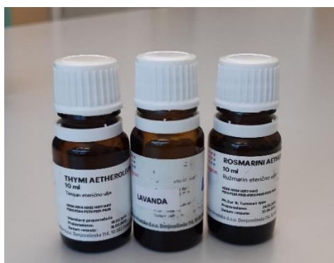
Slika 1. Eterična ulja koja su potrebna za izvođenje pokusa (lavanda, ružmarin i timijan)

Na slici 1 prikazana su eterična ulja koja su korištena prilikom provedbe ovoga eksperimenta.