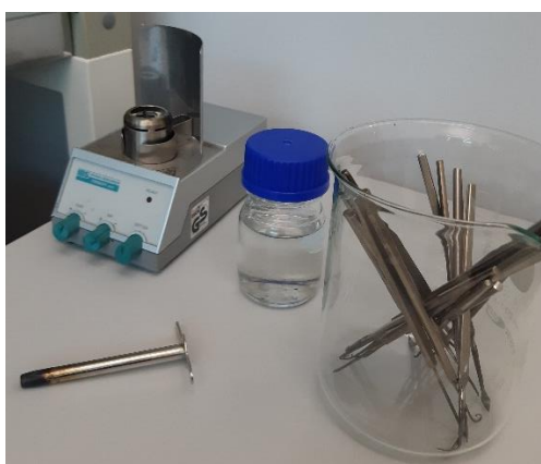
Slika 2. Pribor za postavljanje pokusa

Osim eteričnih ulja, u navedenom je istraživanju korišten i ostali pribor koji je prikazan na sljedećim slikama 2, 3 i 4.