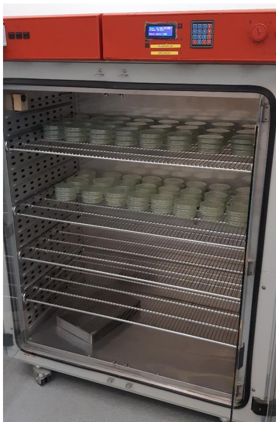
Slika 7. Termostat komora