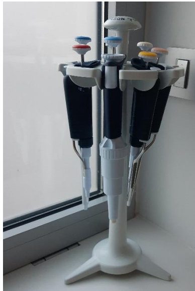
Slika 4. Pipete