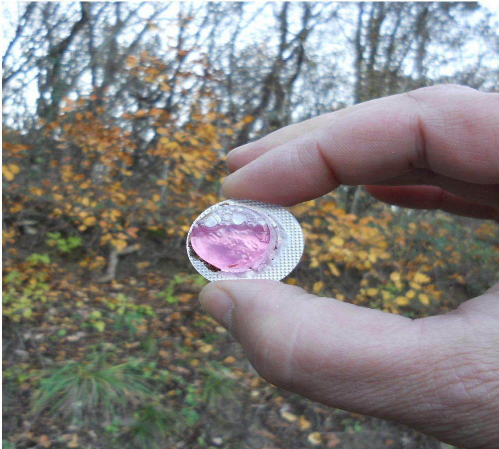
Slika 3. Unutrašnji dio mamca s cjepivom