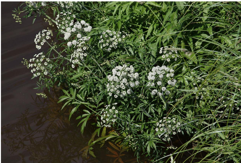
Slika 30. Otrovná trubeljka (stabljika, listovi, cvjetovi)

Plod je maleni kalavac, rumenosmeđe boje, široko ovalnog oblika s dvije sjemenke. Plod je najčešće do 2 mm širok i 1,5 mm dug (Hulina 2011., Lesinger, 2006.b).