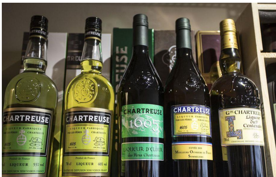
Slika 17. Alkoholno piće Chartreuse

Svi nadzemni dijelovi biljke (listovi, peteljke, stabljike, plodovi) i podzemni dijelovi biljke imaju ugodan aromatičan miris i okus koji je isprva slatkast, a potom ljut i gorak te se upotrebljavaju kao začin za juhe, variva, umake, majoneze i salate. Od mladih i svježih stabljika kuha se kompot, a mogu se dodavati i pekmezima. Kandiraju se mlade stabljike i korijen i služe kao slastica. Od korijena se još pravi i brašno. Osušeni i smrvljeni listovi koriste se u aromatizaciji sireva (Grlić, 1990., Hulina, 2011., Kolak i sur., 2002.a).