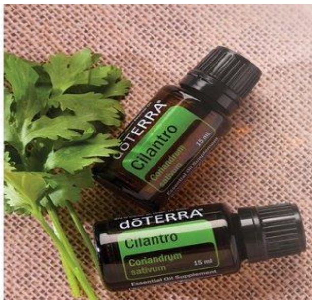
Slika 9. Eterično ulje korijandra

zadaha iz usta, a u kombinaciji sa stolisnikom i turicom služi u liječenju ciroze jetre i artritisa. Ulje iz sjemenki primjenjuje se u smirivanju bolova hemoroida. Pokazao je i učinkovitost kod snižavanja povišene količine kolesterola u krvi i dijabetesa (Borovac, 2005., Galle Toplak, 2005., Gastón i sur., 2016., Hulina, 2011., Tucakov, 1990., Reader's digest, 2006.).