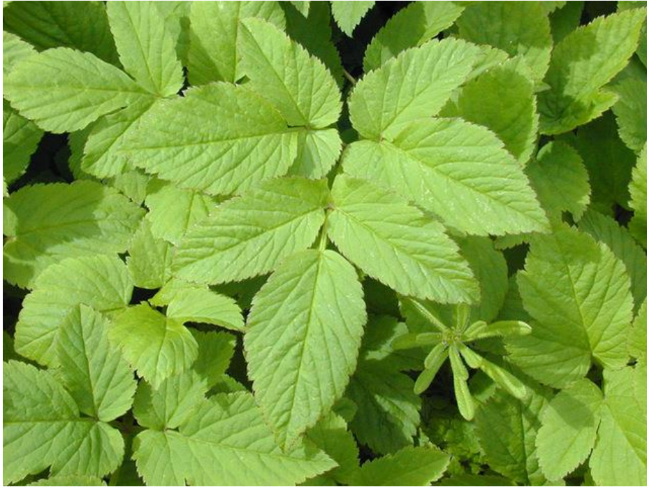
Slika 22. Listovi sedmolista