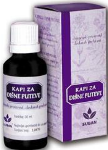
Slika 6. Pripravak od komorača - kapi za dišne puteve

kao sredstva za bojanje kozmetičkih proizvoda. U kozmetičkoj industriji eterično ulje dodaje se u kreme, zubne paste, sapune itd. (Tucakov, 1990., Reader's digest, 2006.).