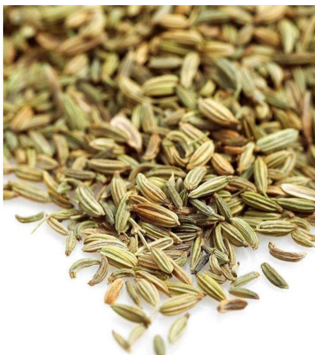
Slika 19. Anisove osušene sjemenke

ublažavanje zubobolje (Grünwald i Jänicke, 2006.). U narodnoj medicini biljka anisa koristi se protiv želučanih bolova, kronične dijareje, povraćanja, mučnine te želučano-crijevnih problema. Čaj od anisa pomaže kod ženskih bolesti i menstrualnih problema. Stimulativno djeluje na rad bubrega i mjehura. Dobro djeluje na peristaltiku i crijevnu mikrofloru te pomaže pri eliminaciji raznih parazita. Čaj je dobar protiv prehlade i bolesti dišnih organa jer pospješuje iskašljavanje i smiruje sluznicu te u liječenju bronhitisa i katara dišnih organa. Zatim, čaj se preporučuje za ublažavanje tegoba bolesnih bubrega, reume i gihta, a povoljno djeluje na jetru i slezenu (Ašić, 1999., Borovac, 2015., Lesinger, 2013., Mindell, 2002.).