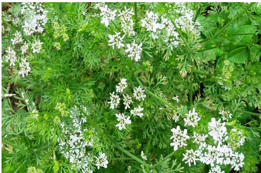
Slika 8. Cvjetovi, listovi i stabljike korijandra

Plodovi su okrugli, crvenkastosmeđe boje, s 2 sjemenke, od 1,5 do 3 mm široki. Krajem ljeta i početkom jeseni dozrijevaju plodovi, a biljka poprima ugodan miris. Masa 1000 sjemenki iznosi 5 do 7 grama (Hulina, 2011., Šilješ i sur., 1992.).