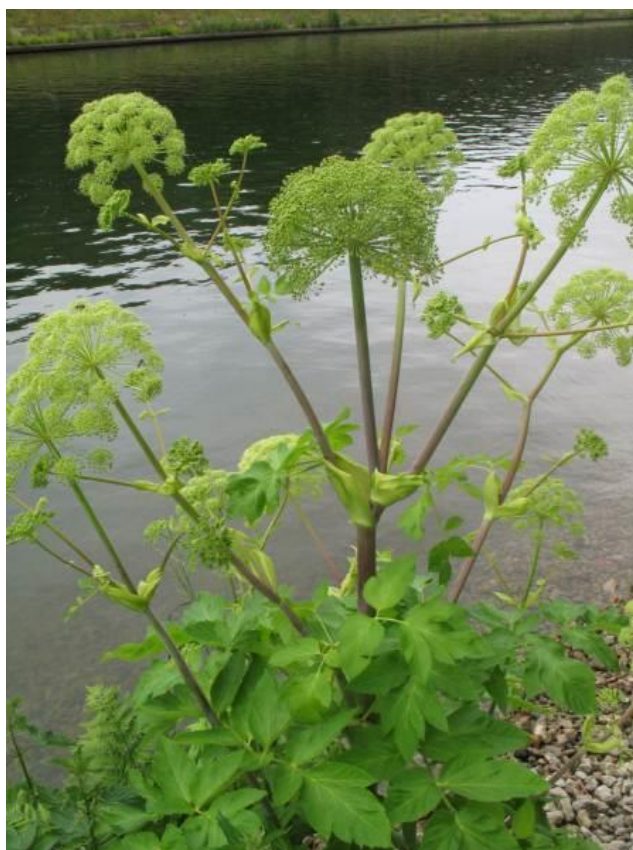
Slika 14. Biljka anđelike (listovi, stabljika, cvjetovi)

Anđelika (angelika, anđeoski korijen, trubaljka, siriš, anđeo, korijen Svetog Duha) je čvrsta i krupna dvogodišnja ili višegodišnja aromatična biljka, može narasti i do 250 cm u visinu (slika 14.). Ima repasto zadebljali korijen promjera 3 do 9 cm, iz kojeg se odvaja brojno adventivno korijenje sa žućkastim mliječnim sokom. Stabljika je snažna i uspravna, okrugla, šuplja, crvenkastosmeđe boje, u gornjem dijelu razgranjena, a pri dnu debela. Listovi su 2 do 3 puta rasperani i oštro nazubljeni na rubovima. Donji listovi su veliki, do 90 cm dugi i imaju dugačku peteljku. Listovi na stabljici imaju vrećasto proširen rukavac kojim obuhvaćaju stabljiku (Grlić, 1990., Hulina, 2011.).