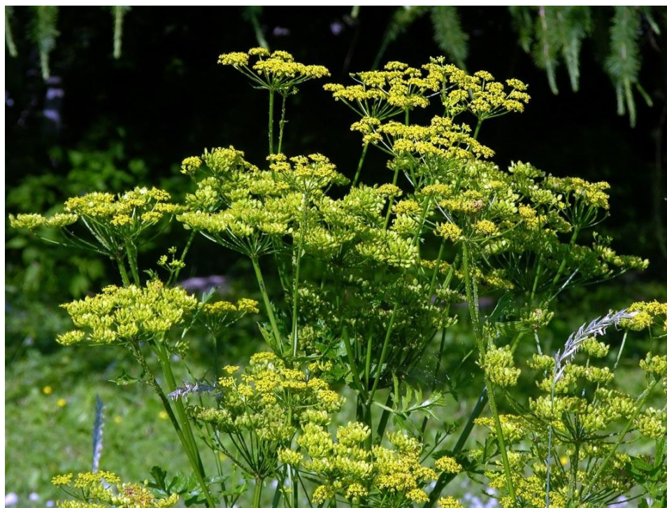
Slika 11. Cvjetovi, listovi i stabljike pastrnjaka

Plod je jajoliki i široko okriljeni kalavac. Plod sadrži dva merikarpa, svaki s po jednim sjemenom, a sakupljaju se u jesen i tijekom zime (Hendrix i Trapp, 1992., Hulina, 2011.).