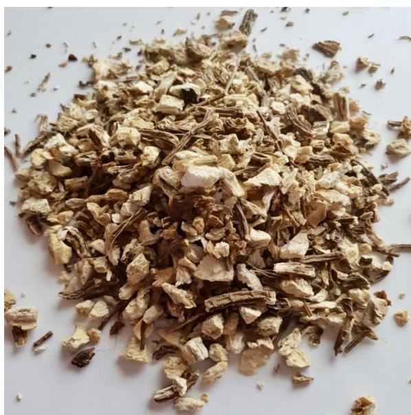
Slika 15. Osušeni korijen anđelike

U narodnoj medicini rabi se cijela biljka, od listova i sjemena spravljaju se čajevi, a korijen se koristi za pripremu ulja, tinkture i čaja. Podanak se koristi od 10. stoljeća kao lijek za jačanje živčanog sustava i jedan je od najboljih sredstava za izlučivanje vode iz tijela. Anđelika je vrlo ljekovita biljka, a koristi se u liječenju slabog želuca i želučanih bolesti tako da smiruje trbušne bolove te jača i grije cijeli probavni trakt. Kod žena ublažava menstrualne tegobe. Jača i čisti krv, izbacuje otrove i štetne tvari kroz kožu, potiče znojenje i otvara apetit. Čaj od anđelikinog korijena ublažava tegobe izazvane migrenom, otklanja vrtoglavicu, povećava gipkost žila. Grgljanjem čaja pročišćava se grlo, usna šupljina i jača sluznica dišnih organa. Čaj pospješuje izlučivanje žuči i želučanih sokova, smiruje nervozu i smanjuje bolove. Također, sprječava taloženje kalcija, snižava krvni tlak, smanjuje kolesterol, liječi bolesne bubrege, a upotrebljava se i za liječenje reume i gihta. Osim toga, ublažava svrbež koji izazivaju razni kožni nametnici (Ašić, 1999., Hulina, 2011., Lesinger, 2013., Mindell, 2002.).