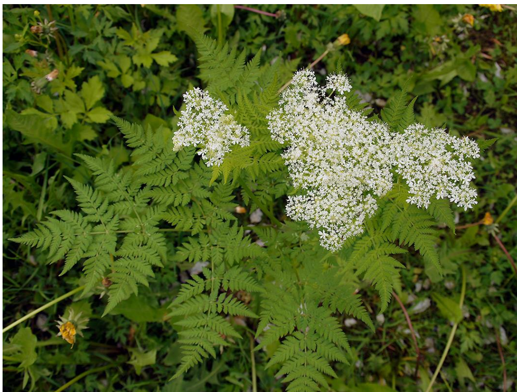
Slika 24. Biljka čehulje (Listovi i cvjetovi)

Plodovi su izduženo piramidasti, uspravni, do 2,5 cm dugi i imaju jako istaknuta rebra (slika 25.). Zbog slatkog mirisa čehuljini plodovi dobra su zamjena za anis, komorač itd. (Dobraval'skytė i sur., 2013.a, Grlić, 1990.).