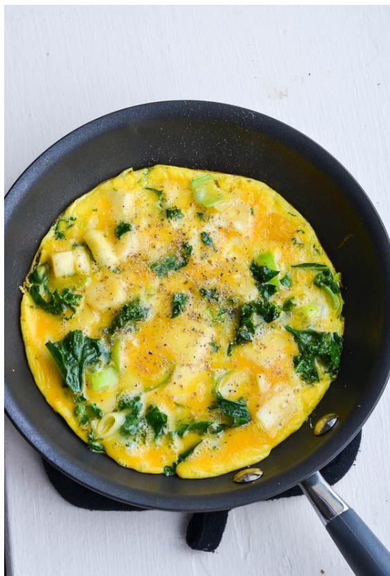
Slika 13. Omlet od pastirnjaka, poriluka i kelja

mladi izdanci mogu se koristiti kuhani s drugim zelenim povrćem ili dodavati juhama (Launert, 1981.). Plodovi se skupljaju u jesen. Zreli plod vrlo je aromatičan, naročito usitnjen, te se koristi kao začim u mnogim jelima (Grlić, 2005., Hulina, 2011., Lim, 2015, Matejić, 2014.).