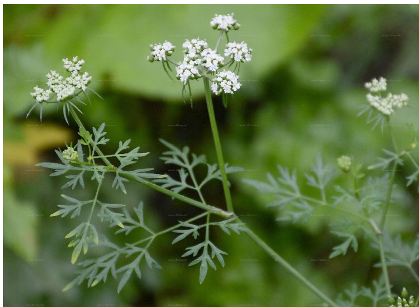
Slika 33. Biljka divljeg peršina (stabljika, listovi, cvjetovi)

Plod je kalavac od dva merikarpa (slika 34.). Plodovi su okruglasti, imaju 5 izraženih rebara, a dugi su 2,5-5 mm (Hulina, 2011., Rukavina, 2012.).