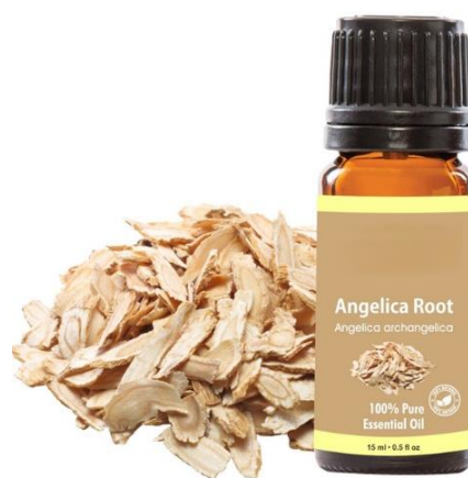
Slika 16. Eterično ulje korijena anđelike