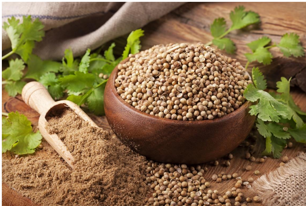
Slika 10. Mljeveni i svježi plodovi korijandra kao začin

prehrambenoj industriji kao zamjena za kemijske antioksidanse, npr. butilhidroksianisol i propil galat (Borovac, 2005., Grlić 1990., Hulina, 2011., Marangoni i Moura, 2011., Tucakov, 1990.).