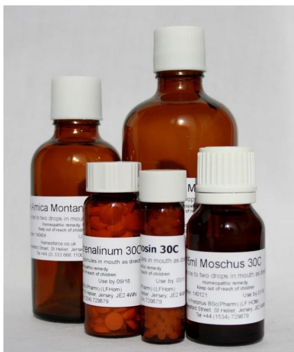
Slika 32. Homeopatski pripravci na bazi trubeljike

Otrovna trubeljika nema toliko široku primjenu u narodnoj medicini kao prethodno obrađene biljke. Korijen trubeljike je analgetik, emetik, sedativ, spazmolitik, itd. U prošlosti, od ove biljke spravljali su homeopatske lijekove (slika 32.). Upotrebljavali su se u liječenju epilepsije, meningitisa i drugih bolesti koje su povezane s mozgom. Od otrovne trubeljike spravljaju se još masti i tinkture. Trubeljika je učinkovita kod migrenskih glavobolja, bolnih menstruacija te upale kože. Zbog velike otrovnosti sve manje nalazi široku primjenu u pučkoj medicini (Gibson, 1972., Launert, 1981., Lesinger, 2006.b).