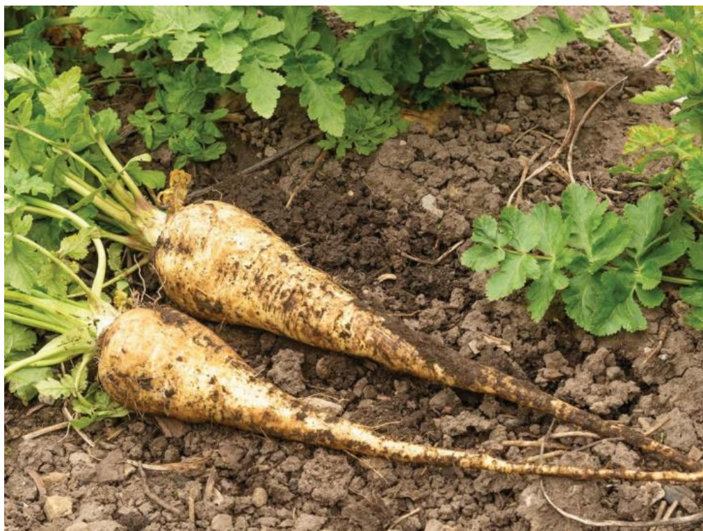
Slika 12. Svježe korijenje pastrnjaka

kardiovaskularnog sustava te može spriječiti oštećenja krvnih stanica i žila. Djeluje preventivno protiv dijabetesa. Pomaže pri mršavljenju jer je namirnica s vrlo malim brojem kalorija. Jača imunološki sustav te je pun vitamina i minerala. Osušeni korijen sadrži furanokumarine. Koristimo ga kao karminativ, diuretik i spazmolitik (Galle Toplak, 2005., Grlić, 1990., Hulina, 2011., Lim, 2015., Matejić, 2014., Tucakov, 1990.).