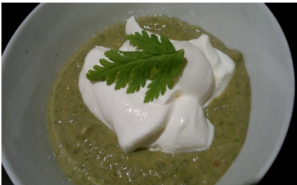
Slika 26. Varivo od listova čehulje s grčkim jogurtom

Čehulja se od davnina uzgajala kao ljekovita biljka u samostanima odakle se i proširila većim dijelom Europe. Koriste se svi dijelovi biljke. Uporaba čehulje u narodnoj medicini sve je manja. Čehulja je diuretik, digestiv, ekspektorans, antiseptik, antidepresiv itd. Koristila se i u liječenju malarije. Preporučuje se dijabetičarima jer smanjuje potrebu za uzimanjem šećera. Biljka se tradicionalno koristila za liječenje oslabljenog želuca, astme, poremećaja mokraćnog sustava. Dokazano je da čehulja stabilizira apetit i čisti krv (Dobravalskyté, 2013.a, Grlić, 1990., Rančić i sur., 2005.).