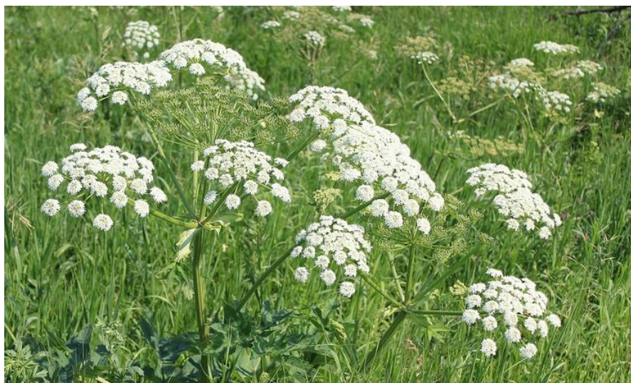
Slika 27. Biljka kukute (stabljika, listovi, cvjetovi)

Plod je široko jajolik, oko 3-3,5 mm dug i oko 2,5 mm širok, s 5 izraženih valovitih rebara sivozelenkaste boje. Merikarpi su najčešće sastavljeni, a mogu biti i odvojeni jedan od drugoga (Hulina, 2011., Tucakov, 1990.).