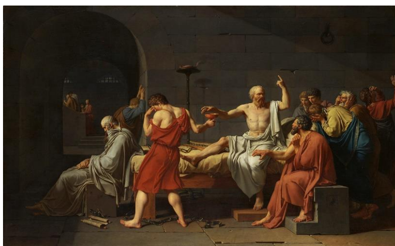
Slika 28. Smaknuće Sokrata (slikar: Jacques Louis David, 1787.)

Ime je izvedeno od grčke riječi konas , što znači nesvjestica ili vrtložiti se i latinske riječi maculatum što znači pjegav, a odnosi se na karakteristične mrlje na stabljikama. Kukuta raste na vlažnim i plodnim tlima, u blizini naselja, na zapuštenim zemljištima, na rubovima oranica, uz putove, u šumama, uz obale rijeka, uz potoke i kanale, na pašnjacima i livadama. Kao samonikla biljka raste u Europi, Aziji i Africi. Kukuta je otrovna biljka s kojom su se u prošlosti izvršavale smrtne kazne još u staroj Grčkoj. Platon opisuje smaknuće Sokrata 399. g.pr.Kr. pomoću otrova u kojem je bila i kukuta (slika 28.). Ona izaziva ataksiju, drhtavicu i konvulzije. Svijest je očuvana do smrti pa su stari Grci takvu smrt nazivali „Hladnim putem do Hada“ (Hulina, 2011., Lesinger, 2006.a, Vetter, 2004.).