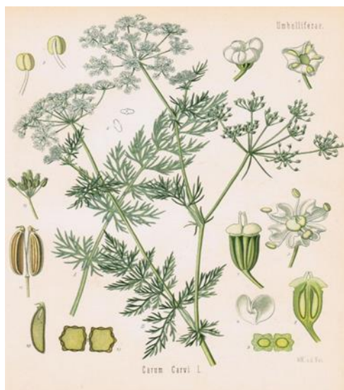
Slika 1. Prikaz morfoloških obilježja kima

Plod kima je do 5 mm dugi smeđi kalavac. Plod se raspada na dva uska, svijetlim rebrima isprugana polu ploda koji imaju polumjesečasti oblik. Plodovi dozrijevaju krajem kolovoza i početkom rujna i lako se osipaju. Plodovi kima aromatičnog su mirisa i okusa (Grlić 2005., Hulina, 2011.).