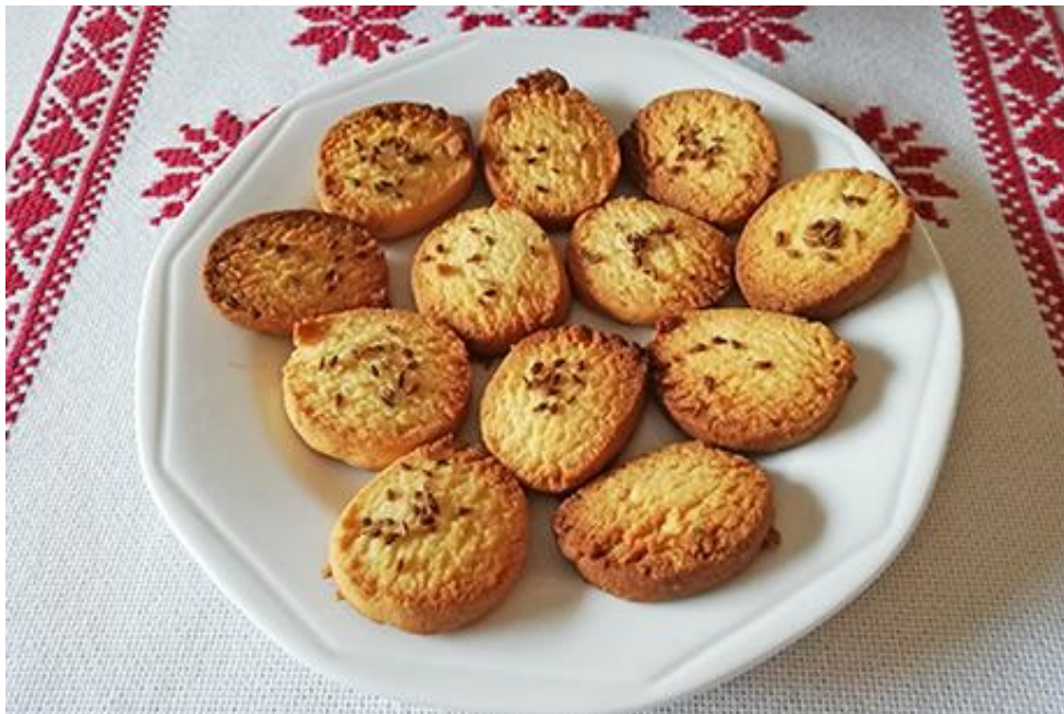
Slika 20. Pecivo s anisovim sjemenkama

Poznato je da su anis kao začin upotrebljavali u drevnom Egiptu i antičkom Rimu. U srednjem vijeku proširio se cijelim Sredozemljem, a danas je popularan začin u Europi, Egiptu i azijskim zemljama, prvenstveno zbog svoga aromatičnog i slatkastog okusa. U kulinarstvu, najčešće se upotrebljavaju sušene anisove sjemenke kao začin za kruh, peciva, slastice i kolače (slika 20.). U Njemačkoj se pravi raženi kruh s anisom, a u Aziji i u Sredozemlju anisove sjemenke upotrebljavaju se kao začin za meso i povrće. Zatim, anis se dodaje u kremaste sireve, ukiseljeno povrće, variva, salate i umake. Poboljšava okus pirjanoj riži i mesu, kao i ribljom juhi. Usitnjeno sjeme anisa dodaje se pekmezima i kompotima, voćnim salatama naročito s datuljama, smokvama i kestenom (Borovac, 2005., Kolac i sur., 2002.b, Tucakov, 1990.).