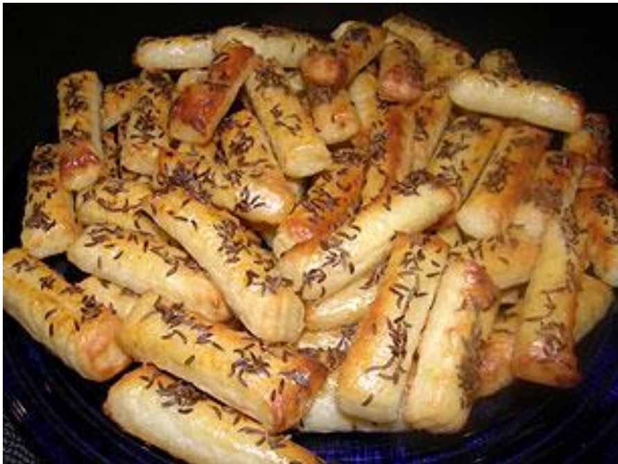
Slika 4. Pecivo s kimovim sjemenkama

Također, eterično ulje kima sprječava rast micelija i produkciju aflatoksina gljive Aspergillus parasiticus te može poslužiti kao prirodna zamjena za kemijske konzervanse, kao što su kalijev fluorid, octena kiselina i kalijev sulfit (Farag i sur., 1989.).