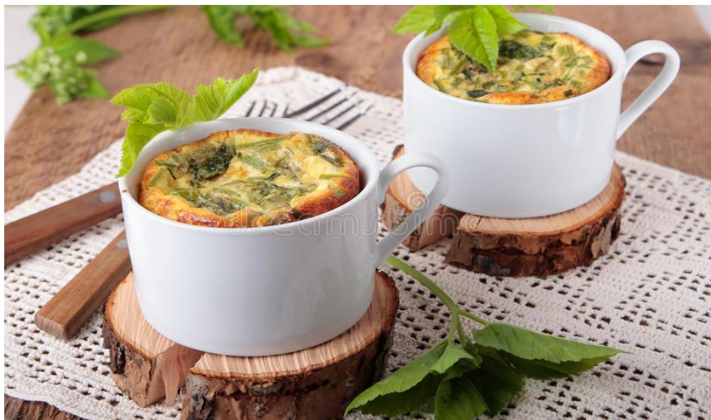
Slika 23. Omlet od sedmolista

karakterističnom obliku listova pa nema opasnosti da ju zamijenimo s nekom od otrovnih biljaka (Grlić, 1990., Hulina, 2011., Jakubczyk i sur., 2020.).