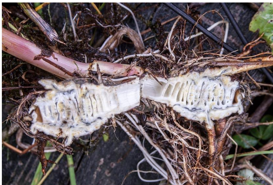
Slika 31. Presjek korijena trubeljike

Otrovnu trubeljiku nalazimo na području srednje i sjeverne Europe, a ima je u sjevernoj Aziji i Sjevernoj Americi. Ime vrste virosa znači otrovan. Trubeljika voli močvarne livade, jarke, poplavne površine, a raste i uz potoke i jezera. Trubeljika je poznata još od antičkog doba kao narkotičko sredstvo, a rabili su je za ublažavanje kašlja i grčeva. Grčki i arapski liječnici koristili su ju za liječenje artritisa (Hulina, 2011., Shin i Kim, 2013.).