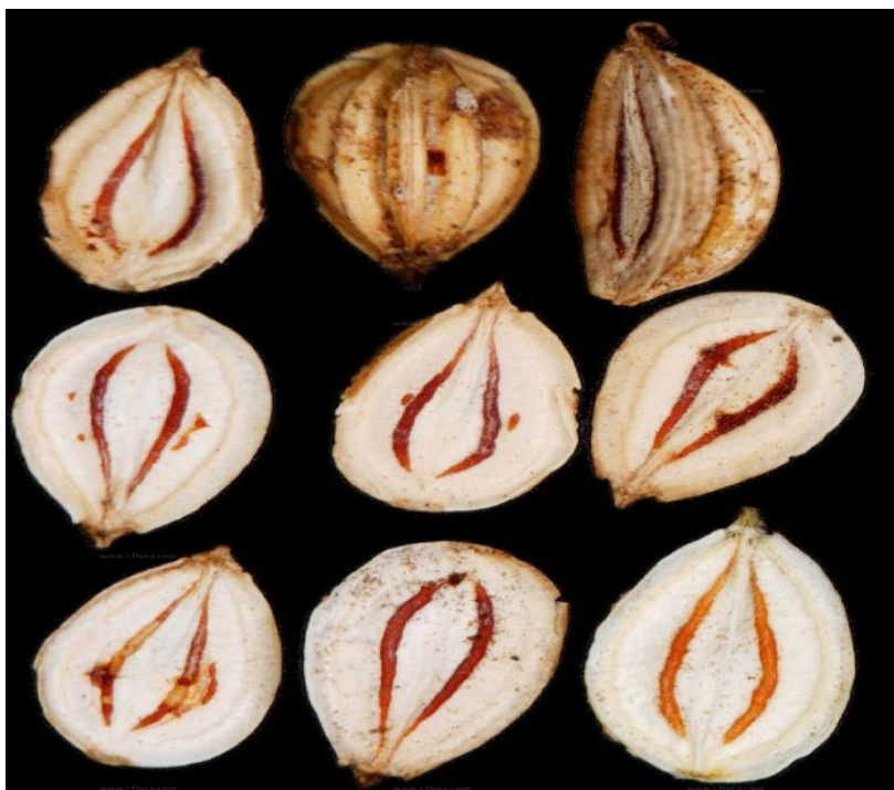
Slika 34. Plod divljeg peršina