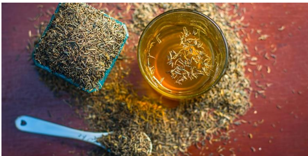
Slika 3. Čaj od kima

Kim se kao ljekovita biljka koristio prije više od pet tisuća godina što potvrđuju nalazišta ostataka hrane u neolitskim sojenicama. Poznavali su ga i upotrebljavali arapski liječnici, odakle je vjerojatno u 13. stoljeću donesen u Europu. Ljudi su kroz povijest upotrebljavali kim kao biljku koja djeluje na probavu jer potiče izlučivanje probavnih sokova i čišćenje crijeva. Koristi se za liječenje grčeva u želucu i nadimanja (Reader's digest, 2006.).