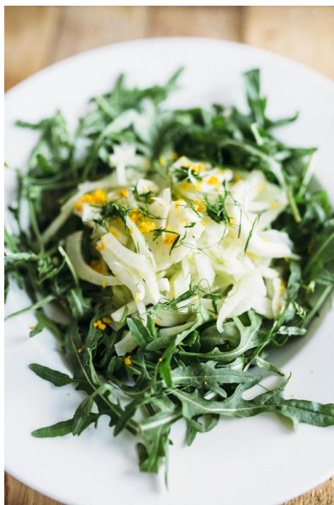
Slika 7. Salata od korijena komorača