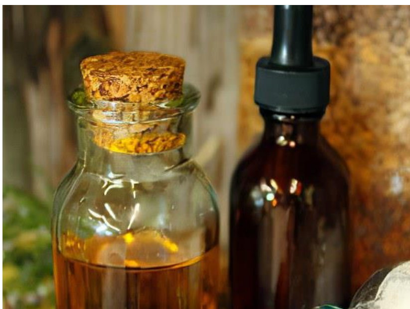
Slika 29. Tinktura od kukute

Iako je jako otrovna biljka, kukuta se upotrebljava i u narodnoj medicini. Biljka se koristi u svježem stanju za pripremu tinktura (slika 29.) i masti, i u obliku raznih obloga. Kukuta se koristi u liječenju kožnih bolesti kao što su psorijaza, herpes i sl. na koje se stavljaju oblozi i flasteri od svježe biljke ili mast. Zatim, primjenjuje se i za liječenje živčanih bolesti kao što su poremećaji ponašanja, grčevi, nekontrolirani živčani pokreti, Parkinsonova bolest itd. Upotrebljava se i kod bolesti respiratornih organa kao što su astma, kronični bronhitis i kod nadražujućeg kašlja. Poznata je i ljekovitost kod želučano-crijevnih bolesti, pomaže kod poremećaja u probavljanju hrane i crijevnih parazita, povećane želučane kiseline, grčeva u dvanaesniku itd. Za vanjsku uporabu koriste se masti i ulja za liječenje mastitisa, analnih fisura, hemeroida, raka dojke, depresije, anksioznosti.. U homeopatiji rabi se za liječenje bolesti žlijezda, tegoba prostate, bolesti očiju i mnogih drugih problema (Lesinger, 2006.a, Vetter, 2004.).