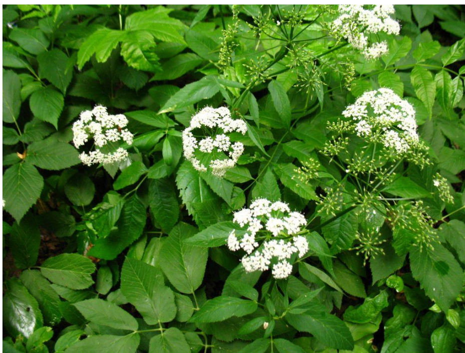
Slika 21. Biljka sedmolist (stabljika, list, cvijet)

Plod je šizokarp i dijeli se na 2 ovalna merikarpa. Jajolik je, 3 mm dugačak i 2 mm širok. Sjeme je smeđe boje i ima dva rebra (Hulina, 2011., Jakubczyk i sur., 2020.).