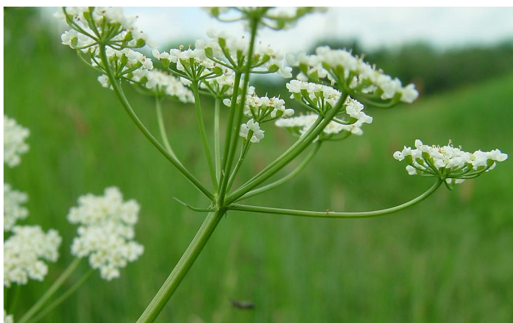
Slika 2. Cvijet kima

Kim potječe iz središnje Azije, a uvezen je prije otprilike tisuću godina iz sjeverne Afrike u Europu (Rubatzky i sur., 1999.). Kao samonikla biljka kim je rasprostranjen u cijeloj Europi i Aziji (Sibir, Kavkaz, Mongolija), a raste u sjevernoj Africi i u Sjevernoj Americi. Kim je rasprostranjen u cijeloj Hrvatskoj, od nizina do planinskoga pojasa. Stanište su mu livade i pašnjaci, uz putove, grmlje i živice. Nažalost, sve ga je teže pronaći na livadama i pašnjacima, posebice zbog česte košnje prije nego što plodovi dozriju, pa se stoga ne može sam zasijati (Galle Toplak, 2005.).