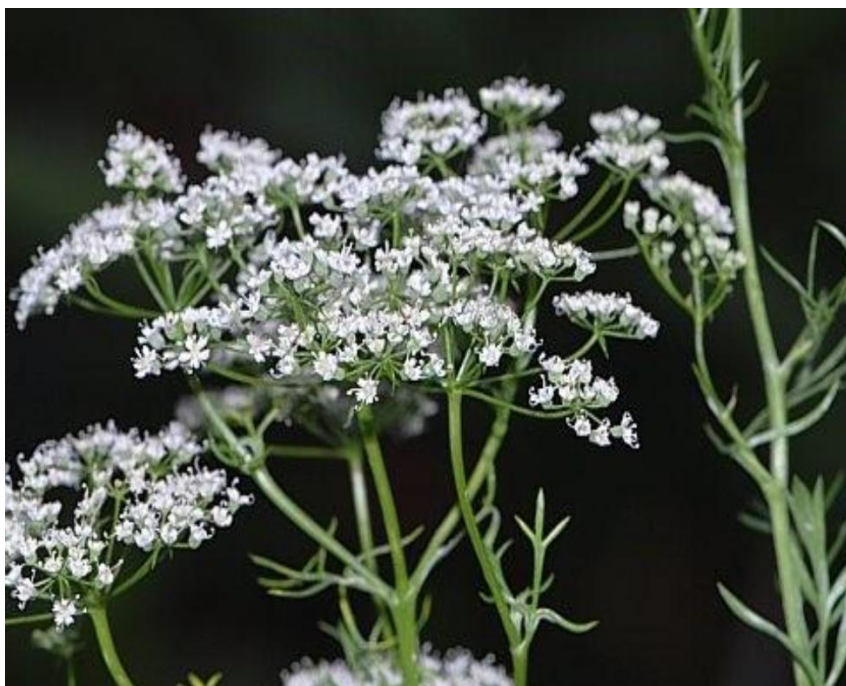
Slika 18. Biljka anisa (stabljika, list, cvijet)

Plodovi su naborane sjemenke jajasta oblika, dugi 2-6 mm, debljine 3 mm, a masa 1000 sjemenki je 2-4 grama. Sivo zelene su boje, plosnati, s 10 svijetlih rebara i obrasli mekanim dlačicama. Plodovi sazrijevaju od kolovoza do rujna. Plodovi se skupljaju po suhom vremenu, a čuvaju se na toplom i prozračnom mjestu (Hulina, 2011., Kolak i sur., 2002.b).