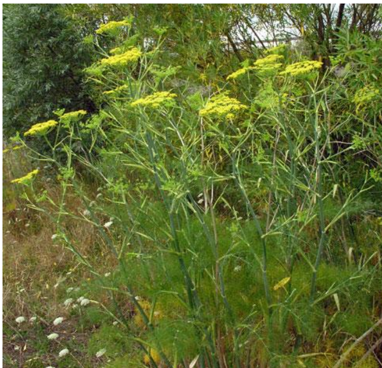
Slika 5. Biljka komorača

Plodovi su duguljasti 6-10 mm, široki 2-3 mm, rebrasti i spljošteni. Plod se sastoji od dvije sjemenke. Masa tisuću sjemenki iznosi 4 do 8 grama. Sjemenke se sakupljaju u rujnu i listopadu, kada poprime žutu boju (Hulina, 2011., Reader's digest, 2006., Šilješ i sur., 1992.).