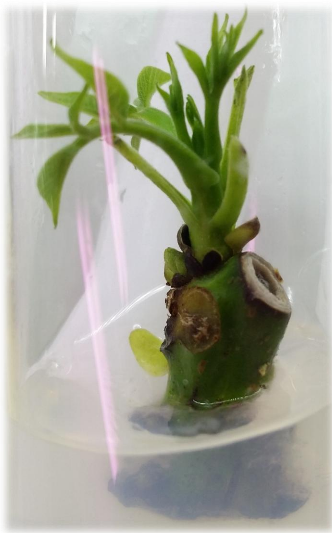
Slika 4. Aseptični nodijalni eksplantat oraha dobiven u in vitro laboratoriju za voćarstvo, FAZOS

Jedan od najvažnijih čimbenika in vitro kulture je uspostavljanje i održavanje aseptičnih uvjeta (Slika 4.). Priprema i sterilizacija eksplantata dosta je problematična i teška. Tkivo (eksplantat) se tretira dezinficijensima u cilju sprječavanja mikrobiološke kontaminacije bez oštećenja tkiva. Na orahu je uobičajen i usvojen postupak površinske sterilizacije eksplantata s 50 - 70% (v/v) etanola (EtOH) kroz 20 - 30 sekundi, a potom slijedi uranjanje eksplantata u 0.1 – 15% (v/v) natrijevog hipoklorita (NaOCl) s dodatkom 0.01% Tween 20 (okvašivač) u trajanju od 10 - 20 min. Potom slijede tri ispiranja (5 min.) u sterilnoj destiliranoj vodi. Tablica 2. prikazuje usvojene protokole sterilizacije za nekoliko vrsta eksplantata oraha.