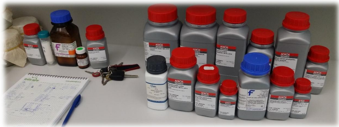
Slika 5. Komponente DKW medija, FAZOS