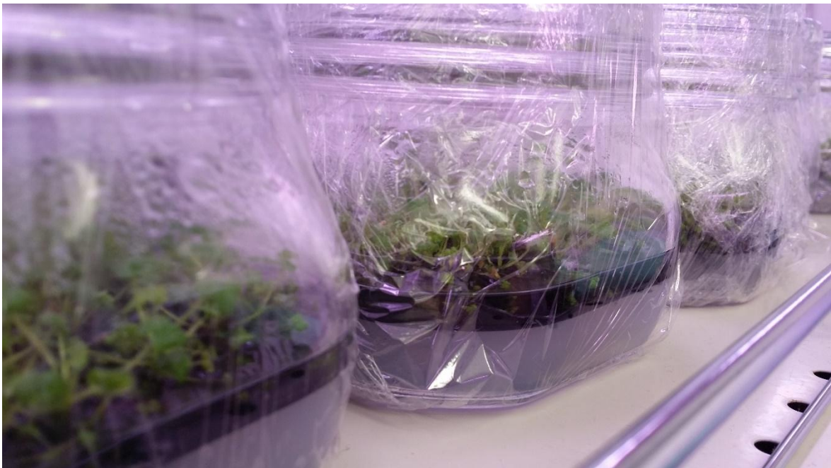
Slika 3. Dvofazni medij - gornja faza tekuća s aktivnim ugljenom i donja faza hranjiva podloga sa svim elementima, FAZOS

U istraživanju Payghamzadeh i Kazemitabar, (2008b.) eksplantati su kultivirani na dvije vrste hranjivog medija. Prvi medij je sadržavao različite koncentracije 6-benzil aminopurina (BAP), te dvofazni medij (Slika 3.) s nižom fazom koja je sadržavala aktivni ugljen bez biljnih regulatora, i gornja faza tekući DKW medij dopunjen različitim koncentracijama BAP-a bez aktivnog ugljena. Rezultati ukazuju da je koncentracija od 8.9 \mu\text{M} BAP-a bila najučinkovitija u indukciji aksilarnih pupoljaka. Također dvofazni medij bio je bolji u odnosu na ostale medije tijekom istraživanja.