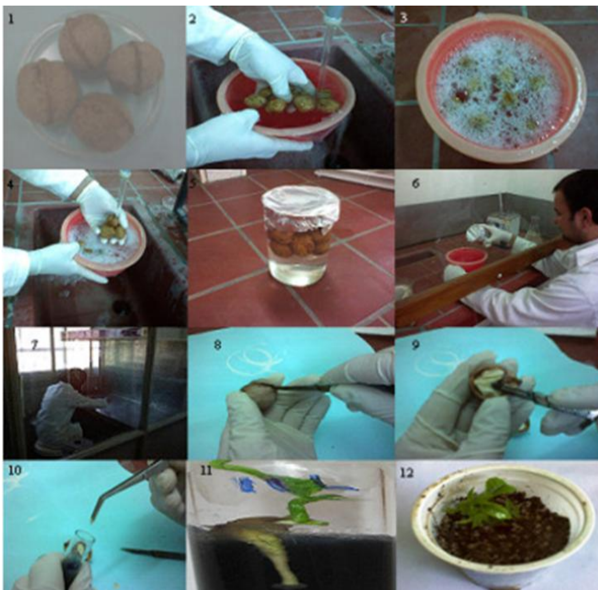
Slika 6. Shematski prikaz kulture embrija

Opis postupka in vitro tehnike kulture embrija (Slika 6.): 1. Prikupljeni plodovi; 2. pranje pod tekućom vodom 10 min; 3. tretiranje plodova s otopinom za izbjeljivanje (NaOCl) kroz 10 min; 4. pranje pod tekućom vodom kroz 10 min; 5. tretiranje s 50 – 70 % (v/v) etanolom kroz 20 - 30 s nakon čega slijedi sterilizacija s 0.1 – 15 % (v/v) natrijevim hipokloritom uz dodatak 0.01 % Tween 20 kroz 10 - 20 min; 6. ispiranje u tri sterilne destilirane vode u aseptičnim uvjetima; 7. laminarna komora (aseptični uvjeti); 8. plodovi se otvaraju pomoću sterilnih skalpela i pinceta; 9. disekcija embrija s kotiledonima; 10. embriji kultiviran na hranjivi medij; 11. in vitro germinacija embrija; 12. aklimatizacija in vitro biljaka nastalih iz embrija.