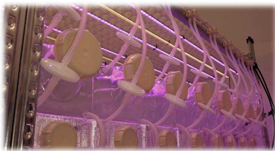
Slika 8. Tekuća kultura / bioreaktori - TIB sustav, FAZOS

Uporabom phytagela znatno je bolja produkcija kalusa, dužina izdanaka i broj listova na izbojcima nego kod Difco Bacto agar (Saadat i Hennerty, 2002.) što potvrđuje rezultate Barbas i sur., (1993b.), Cornu i Jay-Allemand (1989.), Nairn i sur., (1995.), Pasqualetto i sur., (1988.). Barbas i sur., (1993.) iznose velike razlike u mineralnom sadržaju ovih učvršćivača. Gelrite je sadržavao veću količinu Ca, Mg, K i Fe u odnosu na Difco Bacto agar, dok ih je agar sadržavao trostruko više nego gelrit. Tekući hranjivi medij bez ikakvog učvršćivača može dati bolji kontakt između eksplantata i medija što povećava dostupnost citokinina i drugih hranjivih tvari uz razrjeđivanje svih štetnih eksudata iz eksplantata (Payghamzadeh i Kazemitabar, 2008b.). Uspostavljanje tekuće kulture (Slika 8.) daje i nekoliko drugih prednosti te je važan korak u automatizaciji samog procesa mikropropagacije. Eliminacija agara u tekućem mediju posljedično smanjuje troškove nabavke istog.