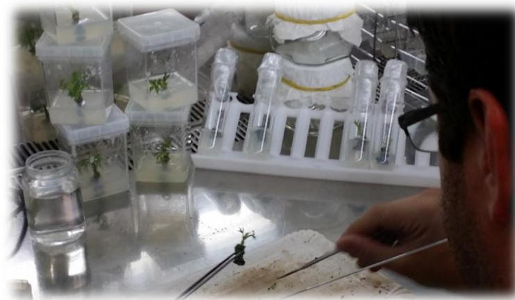
Slika 1. Rad na orahu u laboratoriju za kulturu tkiva, FAZOS