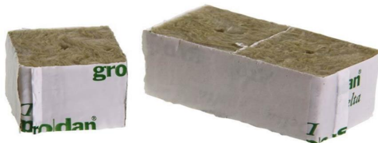
Slika 9. Supstrat kamene vune