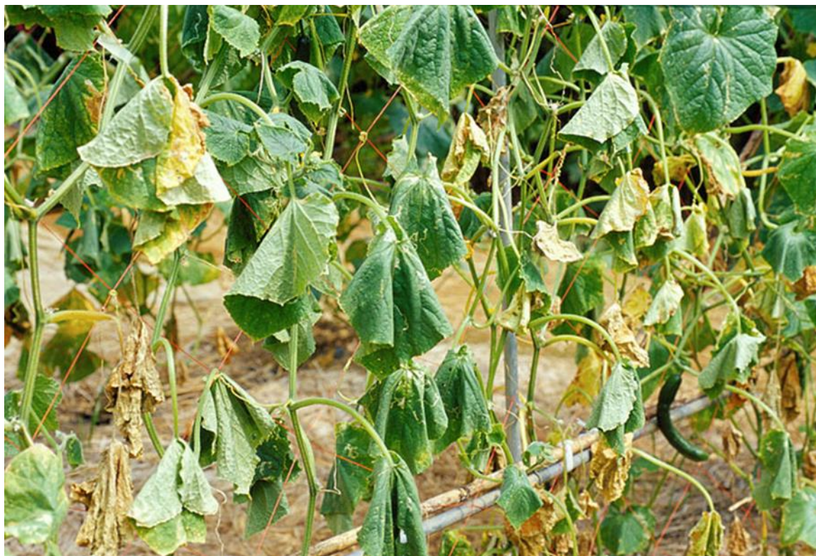
Slika 4. Fusarium oxysporum na krastvacu

Fusarium oxysporum (fuzarijsko venuće) je bolest ponovljenog ili prečestog uzgoja krastavaca na istoj površini za vrijeme toplog vremena (Slika 4.). Uzročnik prezimljuje na zaraženim biljnim ostacima te se prenosi na zdrave biljke. Uzrokuje začepljenje provodnih snopića stabljike uslijed čega se suši čitava biljka, a jedina uspješna mjera borbe protiv fuzarijskog venuća je pridržavanje plodoreda i upotreba zdravog, tretiranog sjemena.