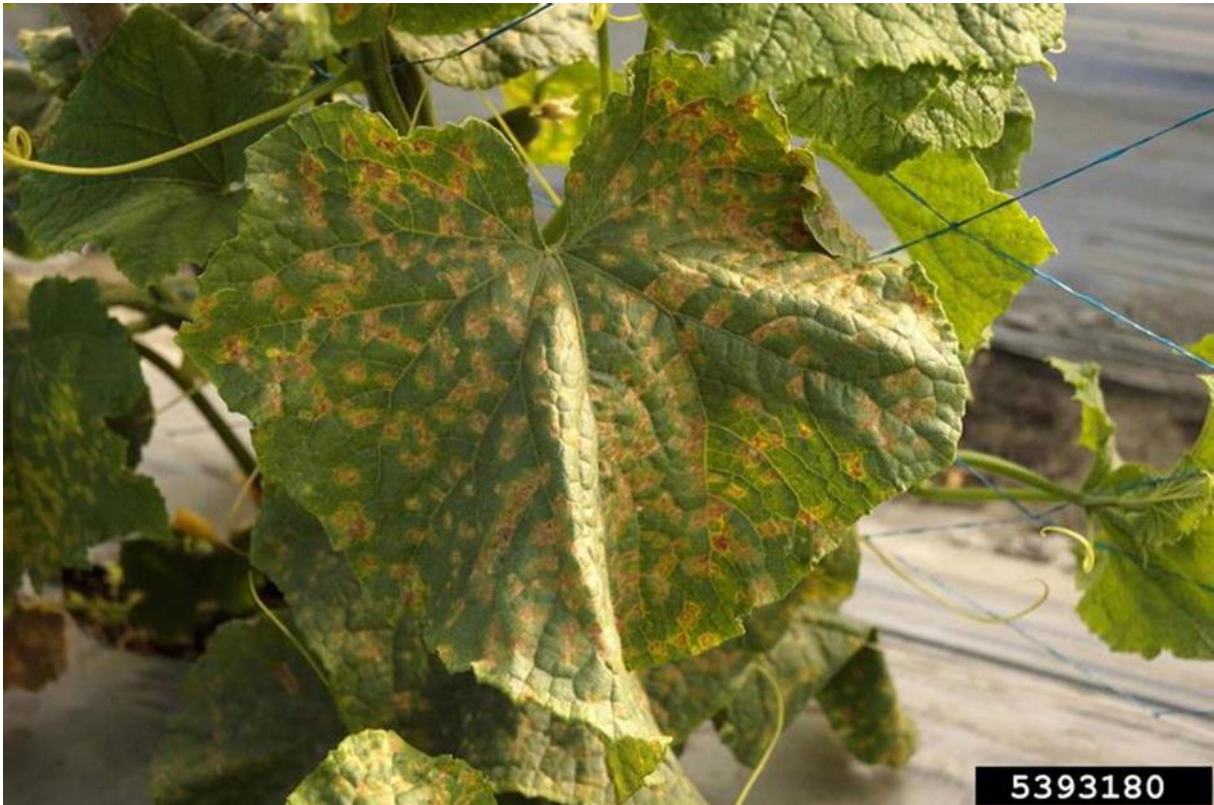
Slika 5. Pseudoperonospora cubensis