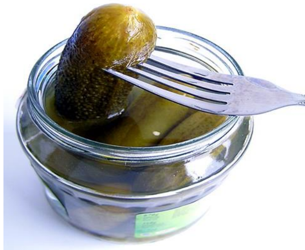
Slika 1. Krastavac kornišon

Pošto je krastavac termofilna biljka, temperature za nicanje krastavca trebaju biti između 22-24 °C, za rast i razvoj 18-20 °C dnevne, a noćne ne ispod 13 °C. Zalijevanje se obavlja prema potrebi i uvijek pravovremeno, pri čemu valja paziti da se ne kvase biljke zbog razvoja bolesti. Relativnu vlažnost zraka treba održavati na razini 85 – 90 % (Parađiković, 2009.).