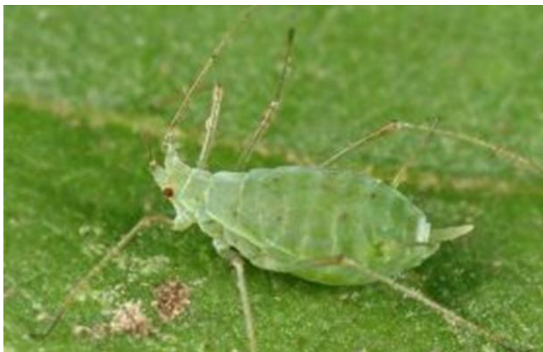
Slika 6. Lisne uši