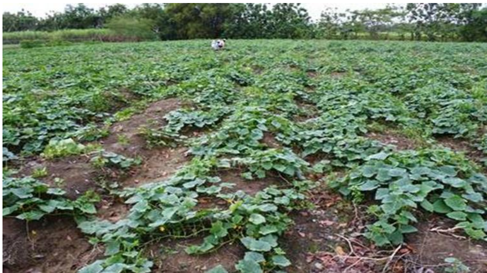
Slika 2. Polje krastavaca