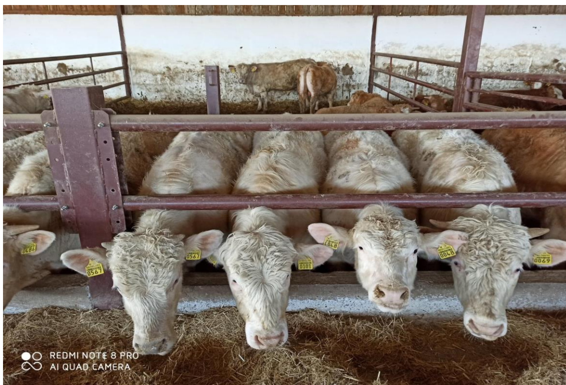
Slika 8. Charolaise pasmina

Najznačajnije mesne pasmine pogodne za intenzivnu proizvodnju mesa su Charolaise i Blonde d'Aquitane (Ivanković i Mijić, 2020.). Istraživano gospodarstvo tovi pasmine: Charolaise (slika 8.), Limousine (slika 9.), Blonde d'Aquitane (slika 10.), Hereford (slika 11.) i Simmental.