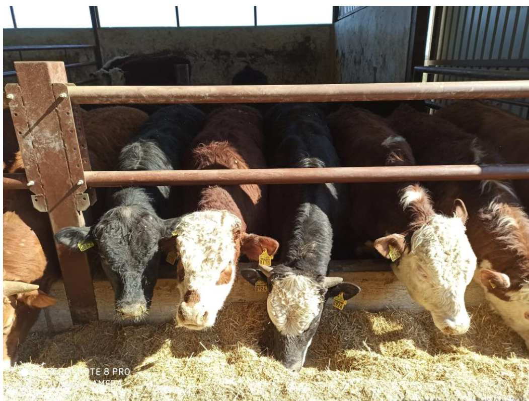
Slika 11. Hereford pasmina