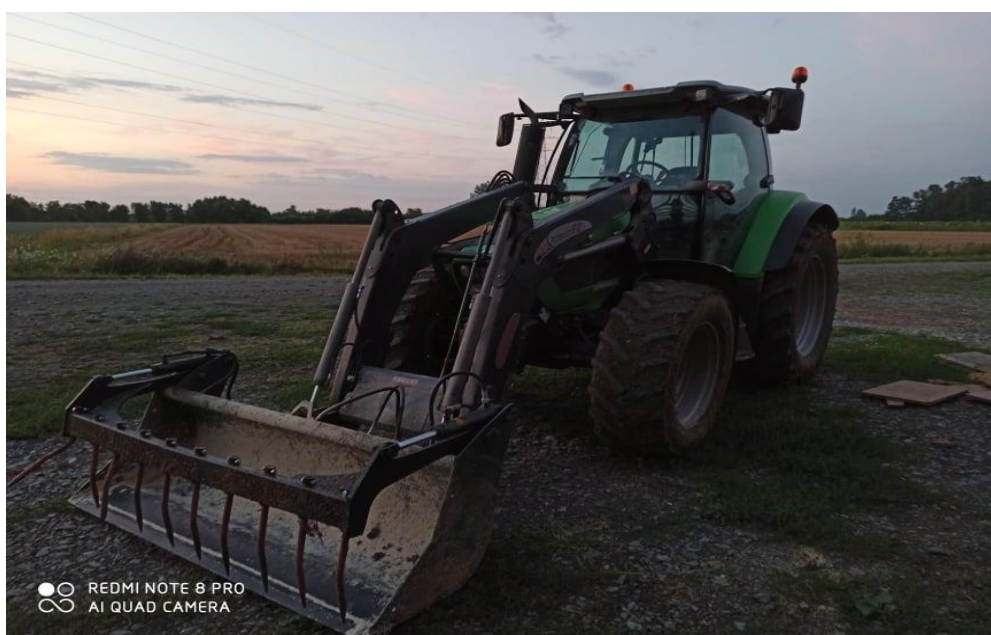
Slika 3. Deutz Fahr Agrottron, K420