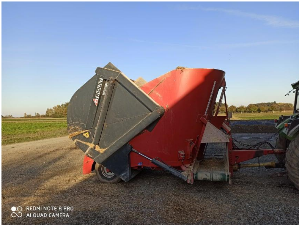
Slika 5. Mikser prikolica Trioliet Triomix 1200