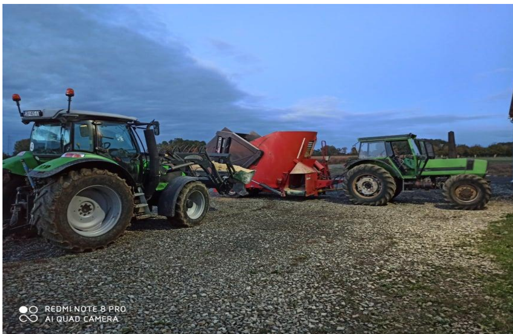
Slika 2. Pripremanje obroka za junad (tzv. mikser prikolica)