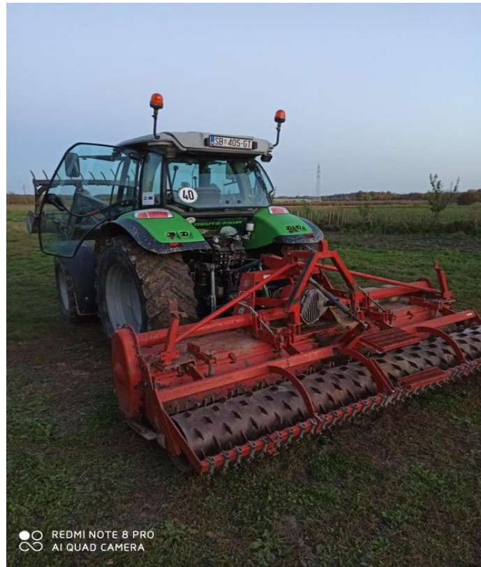
Slika 4. Rototiller RAU (fotografirala: Mia Zmaić)