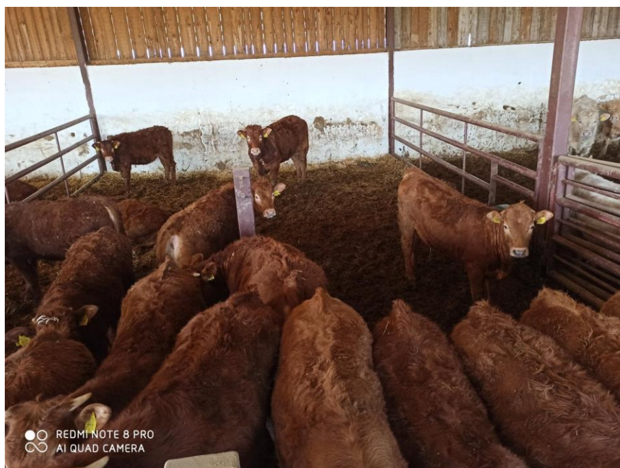
Slika 9. Limousine pasmina