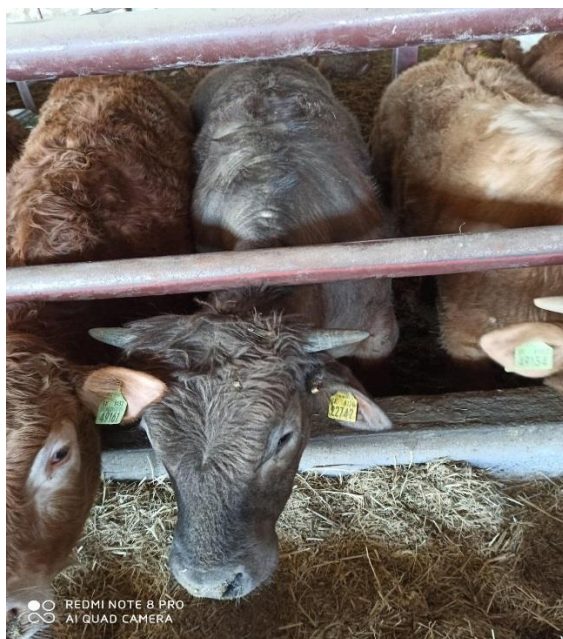
Slika 10. Blonde d'Aquitane pasmina