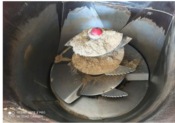
Slika 13. Dodavanje krede u miksericu