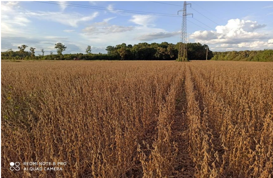
Slika 6. Usjev soje