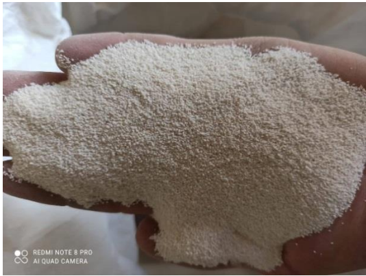
Slika 12. Kreda, kalcijev karbonat