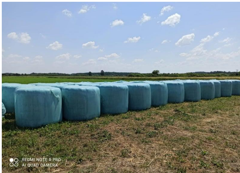
Slika 14. Travnja silaža (sjenaža)