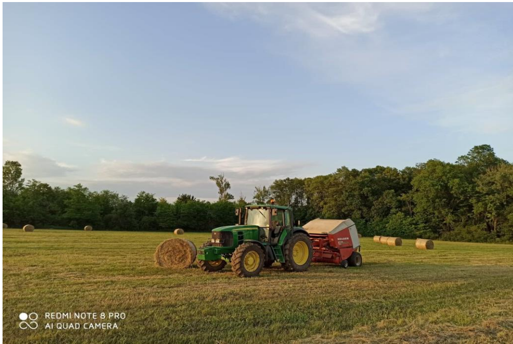
Slika 7. Baliranje lucerne rolobalirkom