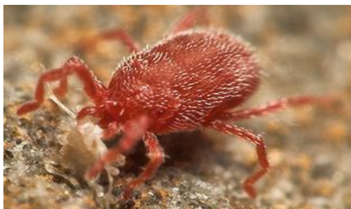
Slika 7. Crveni voćni pauk

Nije tako često prisutan na vinovoj lozi kao na jabuci ili drugim voćnim vrstama. No, ipak može se pojaviti jaka populacija ovog štetnika u vinogradu (Ciglar, 1998.). Ima kruškoliko tijelo duljine 0,3-0,5 mm, jarko crvene boje i 4 para nogu ( http://www.vinogradarstvo.com ), (Slika 7.). Po broju jaja na kori drveta može se procijeniti populacija. Od velikog broja jaja, ne mora se pojaviti i jaka populacija pokretnih stadija. Ako ne nađu zelene dijelove loze na kojima se hrane, mlade ličinke ugibaju. Ako su u vinogradu svi drugi uvjeti za razvoj štetnika povoljni, i od malog broja ličinki koje su izašle kada su već izbili zeleni izbojci, može se razviti jaka populacija u ljeto (Ciglar, 1998.). Prva generacija crvenog pauka nalazi u vinogradu na korovnim biljkama, a druga se seli na vinovu lozu. Najčešće štete se uočavaju krajem ljeta. Mjesta na listovima na kojima su grinje sisale posvijetle. Kasnije čitav list požuti i otpadne prije vremena. Na naličju lista može se vidjeti paučinasta prevlaka. U njoj su vidljive grinje ( https://www.agroportal.hr ).