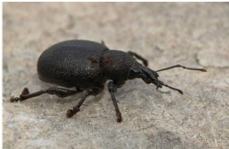
Slika 6. Crna vinova pipa

Ova pipa je proširena u istočnoj Slavoniji i Srijemu. Tijelo joj je crno - smeđe boje, dužine 9-10 mm (Slika 6.). Štetni stadij je odrasli oblik. Ličinka živi u tlu i korijenu loze, ali i drugih biljaka, no tamo ne pravi štete. U rano proljeće izgriza pupove što može nanijeti značajnu štetu, naročito ako se pojavi u većoj brojnosti. Manje je otporna na insekticide od prugaste i crne vinove pipe ( http://www.vinogradarstvo.com ).