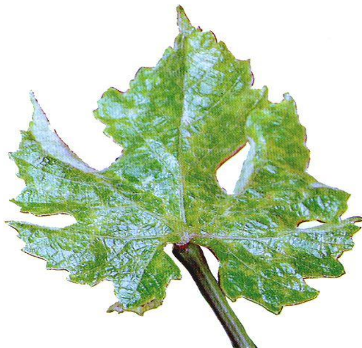
Slika 10. Simptomi akarinoze na licu lista

dobro djeluje na grinje. Također, preporučuje se korištenje akaricida ako je jak napad za vrijeme vegetacije, tj. u fazi zelenih izbojaka (Ciglar, 1998.).