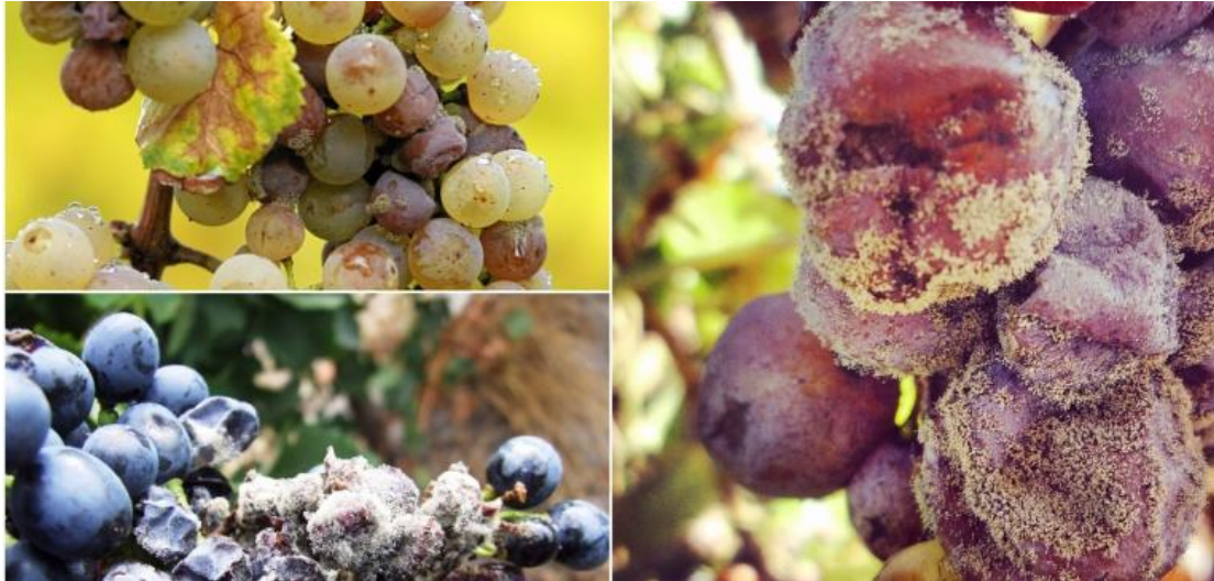
Slika 4. Simptomi sive plijesni na bobama