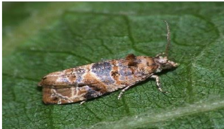
Slika 8. Pepeljasti grozdov moljac

ranije tretiranje tj. prije nego što se gusjenica uspije uvući u grozd i napraviti zapredek, jer gusjenica moljca mora doći u kontakt s biopreparatima. Za žutog moljca i za sivog moljca postoji i poseban feromon za praćenje, a obje vrste se mogu pratiti smjesom octa i šećera (Ciglar, 1998.). Potrebno je postaviti jednu lovku na 2 ha s obzirom na veličinu vinograda. No, ako je površina vinograda veća, potrebno je postaviti i više lovki: na 2 - 5 ha dvije lovke, 5 - 10 ha tri lovke, 10 - 50 ha četiri lovke, 50 - 100 ha deset lovki, više od 100 ha dvadeset lovki. Postavljaju se na visinu od oko 1,8 m od tla prije početka cvatnje vinove loze (Barić i sur., 2021.).