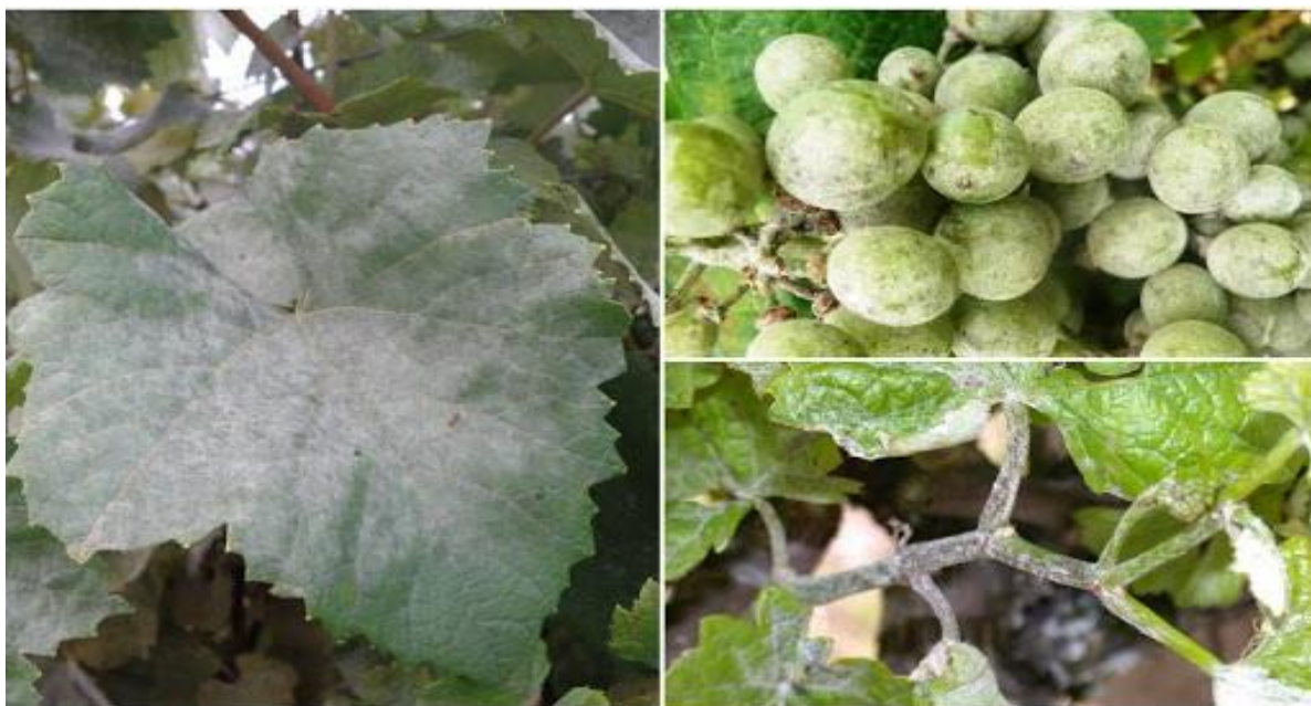
Slika 2. Simptomi Pepelnice vinove loze

nenapadnuti dio lista normalno raste. Bjelkasta prevlaka može se pojaviti na peteljka listova (Slika 2.). Ispod prevlake nalazi se nekrotizirano tkivo. Prisutnost parazita na listovima predviđa jači napad i na grozdove. Mladice mogu biti napadnute od trenutka izlaženja iz pupa pa sve dok ne odrvene. Zrnaste mrlje lakše se uočavaju na zelenim mladima, a micelij brzo prelazi iz pepeljastog do tamnije smeđe boje. Cvat može biti napadnut prije oplodnje. Na cvjetovima gljiva razvija sivi micelij te uzrokuje sušenje i opadanje cvjetova (Ciglar, 1998.). Ipak, najveće štete nastaju na bobama. Moge biti napadnute od zametanja do promjene boje boba. Bobe kod jakih zaraza izgledaju kao posute pepelom. Ako su bobe zaražene neposredno nakon oplodnje zaostaju u rastu, a pokožica im je tvrđa i deblja. Bobe pucaju ako su zaražene u fazi aktivnog rasta. To je najkarakterističniji simptom uz pepeljastu prevlaku ( http://pinova.hr ).