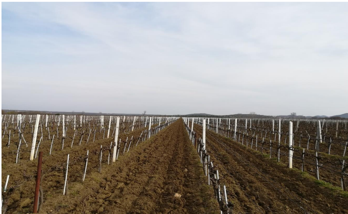
Slika 11. Vinograd OPG-a Veselko Glavić

Provedeno istraživanje za diplomski rad obavljeno je u Ravnim kotarima, mjesto Nadin, na lokalitetu Nadinsko blato u nasadu ekološkog vinograda obiteljskog gospodarstva Veselko Glavić (Slika 11.).