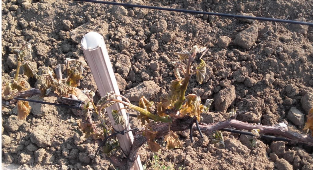
Slika 13. Mraz na listu vinove loze