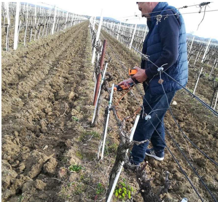
Slika 12. Rezidba vinograda

U vinogradu u fazi mirovanja vegetacije obavlja se rezidba kao prva agrotehnička mjera. Rezidbom tj. rezom oblikujemo i održavamo uzgojni oblik te reguliramo rodni potencijal. Također posredno utječemo i na veličinu te kakvoću uroda. U vinogradu obrta Veselko Glavić rezidba se obavljala početkom ožujka, ručno s električnim vinogradarskim škarama (Slika 12.). Orezano drvo skuplja se na hrpe, potom iznose iz vinograda te spaljuju.