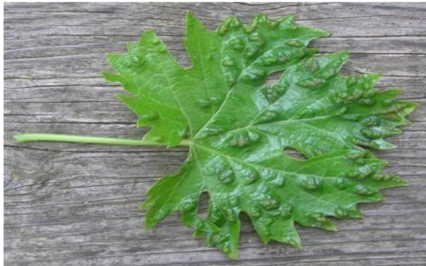
Slika 9. Simptomi erinoze na licu lista

početka vegetacije suzbijanje močivim sumporom u koncentraciji 1% ili endosulfatom u koncentraciji od 0,2 %. (Ciglar, 1998.). Proljetna pojava grinja na lozi te njihovo kretanje može se pratiti postavljanjem na rozgvu uske ljepljive pojaseve. Dobrim odabirom pokazala se uporaba kvalitetnih izoliranih vrpca omotanih ljepljivom površinom okrenutom prema gore. Potrebno je izbjegavati zaraženi sadni materijal. Grinje šiškarice imaju veliki broj prirodnih neprijatelja, a najčešće su to grabežljive grinje ( http://www.vinogradarstvo.com ).