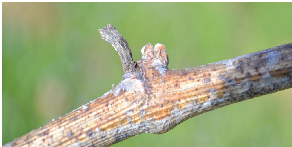
Slika 3. Crna pjegavost rozgve