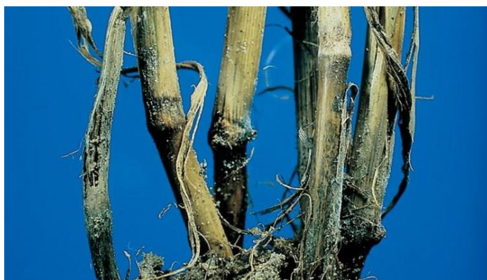
Slika 12. Trulež korijena i vlati

Bolest se može javiti kao samostalan proces ili nakon paleži klijanaca. U slučajevima u kojima se bolest javlja za ovaj tip bolesti karakteristični su tamna boja vlati i tamni rukavci listova (Slika 12). Do propadanja zaraženih biljaka može doći do busanja. Ovisno o jačini zaraze, dolazi do formiranja klasova koji imaju manji broj slabije nalivenih zrna. Na temelju istraživanja utvrđeno je da je dominantan uzročnik ove bolesti u istočnoj Hrvatskoj Fusarium graminearum , a ostale vrste prisutne su u manjem intenzitetu.