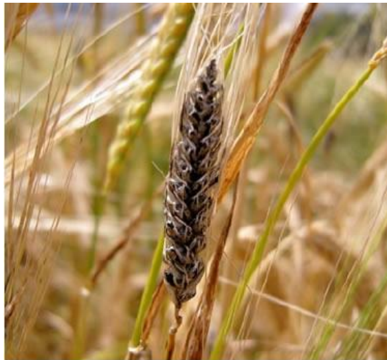
Slika 10. Smrdljiva snijet ( Tilletia spp. )

( https://www.savjetodavna.hr/wp-content/uploads/publikacije/letak_sm_novo.pdf )