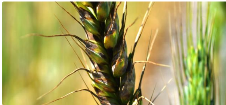
Slika 5. Smeđa pjegavost pljeva pšenice (uzročnik Septoria nodorum )

Iako patogeni iz istoga roda Septoria tritici i Septoria nodorum na biljci izazivaju pojavu pjega na listu, razlika je u tome što je Septoria nodorum uzročnik pojave pjegavosti i na klasu. Simptomi su kod obiju bolesti isti, jedino su kod S. nodorum pjege na listu tamnosmeđe do čokoladne boje koje širenjem postaju ovalnog ili eliptičnog oblika s tamnijim rubovima i crnim plodištima (Mehra i sur., 2018.). Na klasovima se pojavljuju smeđe pjege na gornjem dijelu vanjske pljeve (Slika 5).