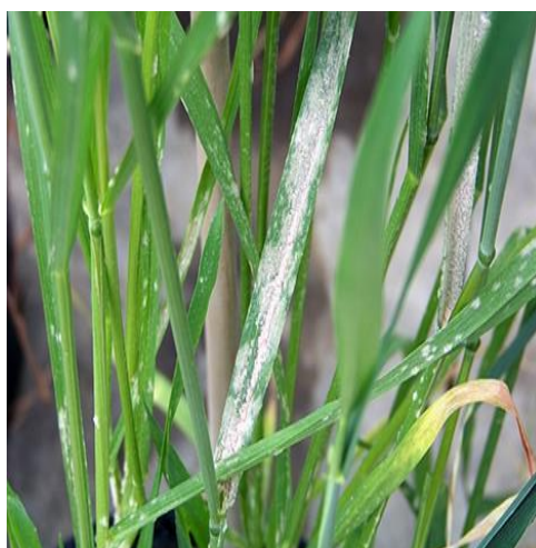
Slika 2. Pepelnica strnih žita (uzročnik Blumeria graminis f. sp. tritici )