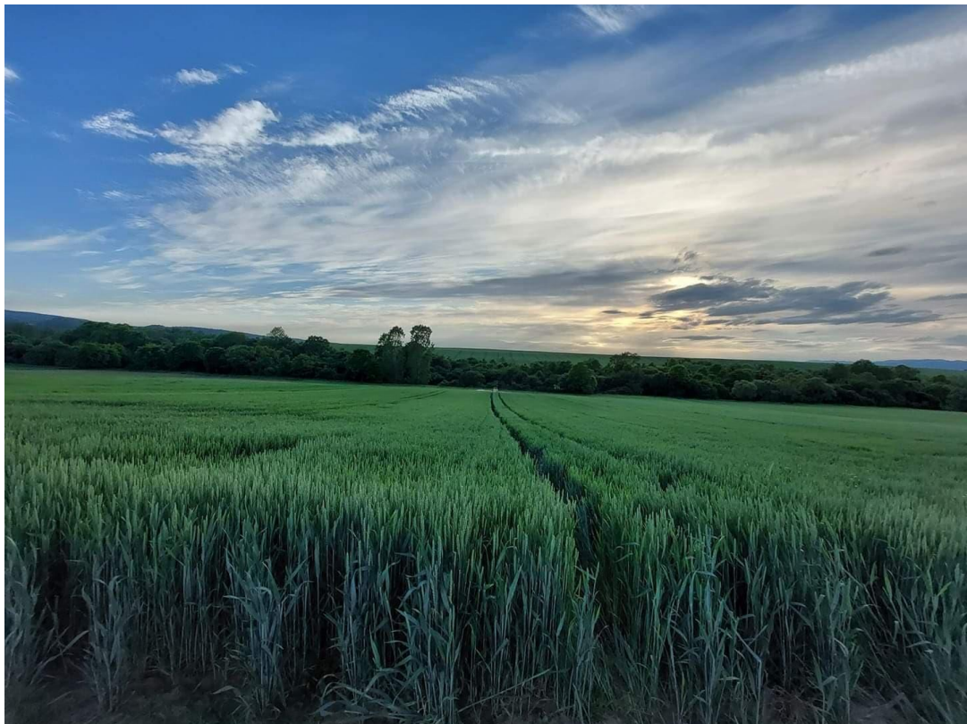
Slika 17. Pšenica u klasanju

Sorta Kraljica (Slika 17) najraširenija je ozima sorta pšenice u Hrvatskoj iz grupe srednje ranih sorti. Visokorodna je sorta koja u velikoj mjeri objedinjuje rodnost i kakvoću – genetski potencijal rodnosti veći je od 11 t/ha, A2 farinografske kvalitetne grupe, prema kakvoći nalazi se u I. razredu, sadržaj vlažnog ljepkva iznosi 28%. Morfološki gledano prosječna visina stabljike iznosi 75 cm, hektolitarska masa je oko 81 kg/hl, a masa 1000 zrna u prosjeku iznosi 40 grama. Otporna je na niske temperature i najrasprostranjenije bolesti pšenice te tolerantna na polijeganje. Optimalni rok sjetve je od 10. do 25. listopada s 500 do 650 kljavih zrna/m 2 .