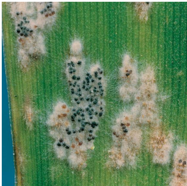
Slika 1. Pepelnica na listu pšenice (uzročnik Blumeria graminis f. sp. tritici ) ( https://www.agroklub.com/ratarstvo/suzbijanje-bolesti-zitarica/9258/ )