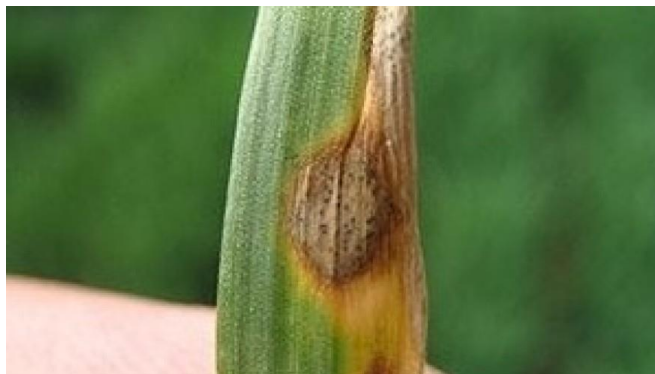
Slika 4. Piknidi Septoria tritici ( https://www.agroklub.com/ratarstvo/jaka-pojava-smede-pjegavosti-lista-na-psenici/9521/ )