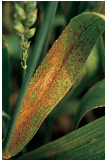
Slika 8: Smeđa (lisna) hrđa ( Puccinia recondita )

razvoj (slabiji korijen, busanje, zrno slabe kvalitete), a od simptoma javljaju se nepravilno razmješteni smeđi uredosorusi (oblik leće) na licu i naličju lista (Slika 8). Na kraju vegetacije listovi počinju odumirati, a uredosorusi postaju crni teliosorusi. Ukoliko je bolest zahvatila veći dio lišća, uzrokuje njegovo sušenje, posebno ako su u pitanju osjetljive sorte. Puccinia recondita može preživjeti zimu već na temperaturama 2 do 3°C što bi značilo da uredospore ostaju aktivne, raznose se vjetrom i postaju opasne za pšenicu (za klijanje im je potrebno malo vode).