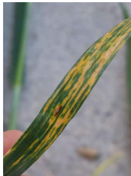
Slika 21. Pyrenophora tritici-repentis

Zaštita fungicidima (tablica 5) je obavljena 27. svibnja.