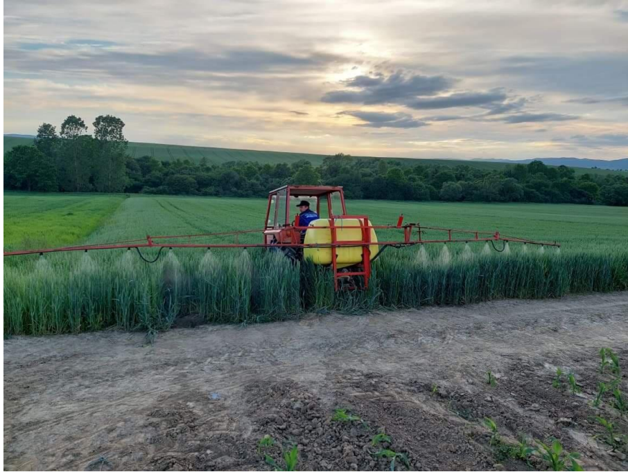
Slika 22. Prskanje pšenice na OPG-u Retkin

S obzirom da su u travnju i svibnju temperature bile vrlo niske, tako i nije bilo pojave bolesti u jačem intenzitetu. Zatim se krajem svibnja povisila temperatura zraka i bilo je dovoljno vlage te je obavljena zaštita jednim tretmanom fungicidima Elatus Era i Duett ultra kako bi se spriječile bolesti na klasu. Iako će žetva kasniti i do 2 tjedna zbog niskih temperatura koje nisu pogodovale razvoju pšenice, očekuje se vrlo dobar prinos zrna.