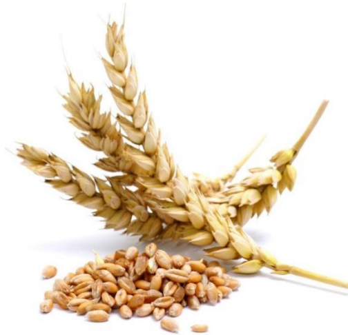
Slika 9. Zdravi klasovi pšenice

klasovi jednog busa su zaraženi. Zdravi klasovi su povinuti zbog težine zrna (Slika 9). Zaraženi klasovi ne cvatu, njihov je položaj uspravan zbog zrna koje je lakše nego li zrno na zdravom klasu. Morfološki gledano, klasovi strše i nakostriješeni su, a zrna su tamna, deblja i okrugla (Slika 10).