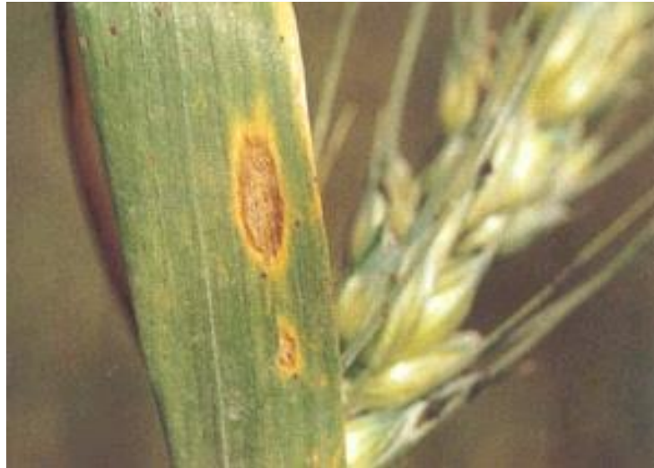
Slika 6. Žuto-smeđa pjegavost lista pšenice (uzročnik Pyrenophora tritici-repentis ) ( https://www.diark.org/diark/species_list/Pyrenophora_tritici_repentis )

Prvi simptomi bolesti mogu se javiti tijekom vlatanja, a ističe se pojava malih pjegica žute boje unutar kojih se nalazi crna točkica (Radan i sur., 2014.). Ovisno o stupnju zahvaćenosti, postoji mogućnost rasta pjega i do jednog centimetra koje se širenjem mogu spojiti na vrhu lista i uzrokovati sušenje. Pjege kasnije u vegetaciji (klasanje, cvjetanje, mliječna zrioba) mogu postati specifičnoga izgleda: smeđe su boje i počinju poprimiti svijetlozeleni ili čak žuti rub u obliku leće (Slika 6)