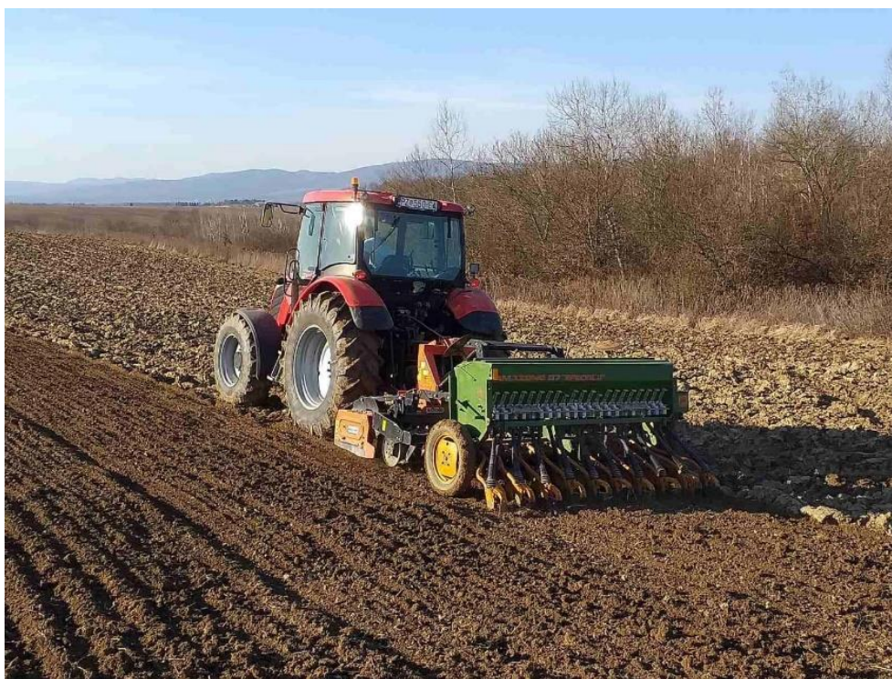
Slika 16. Sjetva pšenice u jednom prohodu