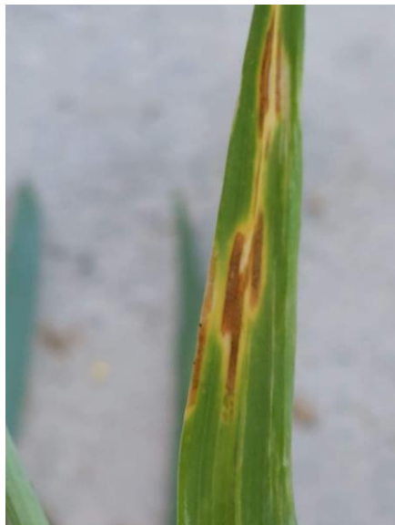
Slika 20. Septoria tritici na listu pšenice

Obilaskom usjeva 21. travnja uočena je sporadična pojava uzročnika bolesti Septoria tritici (slika 20), dok je 14. svibnja uočena također sporadično Pyrenophora tritici-repentis (slika 21).