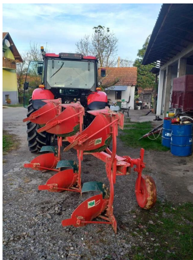
Slika 15. Plug VogelNoot L 950