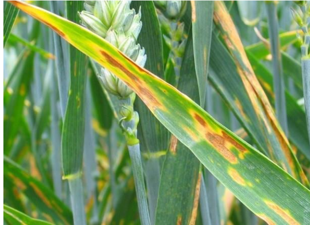
Slika 3. Smeđa pjegavost lista (uzročnik Septoria tritici )

ili u cijelosti odumrijeti, no proširi li se bolest na vrat korijena pšenice ona će odumrijeti. U trenutku pojave bolest zahvaća prvenstveno donji dio lišća te ovisno o uvjetima koji su više ili manje pogodni za razvoj bolesti, širi se dalje prema vrhu biljke, a bude li zaraza jaka listovi se suše. Unutar pjega počinju se oblikovati crni piknidi (Slika 4).