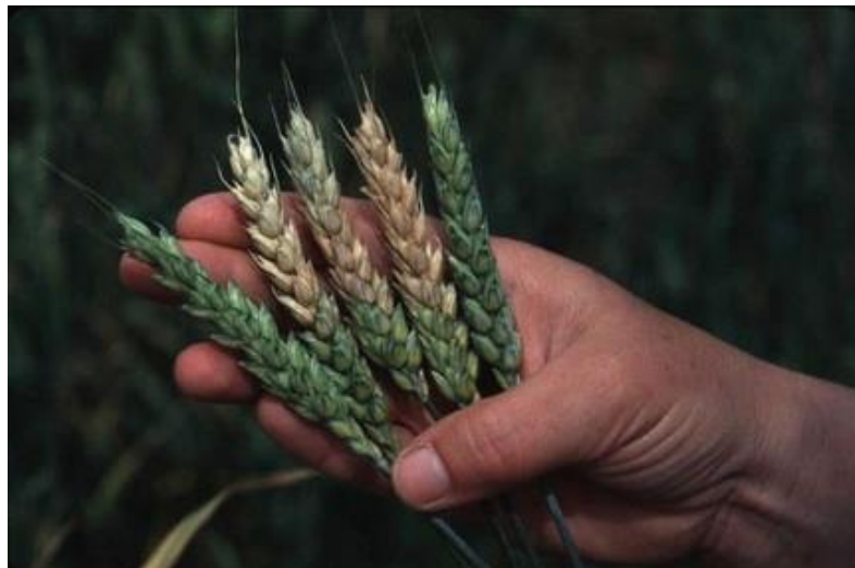
Slika 13. Fuzarijska palež klasova

Jača pojava bolesti događa se zbog uskog plodoreda u kojem se izmjenjuju pšenica i kukuruz ili čak uzgoj pšenice u monokulturi. Slijedi li u plodoredu pšenica iza kukuruza, do zaraze dolazi lako tijekom čitave vegetacije jer se patogen održava u tlu na ostacima kukuruza.