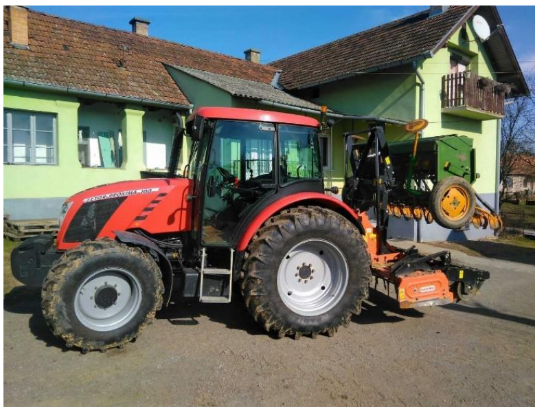
Slika 14. Traktor Zetor Proxima 100 korišten u sjetvi pšenice

Mehanizacija kojom su obavljani svi tehnološki zahvati u vlasništvu su OPG-a Retkin (Tablica 4).