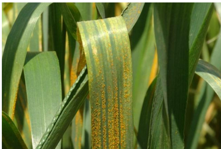
Slika 7. Žuta (crtičava hrđa) (uzročnik Puccinia striiformis )

Uzročnik žute ili crtičave hrđe je gljiva Puccinia striiformis koja se na prostoru Hrvatske javlja od 1928. godine. Do 2014. godine pojavljivala se povremeno (1932., 1951., 1955., 1981.) i nije uzrokovala značajnije štete (Radan i sur., 2014.). Bolest je karakteristična za sjeverne dijelove svijeta i pojavljuje se u više od 60 zemalja. Zaraza se širi u uvjetima visoke vlažnosti i temperaturama koje se kreću od 13 i 18°C. Prema novijim podacima bolest se javlja i u uvjetima u kojima su temperature više (Ćosić i sur., 2015.). Širenju bolesti pogoduje vjetar te se najčešće pojavljuje na listu, odnosno plojci lista na kojemu se vide uredosorusi poredani jedan iznad drugoga čineći linije između lisnih žila (Slika 7). Početak bolesti na mladoj pšenici obilježen je malim žutim uredosurima koji su na plojci lista poredani bez reda. Zahvaća prvo donje listove, a može preći i na gornje.