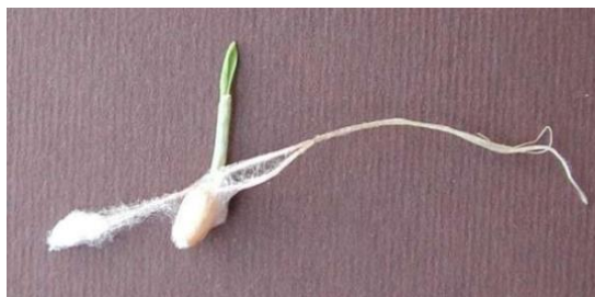
Slika 11. Palež klijanaca

( https://www.gospodarstvo-petricevic.hr/kor/upload/2014/06/10/20140610172629-1faf6478.jpg )