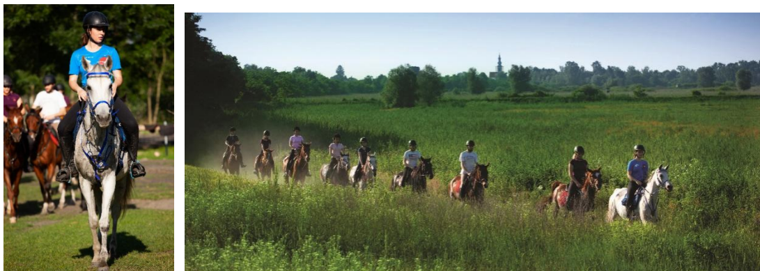
Slike 3. i 4. Prikaz treninga konja i jahača za daljinsko natjecanje

Usporedno s ostalim konjičkim sportovima, konji koji su utrenirani za daljinsko jahanje, natječu se na raznovrsnim terenima od kamenite podloge, livadnih trava do potoka, šljunčanih terena, blatnih puteva i drugih te svaka vrsta terena odnosno podloge može uzrokovati različit tip ozljeda. Ortopedski problemi i hromost su glavni uzrok eliminacije u natjecanju izdržljivosti osobito na događajima na većoj udaljenosti i kod starijih konja (James, 2020., Misheff i sur., 2010., Nagy i sur., 2012., HKS, 2020., Šebalj, 2016.).