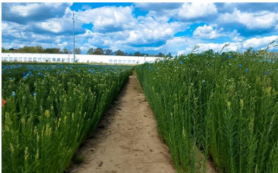
Slika 2. Stabljika predivnog lana

Stabljika lana je uspravna, zeljasta i tanka, na poprečnom presjeku je okrugla i šuplja. Pri vratu korijena je najdeblja, a prema vrhu se sužava. Površina stabljike je glatka i obrasla listovima. Prekrivena je voštanom prevlakom i svijetlozelene do svijetlosive boje. Visina stabljike ovisi o varijetetu lana, a najčešća visina je oko 30 – 150 cm (Hulina, 2011.). Dnevni prirast lanene biljke ovisi o sorti i o vanjskim uvjetima, kao što su temperatura zraka, vlažnost zraka itd. Porast stabljike prestaje kada je lan u cvatnji, cvatne grane se mogu nastaviti produžavati ali se sekundarni rast stabljike (debljina) odvija i nakon cvatnje. Stabljika predivnog lana visine je 60 - 120 cm i grana se u vršnom dijelu (Slika 2.). Predivni lan daje vrlo malo ploda pa se njegova stabljika koristi za proizvodnju vlakna, a vlakno se dobiva iz dijela između supki i prve grane cvata.