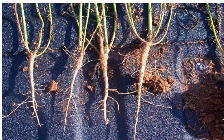
Slika 1. Korijen lana

Korijen lana sastoji se od glavnog i bočnog korijena. Glavni korijen je vretenast, tanak i ne prodire duboko u tlo (60 - 100 cm). Bočno korijenje je tanko i gusto isprepletano u tlu, a prodire u tlo 15 - 30 cm (Slika 1.). Korijen ima slabu upojnu moć za hraniva i vodu, stoga je poželjno da se razvije što više postrnih žila s mnoštvom finih žila sisalica. U gornjem oraničnom sloju tla razvija se glavna masa korijenova sustava. Poželjan je i korisniji kraći vretenasti korijen, jer prilikom žetve predivni lan se čupa s dijelom vretenastog korijena koji je balastni i smanjuje apsolutnu i postotnu količinu vlakna u prinosu lana. Uljani lan ima razvijeniji korijenov sustav i nešto dublji glavni korijen, pa bolje podnosi sušu.