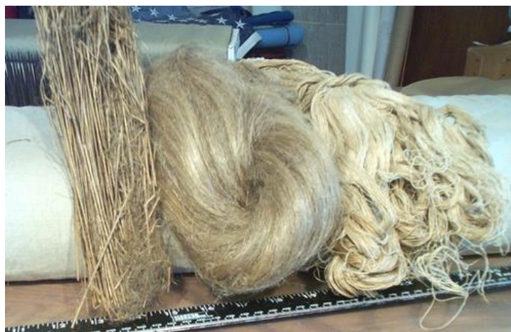
Slika 10. Laneno vlakno