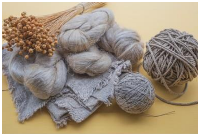
Slika 11. Lanena vlakna i proizvodi

vlakna. Dužina vlakna ovisi o visini biljke, većinom iznosi 30 – 100 cm. Vlakno se lako bijeli, a njegova boja može biti smeđa ili siva, blijedožuta ili potpuno bijela. Mekan je na opip i svilenog sjaja.