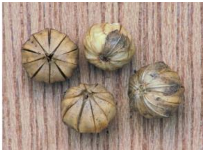
Slika 8. Plod lana

Plod lana je tobolac (Slika 8.) Može biti različitog oblika, najčešće okrugao ili zašiljen na vrhu. Različite su veličine. Tobolci predivnog lana manji su od tobolaca uljanog lana. Broj tobolaca po biljci ovisi o botaničkoj formi lana i agrotehničkim zahvatima kod iste forme. Zreli tobolac je smeđe ili žute boje i omotan je čašićnim listićima. Unutrašnjost tobolca sastoji se od pet komora, a svaka komora podijeljena je na dva dijela u kojoj se nalazi po jedna sjemenka. Najčešće se u jednom tobolcu nalazi 6 - 8 sjemenki (Pospišil, 2013.).