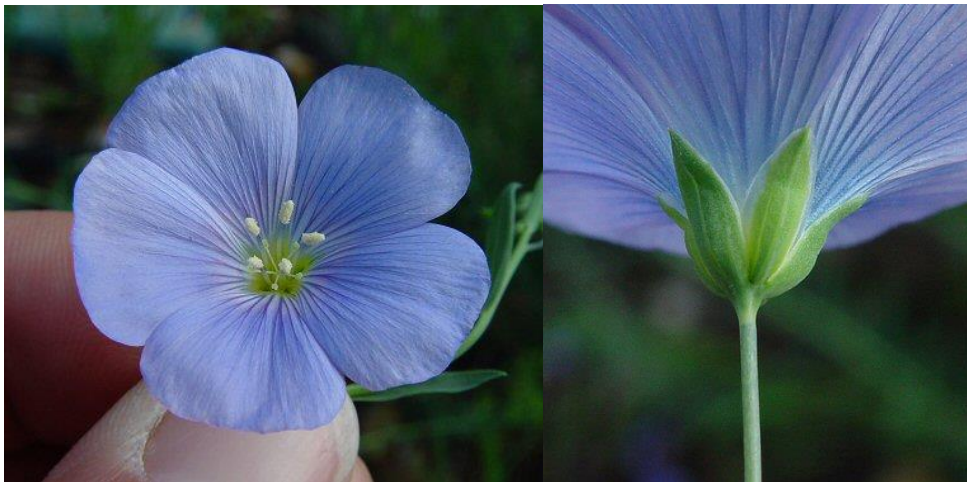
Slika 7. Cvijet lana

Gustoćom sjetve treba se osigurati takav sklop da razgranatost bude upravo tolika da ne snižava predivnu vrijednost stabljike, a da se dobije dovoljno sjemena za reprodukciju. Zametak cvjetnih pupova pojavljuje se kada je visina stabljike oko 15 cm. Vegetacijski vrh koji je bio uspravan, savija se. Cvjetne stapke tijekom razvoja cvijeta su uspravne. Cvjetovi su peterodjelni, ponekad se pojave šesterodjelni ili osmerodjelni (Slika 7.)