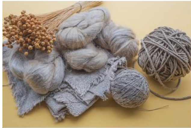
Slika 11. Lanena vlakna i proizvodi

vlakna. Dužina vlakna ovisi o visini biljke, većinom iznosi 30 – 100 cm. Vlakno se lako bijeli, a njegova boja može biti smeđa ili siva, blijedožuta ili potpuno bijela. Mekan je na opip i svilenog sjaja.