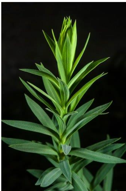
Slika 6. Spiralni raspored listovi lana na stabljici

Dužina listova je od 15 do 40 mm, a širina od 2 do 4 mm. Nakon tri do pet tjedana listovi dozrijevaju, zatim požute od baze prema vrhu stabljike i tim redom otpadaju. Predivni lan ima 100, a uljani 140 listova.