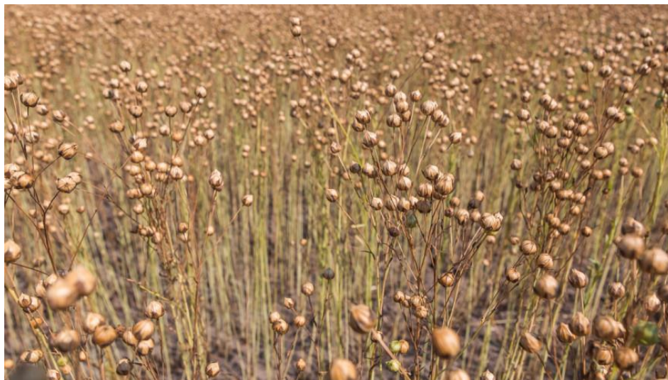
Slika 3. Stabljika uljanog lana

Stabljika uljanog lana (Slika 3.) je kraća, naraste 50 - 60 cm i grana se u gornjoj polovici. Uljani lan daje velik broj plodova oko 35 – 50, pa se uzgaja radi sjemena iz kojeg se dobiva vrlo kvalitetno ulje. Zbog kratke stabljike vlakno mu je kratko i nekvalitetno.