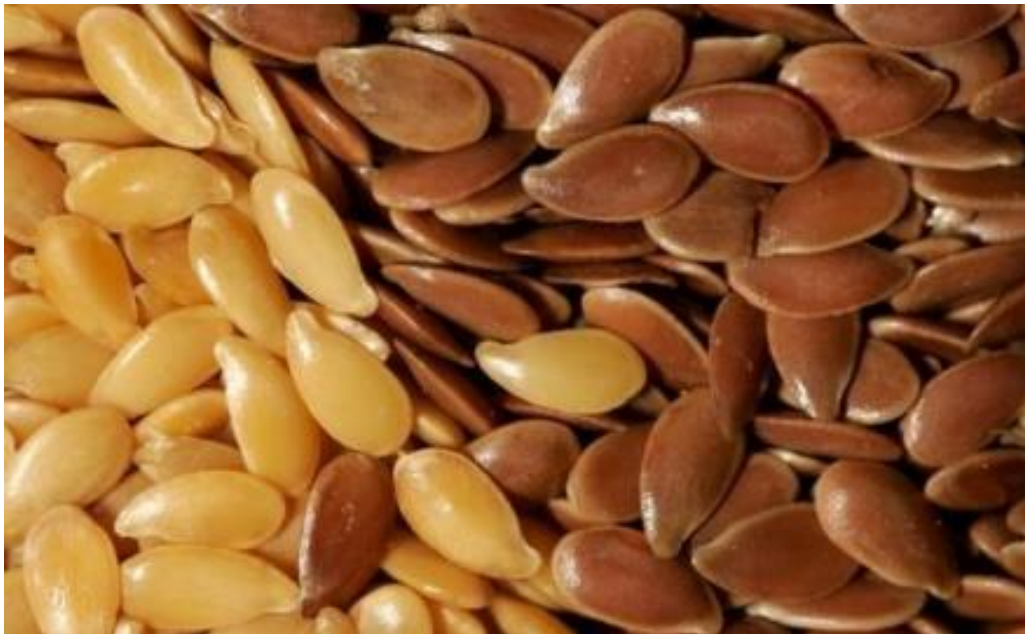
Slika 9. Sjeme lana

Sjeme lana obavijeno je sluzavim slojem koje omogućuje brže klijanje uz dovoljno vode i služi kao hrana za gljivice i bakterije. Sjeme lana vrlo lako apsorbira vodu i u vrijeme zriobe tijekom vlažnog vremena može doći do klijanja sjemena u tobolcu. Masa 1000 sjemenki uljanog lana iznosi 10 – 12 g, a predivnog 4 – 6 g. Hektolitarska masa varira od 65 – 75 kg. Sadržaj ulja u sjemenu uljanog lana je 38 – 45 %, a kod predivnog lana 33 – 38 % (Pospišil, 2013.).