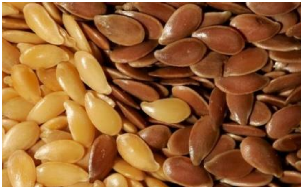
Slika 9. Sjeme lana