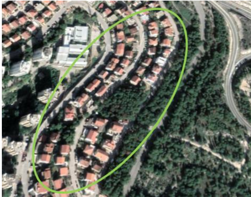
Slika 15. Dobar primjer gradnje, ostavljeno zelenilo