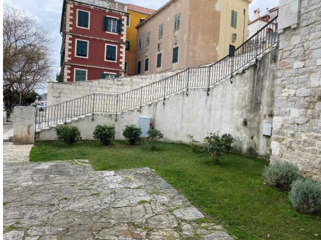
Slika 18. Stepenice katedrale sv. Jakova nakon posjećenog grma

Veliki značaj ima Srednjovjekovni samostanski mediteranski vrt Sv. Lovre, zbog toga što je jedini vrt takve vrste u cijeloj Hrvatskoj. Postoje samo nekoliko u Europi, što mu daje važnost da ostaje očuvan (slika 19). Oblikovnost srednjovjekovnog vrta: „križna staza, u središtu mali zdenac, jednostavno uređenje obrubljeno šimširom i prekrasnim, starinskim mirišljivim ružama. U četiri polja unutar kompleksa zasađeno je ljekovito i začinsko bilje. Posebno mjesto pripada zbirci majčine dušice s prekrasnim crvenkastim, ljubičastim, sivkastim, svijetlozelenim i tamnozelenim bojama lišća. Kombinacijom boja zbirka je vrhunska likovna i oblikovna senzacija. Još jedna znamenitost koju vrijedi spomenuti su kapari u vrtu. Legenda kaže da je kapare u Šibenik donio Juraj Dalmatinac. Kapari su posađeni u šupljinama zidova te nas podsjećaju na velikog graditelja Jurja Dalmatinca.“ ( https://www.rezerviraj.hr/crkve/41855-srednjovjekovni-samostanski-mediteranski-vrt-sv-lovre.html ).