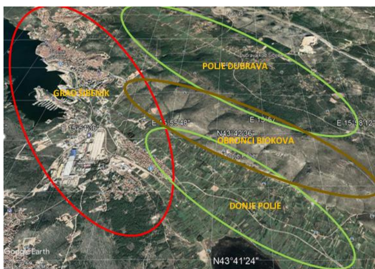
Slika 4. Prikaz područja grada Šibenika i okolice: Polje Dubrava, Grad Šibenik, Obronci Biokova i Donje Polje

Prema prostornom planu grada, Šibenik se širio dužinom obale (slika 4 – crvena oznaka), međutim s novom gradnjom počeo se širiti prema unutrašnjosti. Svojim daljnjim širenjem mogao bi uništiti jedinu šumu koju posjeduje te bi se gradnja približila poljima Dubrave (slika 4 – zelena oznaka). Polja Dubrave (označeno na slici 4 zelenom bojom) su područje izuzetno plodnih tala i pogodna za uzgoj vinove loze, maslina i ostalih mediteranskih kultura. U 2019. polja su bila korištena većinom za uzgoj masline, međutim 2020., na poljima ostaje samo korov i trava. Ostaju prazne parcele koje nisu u korištenju, a polja na kojima se još nešto uzgaja su većinom zapostavljena i neuređena. Obronci Biokova (slika 4 – oznaka smeđom bojom) dijele Donje polje i polja Dubrave. Velika su atrakcija za planinarenje zbog svog pogleda.