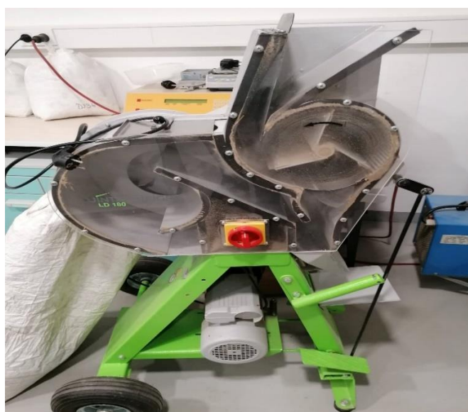
Slika 18. Uređaj za izvršavanje pokusa Wintersteiger LD 180