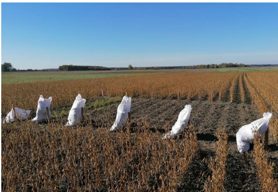
Slika 17. Završen posao prikupljanja biljnog materijala za svaku podvarijantu