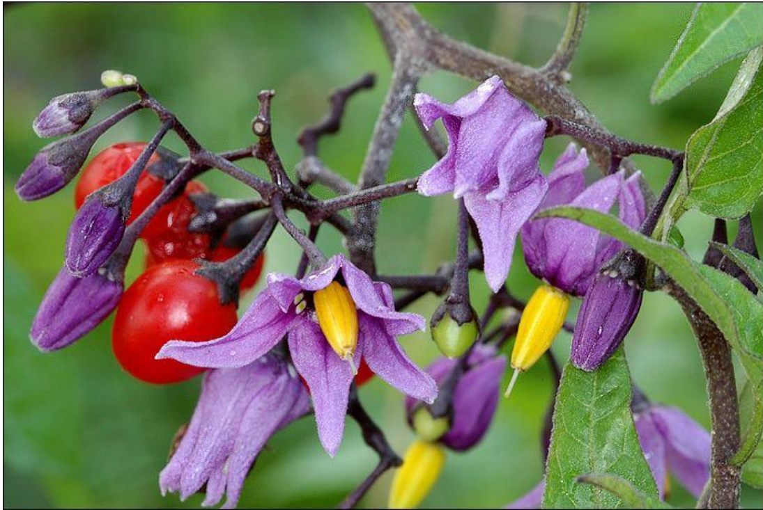
Slika 10. Pomoćnica paskvica ( S. dulcamara ) – cvijet i plod

ovalnog oblika veličine 7 – 10 mm. U svom početku zelene je boje, a kako dozrijeva mijenja boju u crvenu. Plod ima nekoliko pretinaca koji sadrže okruglaste, plosnate sjemenke, blijedožute boje. Bobe ne dozrijevaju u isto vrijeme, pa se na njoj mogu uočiti istodobno i zelene i zrele bobice (Knežević, 2006., Lesinger, 2006.a, 2006.b).