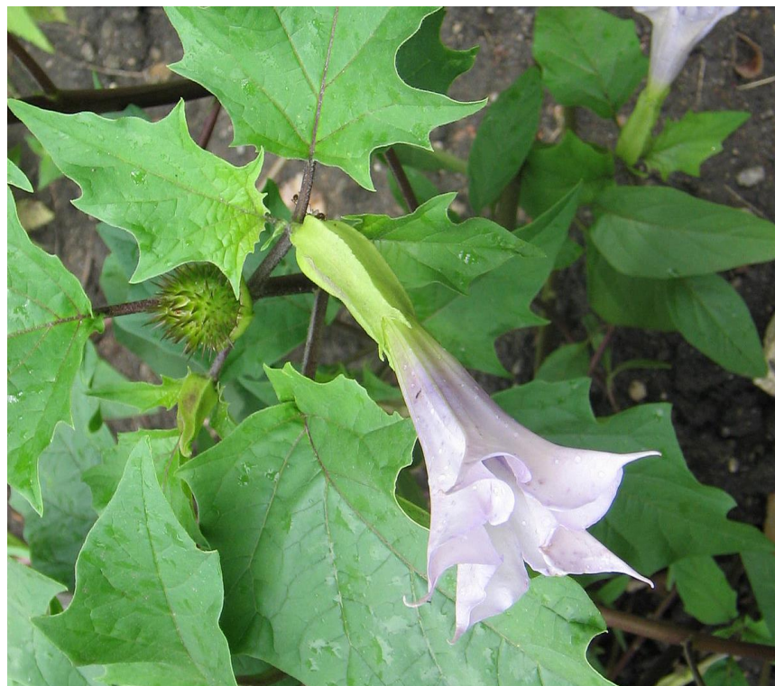
Slika 6. List i cvijet bijelog kužnjaka ( D. stramonium )

Bijeli kužnjak ( D. stramonium L.) (tatula, smrdljika) otrovna je zeljasta pomoćnica. Ime je izvedeno iz arapske riječi daturah što znači kužnjak ili tatula. Bijeli kužnjak sveta je biljka u Kini, posvećena je bogu Šivi, a u Kolumbiji se koristi u ritualima šamana (Lesinger, 2006.b). U svojoj kratkoj priči Carstvo kužnjaka (Tribuson, 2003.) hrvatski pisac Goran Tribuson opisuje halucinogene učinke ove biljke.