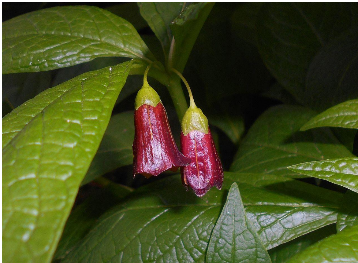
Slika 16. Bijeli bun ( Scopolia carniolica ) (izvor:

Bijeli bun ( S. carniolica ) (bunika kranjska, kranjski bijeli bun, eng.) pripada rodu Scopolia , a to ime dano mu je u čast talijanskog liječniku i prirodoslovcu Giovanniju Antoniju Scopoliju (18. stoljeće).