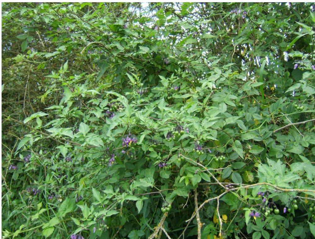
Slika 9. Pomoćnica paskvica ( S. dulcamara ) – cijela biljka

Pomoćnica paskvica ( S. dulcamara ) (razvodnik, gorkoslad, eng. bittersweet nightshade) višegodišnja je drvenasta otrovna vrsta. Latinska riječ dulcamara znači slatkogorak, pa je u narodu za ovu biljku čest naziv gorkoslad (Lesinger, 2006.a, 2006.b).