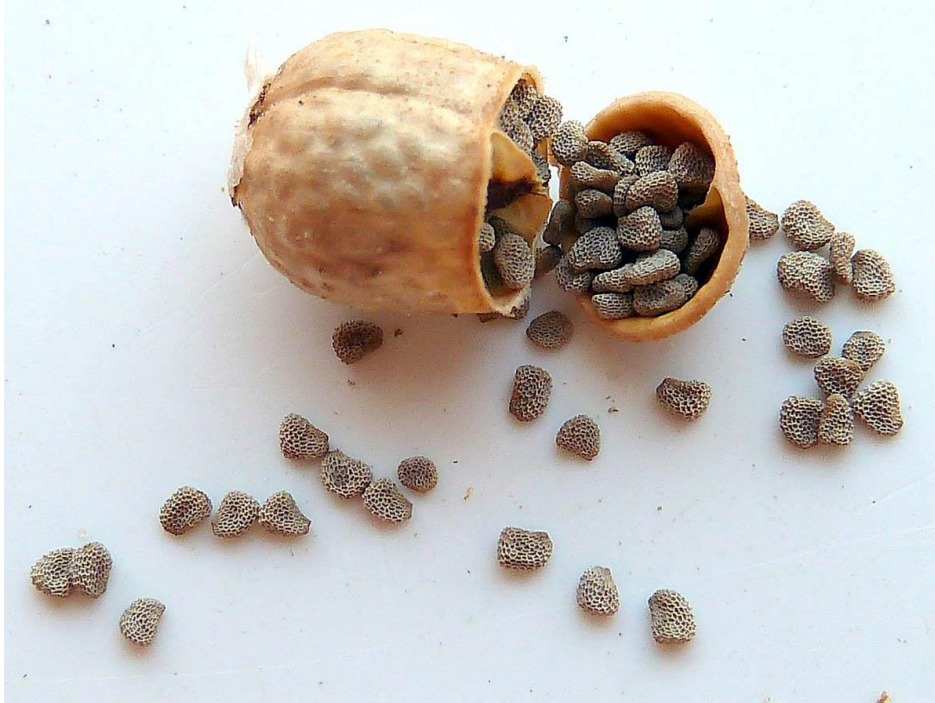
Slika 5. Plod i sjemenke bijele bunike ( H. albus )

Plod je smeđi tobolac i sadrži mnogo sjemenki sivosmeđe boje (slika 5.) (Swamy i sur., 2015.).