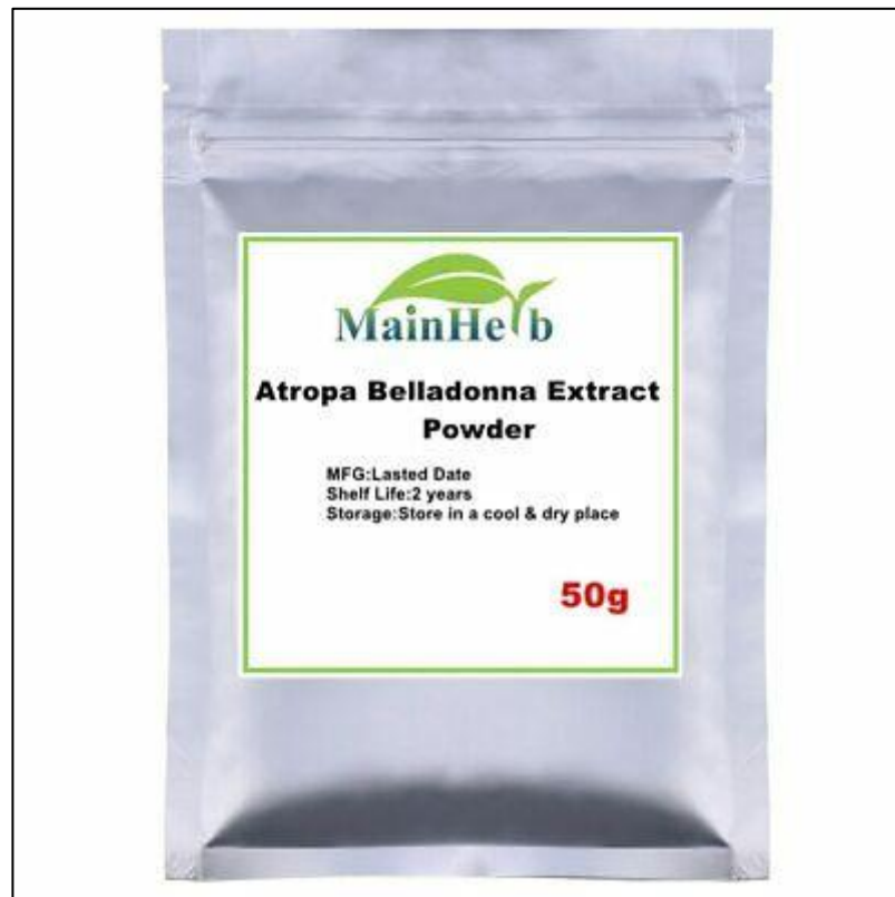
Slika 15. Prašak velebilja ( A. belladonna )

U liječenju, pučkoj narodnoj i zapadnoj medicini, velebilje se koristi u obliku tinktura i praška (slika 15.) za liječenje bolesti želuca i crijeva, neuralgija, bolesti mokraćnog sustava, srca, jetre i žuči te bolesti respiratornog sustava. Cigarete se sa suhim listovima velebilja ili praškom koriste se za liječenje astme (Lesinger, 2006.b).