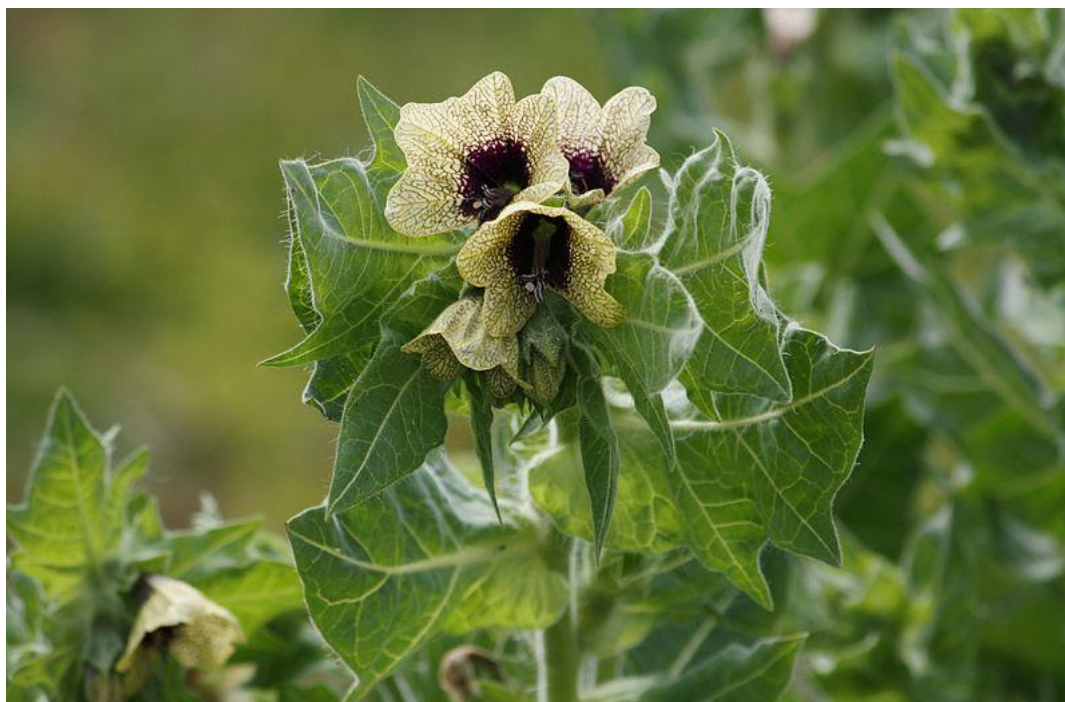
Slika 2. Crna bunika ( Hyoscyamus niger L.) – cijela biljka

Biljka se koristila u čarobnjaštvu te za gatanje, pa je često bila sastavni dio ljubavnih napitaka i masti koje su pripremale vještice. U Hamletu se spominje njena uporaba kao otrov, a u Romeu i Juliji se spominje kao napitak koji je uspavao Juliju (Gursky, 1999.). U Rimsko doba i doba Bizanta koristila se kao sredstvo protiv boli te za uspavlivanje (Ramoutsaki i sur., 2002.).