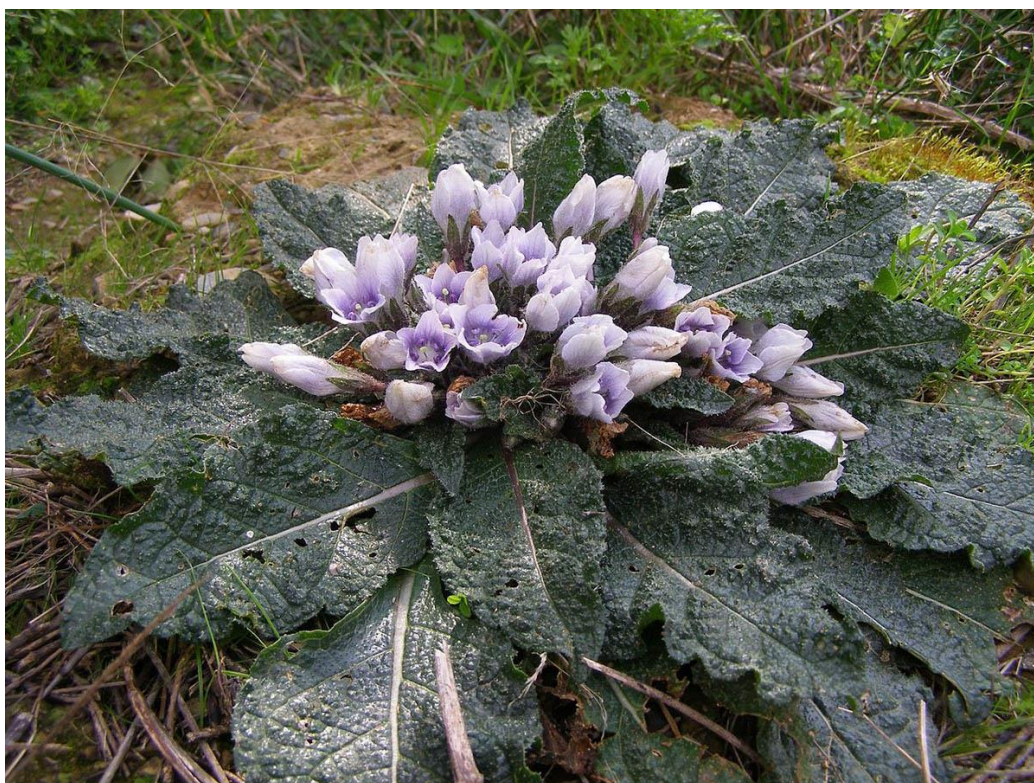
Slika 17. Mandragora ( M. officinarum ) – cijela biljka

Mandragora ( M. officinarum ) (bunovina, divlja jabučica, eng. mandrake) zeljasta je biljka iz porodice pomoćnica (Solanaceae). Od Galenovog vremena pa sve do Bizantskog razdoblja, mandragora se koristila u raznim mješavinama s drugim biljem, ali uglavnom s opijumom, kao sedativ u kirurške svrhe. Također je bila korištena kao analgetik i emetik protiv raznih bolesti ili tegoba te kao protuotrov za ugriz zmija (Ramoutsaki i sur., 2002.).