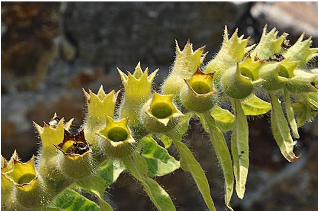
Slika 3. Crna bunika ( Hyoscyamus niger L.) – tobolci

jajasti, nazubljeni i dlakavi. Listovi u donjem dijelu biljke smješteni su na peteljka, dok su gornji listovi sjedeći i obuhvaćaju stabljiku. Na pazušcima listova nalaze se cvjetovi, dvostrukog ocvijeća. Čaška cvijeta je zelena, a vjenčić nepravilan, smečkasto-žute boje. Cvjetovi crne bunike imaju u sredini veliku tamnu mrlju, a prožeti su tamnoljubičastim ili crnim žilicama. Cvate od lipnja do kolovoza. Plod je tobolac (slika 3.) koji sadrži veliku količinu sitnih crnih sjemenki. Cijela biljka ima neugodan miris (Lesinger, 2006.b, Graham i Johnson, 2010.).