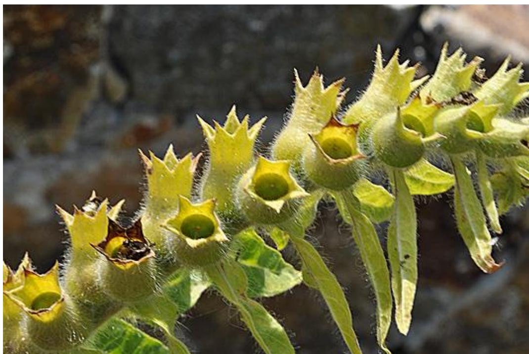
Slika 3. Crna bunika ( Hyoscyamus niger L.) – tobolci

jajasti, nazubljeni i dlakavi. Listovi u donjem dijelu biljke smješteni su na peteljka, dok su gornji listovi sjedeći i obuhvaćaju stabljiku. Na pazušcima listova nalaze se cvjetovi, dvostrukog ocvijeća. Čaška cvijeta je zelena, a vjenčić nepravilan, smečkasto-žute boje. Cvjetovi crne bunike imaju u sredini veliku tamnu mrlju, a prožeti su tamnoljubičastim ili crnim žilicama. Cvate od lipnja do kolovoza. Plod je tobolac (slika 3.) koji sadrži veliku količinu sitnih crnih sjemenki. Cijela biljka ima neugodan miris (Lesinger, 2006.b, Graham i Johnson, 2010.).