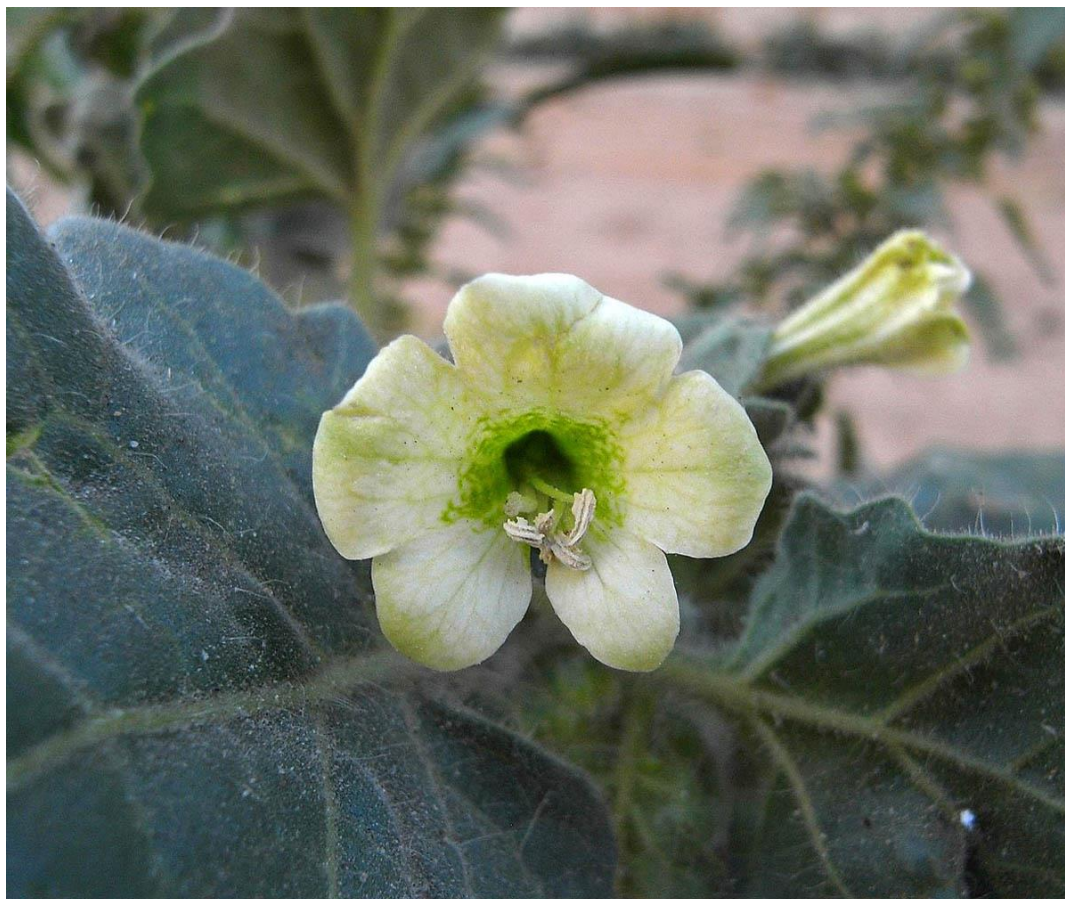
Slika 4. Cvijet bijele bunika ( H. albus )

Bijela bunika ( H. albus ) (eng. white henbane) zeljasta je otrovna biljka iz porodice pomoćnica (Solanaceae). Bijelu buniku koristile su proročice, a bila je poznata pod brojnim imenima kao što su zmajeva biljka, Zeusov grah, Apolonova biljka (Rätsch, 2005.).