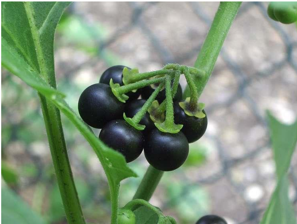
Slika 12. Crna pomoćnica ( S. nigrum ) - plod

a kad sazrije crna (slika 12.). Svaka bobica sadrži veći broj sivosmeđih hrapavih plosnatih sjemenki. Jedna biljka proizvede oko 500 sjemenki, što godišnje iznosi i do 40.000 sjemenki. Sposobnost klijanja biljka zadržava vrlo dugo – čak i nakon 40 godina (Hulina, 1998., Lesinger, 2006.b, Saleem i sur., 2009.).