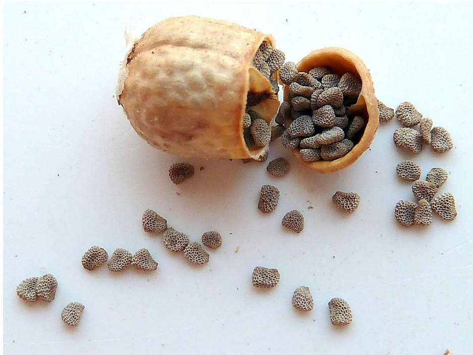
Slika 5. Plod i sjemenke bijele bunike ( H. albus )

Plod je smeđi tobolac i sadrži mnogo sjemenki sivosmeđe boje (slika 5.) (Swamy i sur., 2015.).