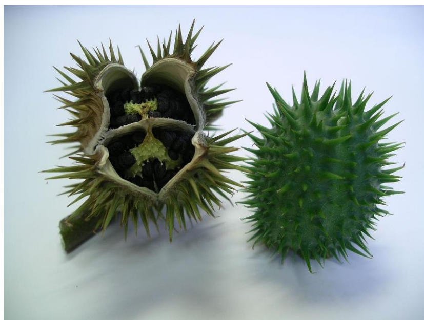
Slika 7. Plod bijelog kužnjaka ( D. stramonium )

20.000 sjemenki koje imaju sposobnost klijavosti i do 40 godina, a masa 1000 sjemenki je 5-6 g (Knežević, 2006., Lesinger, 2006.b).