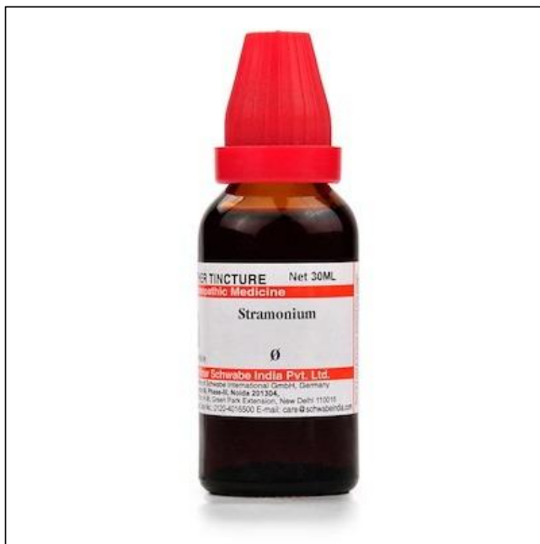
Slika 8. Tinktura bijelog kužnjaka ( D. stramonium )

Simptomi trovanja kužnjakom su: uznemirenost, konfuzija, pospanost, klonulost, hodanje prelazi u geganje, posrtanje, pojava halucinacija, ubrzanje srčanog pulsa, gubitak pamćenja, suhoća usta, mučnina, suhoća kože, širenje zjenica oka, nejasan govor, povišena tjelesna temperatura, žeđ, nesvjestica, nekontrolirano mokrenje (Grlić, 1989., Lesinger, 2006.b).