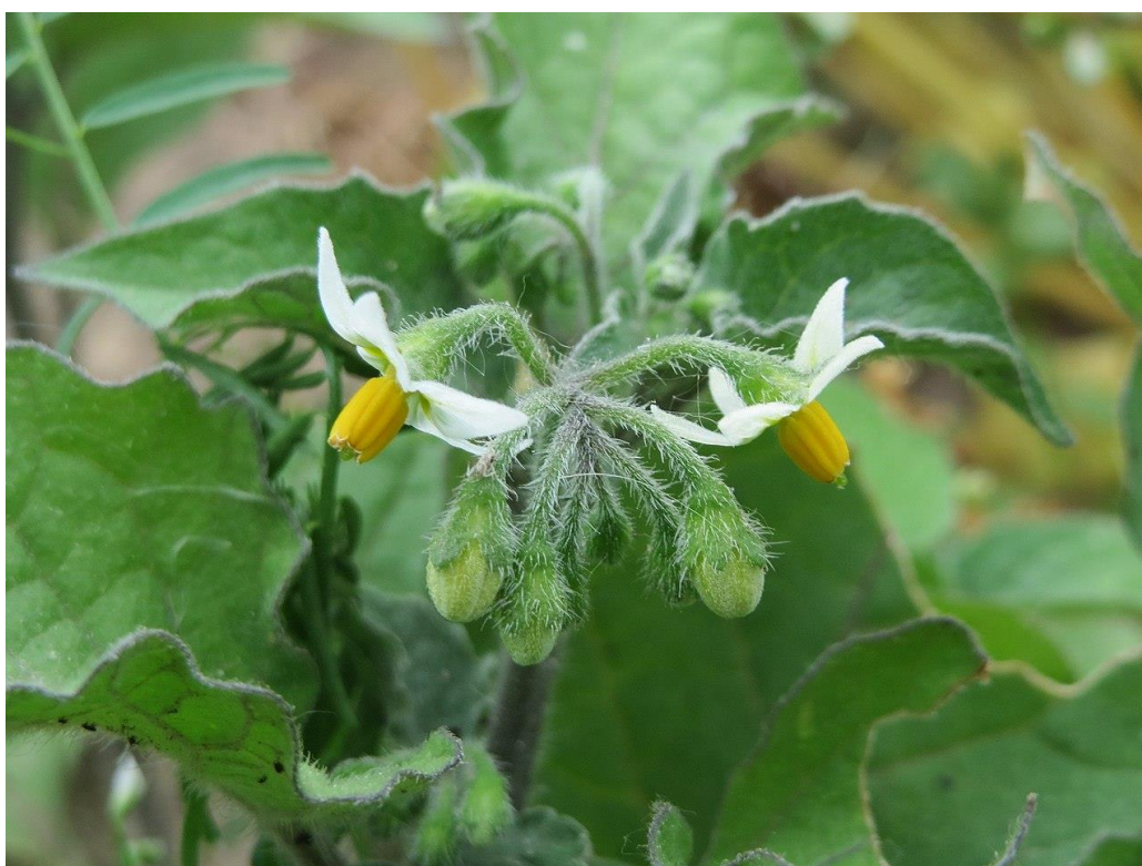
Slika 11. Crna pomoćnica ( S. nigrum ) - cvijet

Crna pomoćnica ( S. nigrum ) (paskvica, kokošje grožđe, eng. black nightshade) zeljasta je biljka iz porodice pomoćnica. Latinski naziv solanum potječe od riječi solamen što znači smirujući, a nigrum crn što upućuje na crne zrele plodove (Gligić, 1953.). Dioskurid ovu biljku spominje kao lijek za bolesti želuca, a rabila se i za opijanje bolesnika prije operacija (Lesinger, 2006.b). U Češkoj vlada uvjerenje da će biljka utjecati na bolji san djece, pa je ljudi stavljaju maloj djeci u kolijevke. Arapi su crnu pomoćnicu upotrebljavali kao oblog na opekline i čireve. I u našim krajevima ljudi su crnu pomoćnicu često upotrebljavali u obliku obloga za smirivanje upala i bolova (Černicki, 2006.).