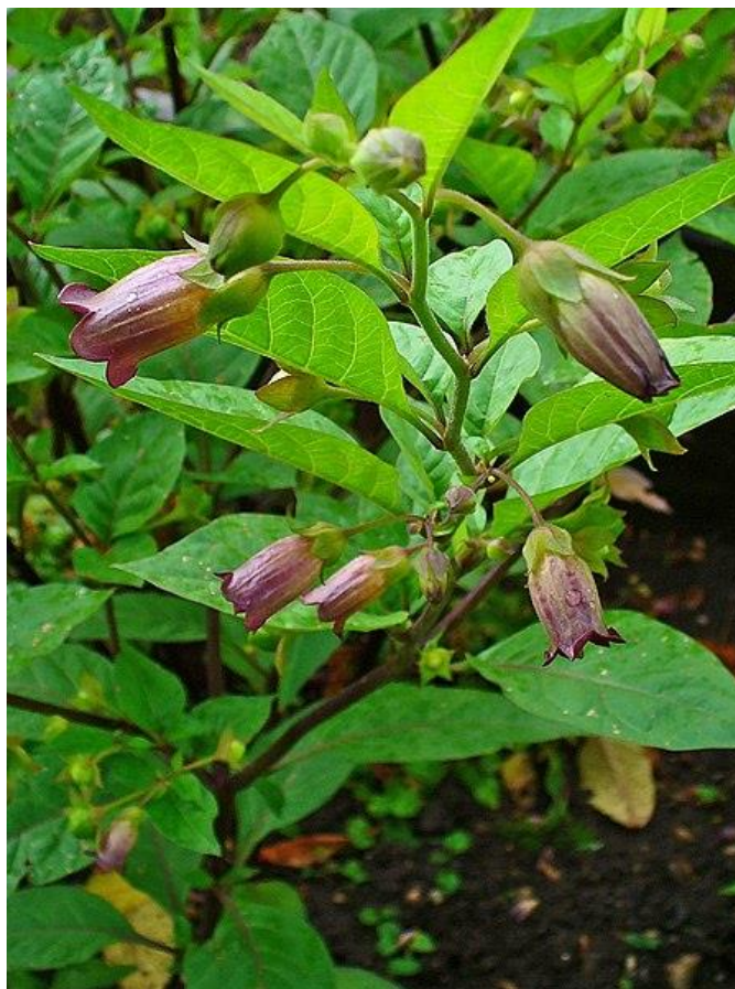
Slika 13. Velebilje ( A. belladonna ) – cijela biljka

Velebilje ( A. belladonna ) (beladona, vučja trešnja, eng. deadly nightshade) trajnica je i jedna od najotrovnijih predstavnika porodice pomoćnica. Od velebilja su se u povijesti pripremali napitci koji izazivaju halucinacije i izrađivala vješticija mast. Biljka je ime dobila po grčkoj riječi „atropos“ što znači „koja presijeca životnu nit“ i „bella donna“ što znači lijepa žena (Lesinger, 2006.b). U Rimsko doba i za vrijeme Bizanta velebilje se koristilo kao sredstvo za uspavlivanje i smirenje (Ramoutsaki i sur., 2002.). Tijekom srednjeg vijeka, tonik za ljepotu napravljen od lišća i bobica velebilja koristile su Venecijanke kako bi izazvale rumenilo na koži. Tonik se koristio i za proširenje ženskih zjenica što je bilo u to doba moderno. Zbog popularnosti uporabe u kozmetičke svrhe, velebilje je i dobilo svoje ime. Velebilje je bilo nezaobilazan sastojak napitaka vještica. Kao sredstvo za trovanja koristile su ga ubojice, a rimska vojska je od velebilja pravila pastu koju je premazivala na vrhove strijela (Sterkenberg, 2015.).