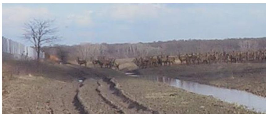
Slika 14. Nemogućnost migracije jelenske divljači u veljači 2016. godine u u zajedničkom otvorenom lovištu broj XIV/167 Duboševica

Postavljena žica na granici s Mađarskom uzrokovala je značajne posljedice na životinjski svijet. Nepovoljni i štetni utjecaji bodljikave “žilet” žice koja je smještena ispred ograde predstavlja opasnost za sve vrste divljači, također visoka ograda od 3 metra u potpunosti sprječava migraciju divljači. Prvobitna zamisao je bila ukloniti žilet žicu nakon postavljanja visoke ograde, ali to nije učinjeno. I dalje se bilježe slučajevi stradavanja divljači u manjem broju, ali glavni problem je ostao. Onemogućene su dnevne i sezonske migracije jelenske divljači, te je postavljanjem žice populacija razdvojena pri čemu se ne zna koliko ih je ostalo s jedne, a koliko s druge strane. Stoga postavljanjem visoke ograde dolazi do narušavanja prirodne ravnoteže u staništu, te dovodi do poremećaja u ponašanju i migracijskim navikama divljači. Ovaj problem je još veći u sezoni rike jelenske divljači, koja se događa krajem kolovoza i početkom rujna, jer nemogućnošću migracije dolazi i do nemogućnosti miješanja genetskog materijala, što dugoročnim ostavljanjem ograde može imati neželjene posljedice po populaciji jelenske divljači s obje strane.