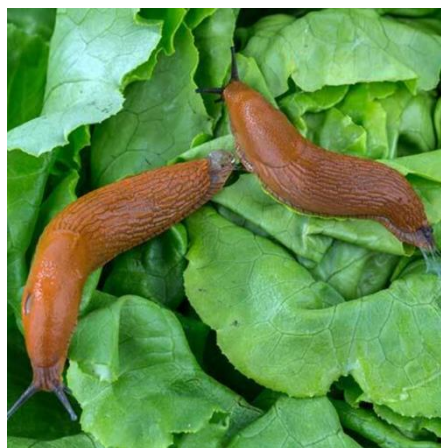
Slika 20. Španjolski puž ( Arion vulgaris L.) na salati

Pred kraj istraživanja, na pojedinim glavicama salate je uočen napad španjolskoga puža golaća ( Arion vulgaris L.) koji je prikazan na slici 20. Španjolski puž ( Arion vulgaris L.) je suzbijan sakupljanjem i iznošenjem iz plastenika. Štetnik nije značajno utjecao na kakvoću i prinos salate.