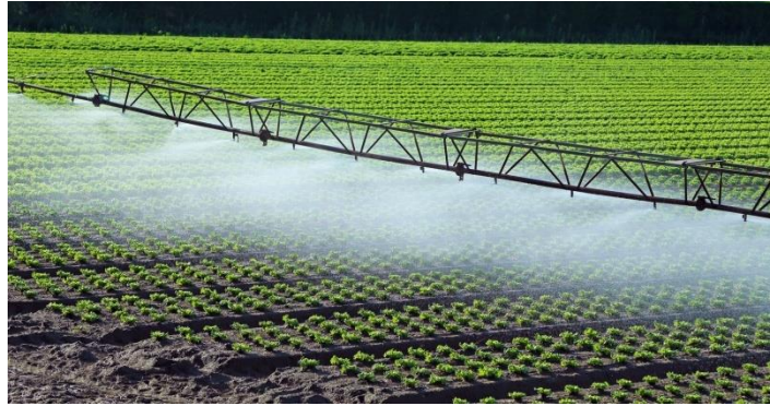
Slika 14. Kišno krilo