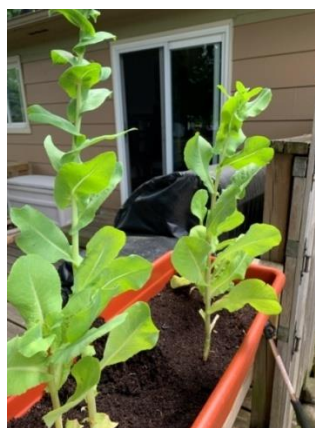
Slika 2. Stabljika salate

Stabljika salate (slika 2.) se sastoji od nodija i internodija. U prvom dijelu vegetacije nodiji i internodiji su skraćeni. Iz stabljike se razvija lišće koje formira rozetu. U drugom dijelu vegetacije nodiji i internodiji se produžuju te mogu dosegnuti visinu do 1,5 m. Tijekom generativne faze stabljika se grana i raste, a na vrhu se razvija glavičasta cvat (Parađiković, 2014.).