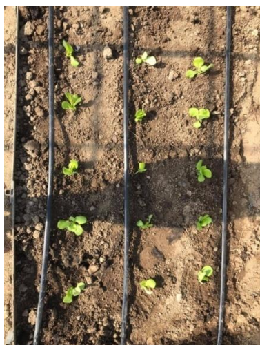
Slika 16. Salata navodnjavana „kap po kap“ sustavom, razmak unutar reda 25 cm (Kapular, K., 2020.)

Shema pokusa je prikazana u narednim fotografijama (slika 16., 17., 18. i 19.).