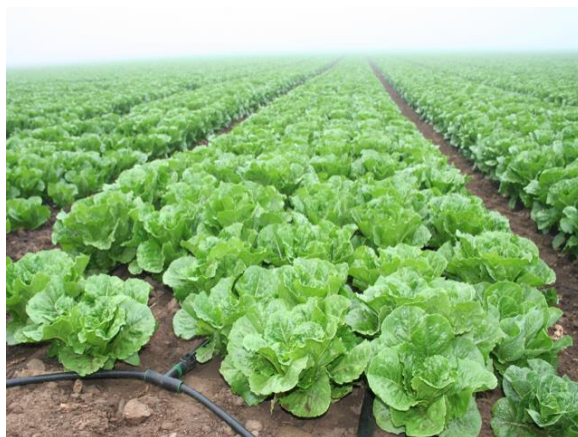
Slika 8. Proizvodnja salate na otvorenoj poljoprivrednoj površini