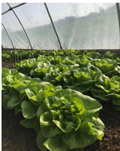
Slika 9. Uzgoj salate u plasteniku

Salata se uspješno uzgaja u plastenicima i staklenicima (slika 9.). Zbog skromnih potreba za toplinom i svjetlošću, može se uzgajati tijekom čitave godine. Sadnja presadnica se obavlja na razmak od 15 do 25 cm. Ako su presadnice uzgojene u tresetnim kockama, površina tla se označi valjkom koji oblikuje jamice u koje se spuštaju kocke sa zasijanim biljkama. Sadnja salate može biti na foliji ili bez folije. Navodnjavanje se obavlja putem sustava „kap po kap“ ili orošavanjem. Zaštićene prostore je potrebno redovito prozračivati (Parađiković, 2014.).