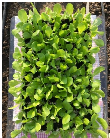
Slika 7. Presadnice salate

U suvremenoj poljoprivrednoj proizvodnji, presadnice salate se uzgajaju u tresetnim kockama čija je veličina 3 do 4 cm (slika 7.). Sjetva se obavlja uz pomoć specijalnoga stroja koji pilirano sjeme ulaže u svako udubljenje kocke. Nakon toga, zasijane kocke je potrebno zaliti i prekriti folijom dok sjeme ne počne nicati. Do nicanja je potrebno održavati temperaturu od 15 do 18 °C, a nakon nicanja od 10 do 12 °C. Preporučena relativna vlažnost zraka je 60 do 70 %. Uz optimalne uvjete, presadnice bi trebale biti spremne za presađivanje za dvadesetak dana. Presadnice se mogu uzgajati i iz plitica od PVC-a ili stiropora. Plitice mogu biti različitih veličina, a najčešće se koriste plitice sa 104 sjetvena mjesta, promjera 2 cm (Parađiković, 2014.).