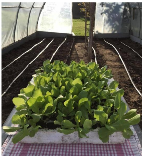
Slika 15. Presadnice salate

U istraživanju je korištena salata puterica AS-104. Presadnice salate (slika 15.) su uzgojene u tresetnim kockama u polistirenskoj plitici u jednakim uvjetima kako bi se postigao što ujednačeniji rast u početnom dijelu vegetacije. Presadnice su presađene u tlo nakon što su dosegle fazu 4 do 5 listova.