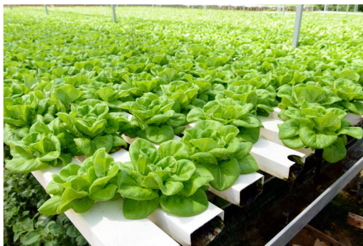
Slika 10. Hidroponski uzgoj salate

Uzgoj bez tla se počeo razvijati krajem osamdesetih godina. Danas ovakav način proizvodnje podrazumijeva uzgoj u hranjivoj otopini sa ili bez supstrata. Supstrati mogu biti materijali poput kamene vune ili kokosovih vlakana. Uzgoj salate (a i ostaloga lisnatoga povrća) bez tla se obavlja putem plutajuće metode hidroponije (slika 10.). Plutajuća metoda podrazumijeva uzgoj salate u čistoj hranjivoj otopini uz tehniku kontinuirane cirkulacije hranjive otopine. Proizvodnja se obavlja u plitkim bazenima koji su ispunjeni hranjivom otopinom na kojoj plutaju polistirenske ploče sa biljkama. Pozitivne strane plutajuće hidroponije su: više berbi unutar jedne sezone, smanjena količina nitrata, recirkuliranjem vode ne onečišćuje se okoliš na području proizvodnje (Parađiković, 2014.).