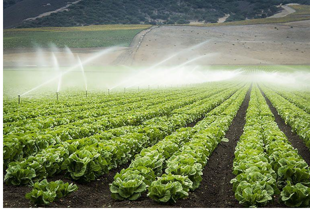
Slika 13. Stabilni sustav navodnjavanja