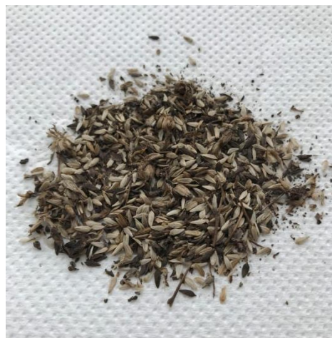
Slika 6. Sjemenke salate

Plod salate je roška (ahenij) koja može biti sive, smeđe ili crne boje (slika 6.). Masa 1000 sjemenki može biti od 0,6 do 1,3 grama. Sjemenke su ovalnoga i izduženoga oblika (Parađiković, 2014.).