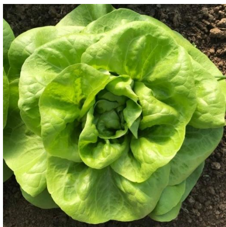
Slika 3. Maslenka (Kapular, K., 2020.)

Salata romana ( Lactuca sativa var. romana ) razvija izduženu glavicu, dok salata stablašica ( Lactuca sativa var. angustana ) razvija stablo visine od 20 do 35 cm. Dugolisna salata ( Lactuca sativa var. longifolia ) ima uspravne, uske i glatke listove s izraženim srednjim rebrom (Parađiković, 2014.).