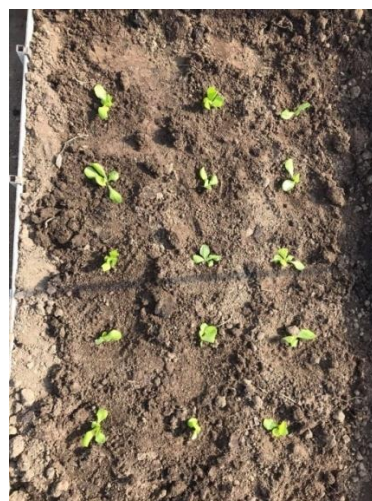
Slika 17. Salata navodnjavana ručno, razmak unutar reda 25 cm (Kapular, K., 2020.)