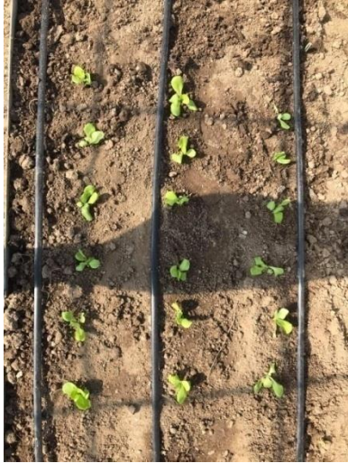
Slika 18. Salata navodnjavana „kap po kap“ sustavom, razmak unutar reda 20 cm (Kapular, K., 2020.)