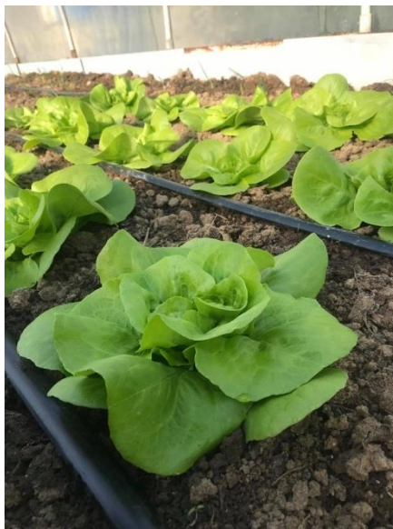
Slika 12. Navodnjavanje sustavom „kap po kap“

Sustav navodnjavanja kapanjem štedi vodu, te se s minimalnom količinom vode postižu maksimalni učinci u biljnoj proizvodnji. Iz toga razloga ovakav sustav je našao široku primjenu u zemljama poput Izraela, Francuske i juga Italije, gdje nema dovoljno vode za navodnjavanje. Sustavom „kap po kap“ moguće je neprestano održavati sadržaj vode u optimalnim granicama, a može se koristiti i u otvorenim i u zatvorenim prostorima (Madjar i Šoštarić, 2009.). Navodnjavanje salate lokaliziranom metodom je prikazan slikom 12.