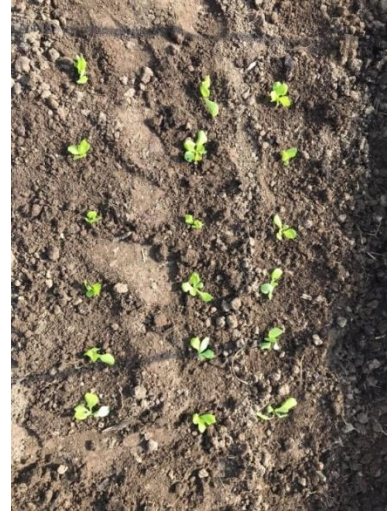
Slika 19. Salata navodnjavana ručno, razmak unutar reda 20 cm (Kapular, K., 2020.)

Sveukupno je na b1 tretmanu bilo posađeno 15 biljaka po m 2 te 18 biljaka po m 2 na b2 tretmanu.