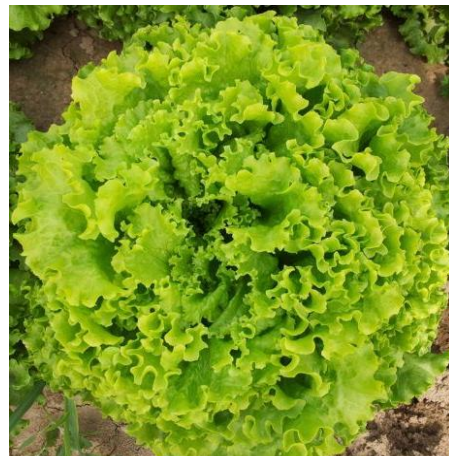
Slika 4. Kristalka