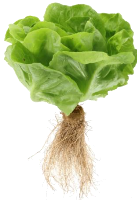
Slika 1. Korijen salate

Korijen salate (slika 1.) je razgranat i vretenast. Glavnina korijena se razvija u površinskom sloju tla do 35 cm dubine. Promjer korijena odgovara promjeru rozete s listovima (Parađiković, 2014.).