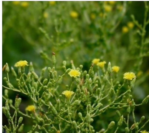
Slika 5. Cvijet salate

Cvjetovi salate su sastavljeni u cvat glavicu, a ona je obavijena pricvjetnim listovima (slika 5.). U svakom cvatu se nalazi oko 15 dvospolnih, jezičastih, žutih cvjetova. Iako su cvjetovi samooplodni, moguća je i stranooplodnja koja podrazumijeva prisustvo kukaca (Parađiković, 2014.).