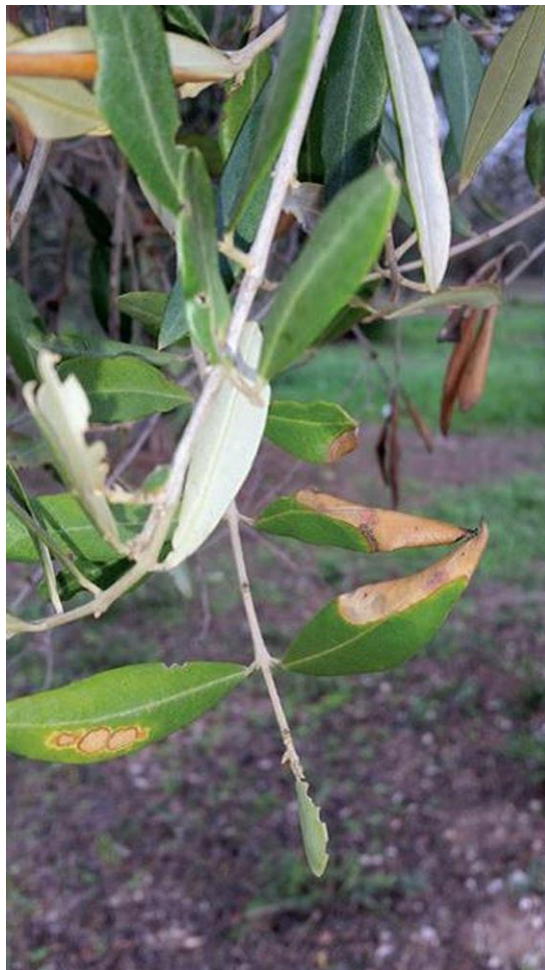
Slika 9. Rubni palež lista masline

Ova bolest je izrazito bolest lista masline. Javlja se na mlađem listu u obliku nekroza nepravilnog oblika, smeđosive boje Miličević i sur.(2012.).Na jednom listu jave se 2-3 nekrotične pjege (slika 9.). U životnom ciklusu ove gljive javljaju se apoteciji iz kojih se oslobađaju askospore koje u vlažnim uvjetima vrše infekcije. Uzročnici bolesti mogu biti i neki abiotski uzročnici kao što je nedostatak mikroelementa bora. Gljiva inficira lišće pomoću filiformnih ili nitastih askospora iz apotecija, a razvoju bolesti pogoduje vlažno vrijeme s dosta kiše. Unutar nekroza mogu se primjetiti sporulacijski organi .