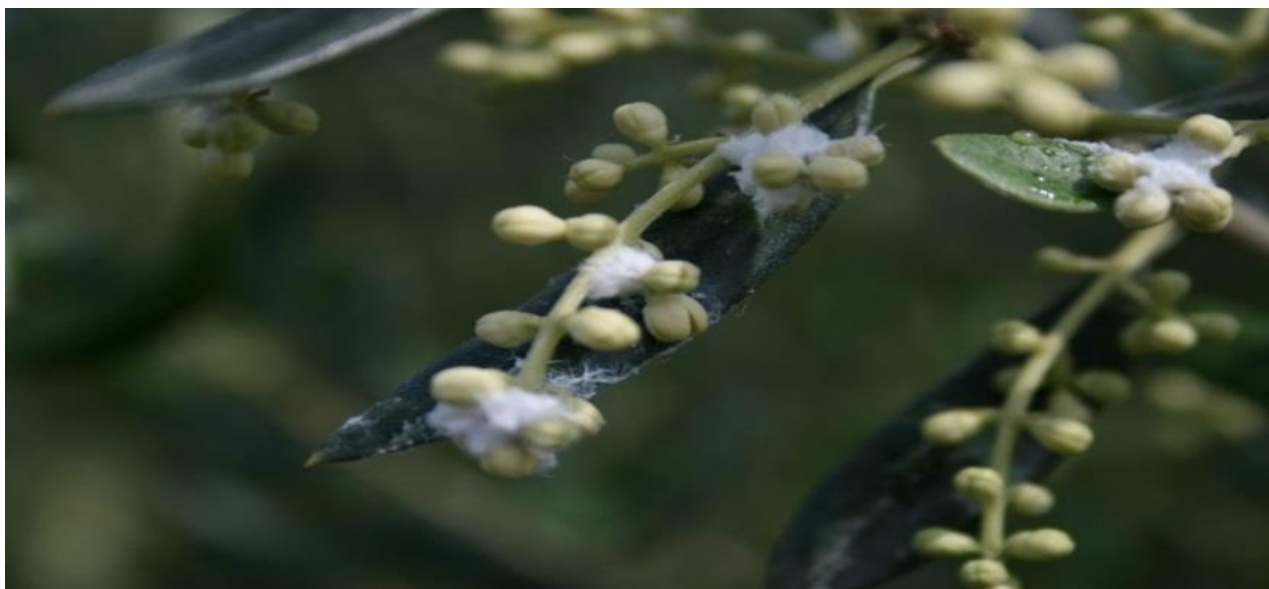
Slika 15. Štete od maslinine buhe

odlaže jaja na mladicama i peteljka lista i to 4-14 jaja dnevno. Embrionalni razvoj traje 10-15 dana, nakon čega iz jaja izlaze ličinke koje poslije prolaze kroz 5 razvojnih stadija. One izlučuju mednu rosu i voštane izlučevine u vidu bijelih nakupina (Slika 15.) (Šimala i sur., 2012.).