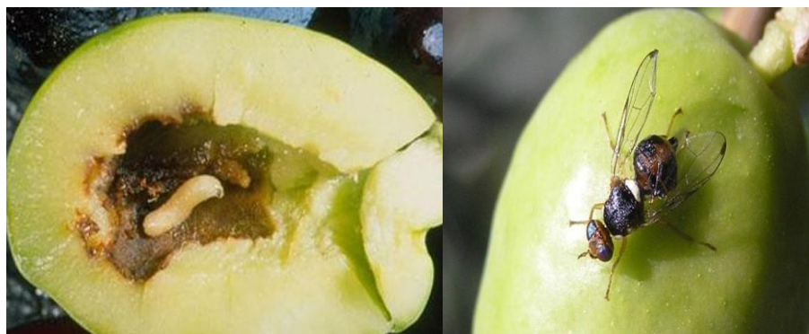
Slika 16. Ličinka maslinine muhe