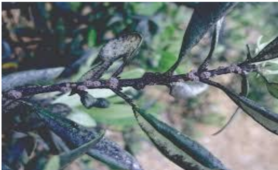
Slika 12. Čađavica masline

Franulović (2020.) navodi kako čađavica nije bolest u pravom smislu riječi, nego je riječ o saprofitnim vrstama koje ne uzrokuju bolest. Ona je posljedica napada nekih štetnih insekata masline, prije svega maslinina mediča, maslinine buhe i maslininog cvrčka. Oni izlučuju mednu rosu koja je ljepljiva na listu masline i tamne je boje, a na takvo tkivo se nasele gljivice čađavice te tvore sivo-crnu prevlaku. Takvi listovi gube sposobnost asimilacije te opadaju.