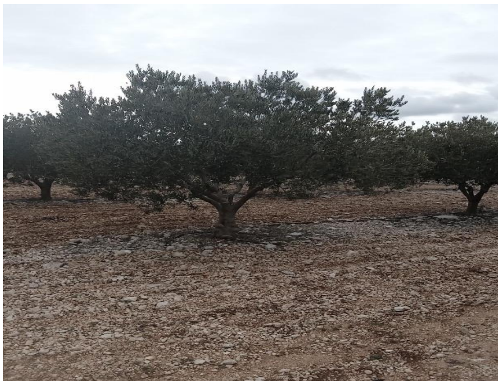
Slika 3. Krošnja masline

Krošnja masline je dosta gusta i razvijena što ovisi o sorti (Slika 3.). Kod talijanskih sorti krošnja je raširena, nije gusta i grane su joj spuštane skoro do tla. Kod Oblice je krošnja dosta gusta, raste u visinu i u širinu. Njezine grane su lijepo raspoređene, no da bi se izbjegao veliki rast u visinu potrebna je redovna rezidba. Kantoci (2006.) u svome radu navodi kako maslinama ne odgovaraju otvoreni položaji jer zbog jakog vjetera dolazi do loma grana te oštećenja masline.