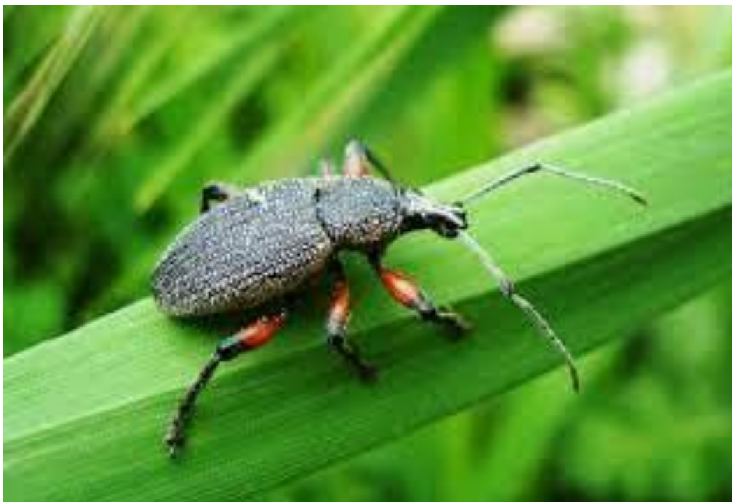
Slika 20. Pipa škorovača

Maslinina pipa je štetnik crne boje i veličine 10-12 mm (Slika 20.). Velike štete radi na listovima. Grize ih i ostavlja rupe i udubine. Noću se hrani, a danju je skrivena u zemlji ili pod kamenom. Ličinke ovoga štetnika žive u tlu, a hrane se korijenjem različitog bilja.