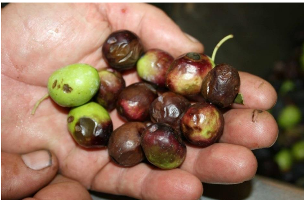
Slika 8. Trulež ploda masline

Miličević (2012.) u svome radu navodi kako je ova bolest raširena po cijelom svijetu. Simptomi se javljaju kao udubine po plodovima u obliku pjega (Slika 8.). Veličina tih udubljena je od 0,5 do 1,5 cm a takvi plodovi poprimaju smeđu do tamnosmeđu boju. Zaraženi plodovi opadaju tokom ljeta i jeseni. Uzročnik ove bolesti je Botryosphaeria dothidea . Gljiva prezimljuje na zaraženim plodovima u obliku plodnih tijela peritecija. Vektor zaraze je maslinina muha. Askospore se prenose vjetrom i kišom. Suzbijanje ove bolesti ne bi bilo učinkovito fungicidima jer bi trebalo prije svega suzbiti maslinovu muhu koja je vektor.