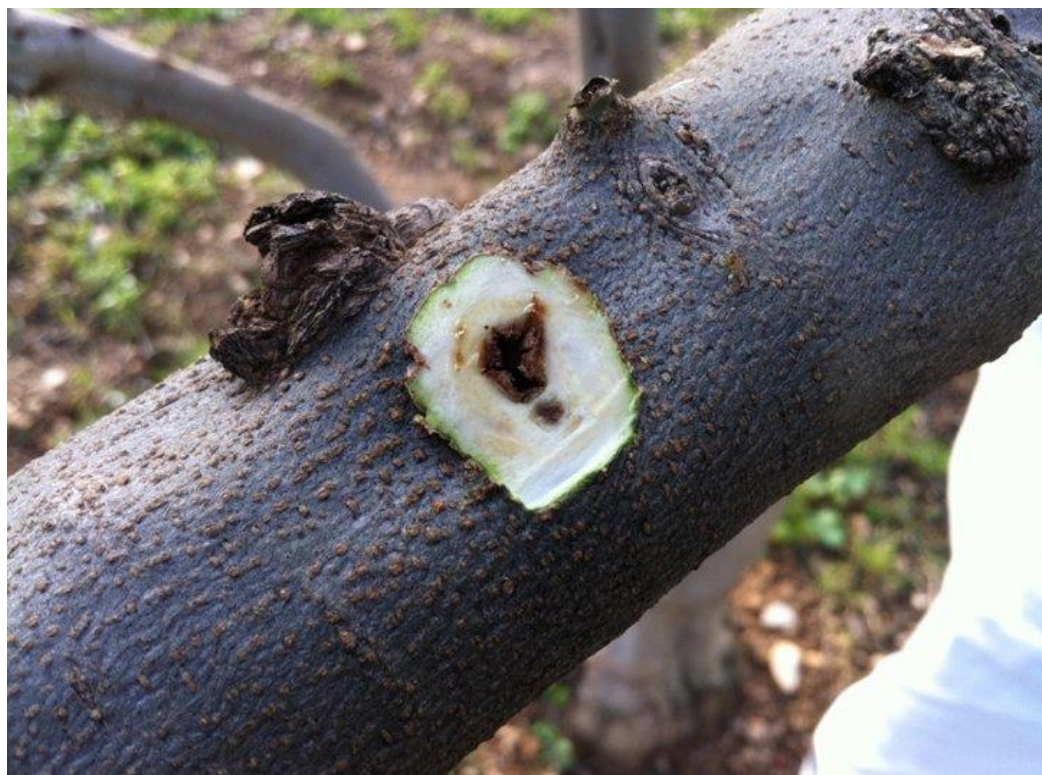
Slika 7. Rak masline

Rak masline je bolest koju uzrokuje bakterija. To je fitopatogena bakterija koja je cijelo vrijeme prisutna na granama masline, na deblu i na listovima. Kada dođe do ozljede masline, bakterija ulazi u tkivo. Simptomi se javljaju na lišću, na deblu pa čak i na granama dok se na plodovima rijetko javljaju. Na stablu se mogu zamijetiti kvrgave, neravne izbočine, a mogu biti veličine od par milimetara pa sve do par centimetara (3-5). Nakon nekog vremena te se izrasline počinju raspadati te na tom mjestu ostaju lezije, rane, to mjesto bude ispucalo (Slika 7.). Infekcije se mogu ostvariti pri temperaturi od 4-38 °C ali su optimalne temperature 23- 24 °C. Drugi važan uvjet su obilne kiše, nakon kojih se u krošnji zadržava vlaga (> 80 %). Nakon infekcije bakterija se umnaža prolazeći kroz faze eksponencionalnog rasta, stacionarnu fazu i fazu odumiranja (Cvjetković i Križanac, 2012.). Pseudomonas savastanoi izlučuje indol octenu kiselinu i citokinin. Zbog toga dolazi do diferencijacije ksilemskih i floemskih elemenata.