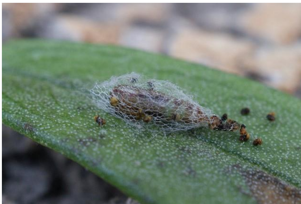
Slika 19. Maslinov moljac