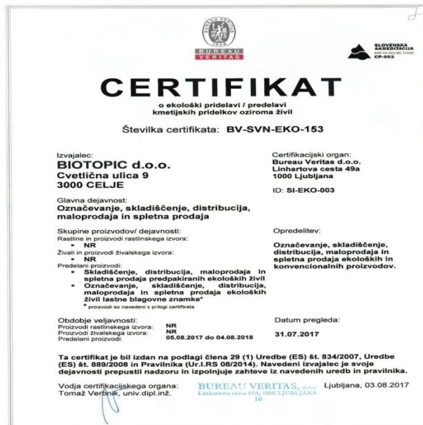
Slika 23. Certifikat