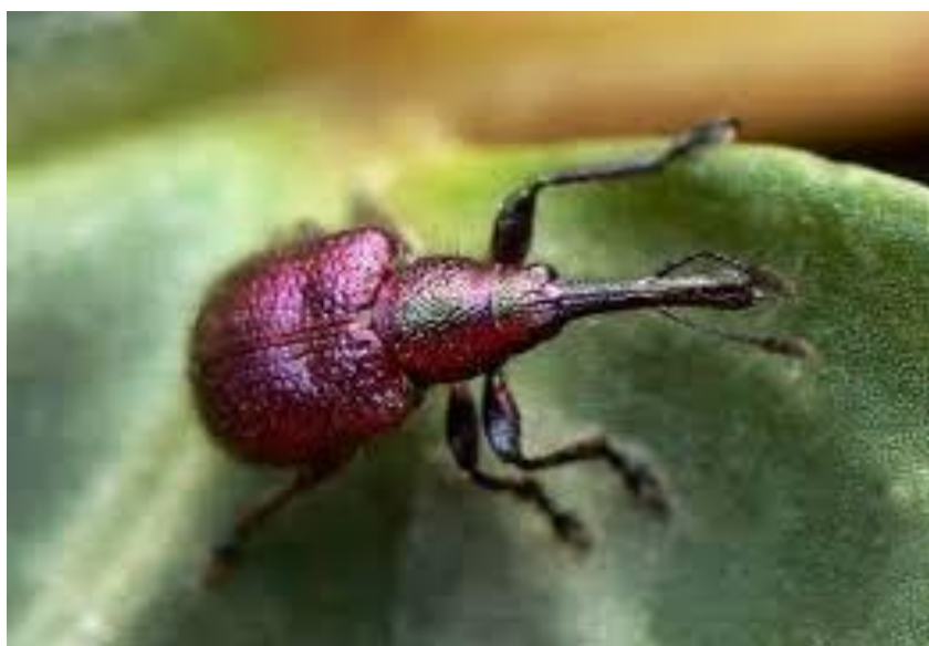
Slika 18. Maslinin svrdlaš

Štete od maslinovog svrdlaša mogu biti i do 80 %. Imago svrdlaša dug je 5-6 mm, crvenkaste boje (slika 18.) , a pojavljuje se tijekom travnja i svibnja (Filipović, 2017.). Nakon napada, na plodu se mogu uočiti duboke rupice i takvi plodovi se najčešće deformiraju i opadaju. Filipović (2017.) u svome radu navodi kako se ličinke kukulje u tlu, dok se neke ličinke kukulje tek iduće jeseni. Ovaj štetnik je češći stanovnik kamenitijih područja.