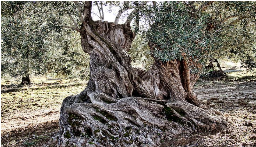
Slika 2. Stablo masline i korijen

Korijen masline razvijen je dublje ili pliće (Kantoci, 2006.). Ovisno o tome je li stablo uzgojeno iz sjemena ili od izboja. Korijenje masline vrlo je razvijeno. Pri nedostatku vode maslina ima sposobnost da sama traži vodu u dubljim slojevima. Njen korijen građen je od glavnog i postranih manjih korijena, te ima i sitnih korijena koji su bliže površini tla (Slika 2.). Glavna je žila provodnica koja se dalje širi tlom koliko je široka i krošnja.