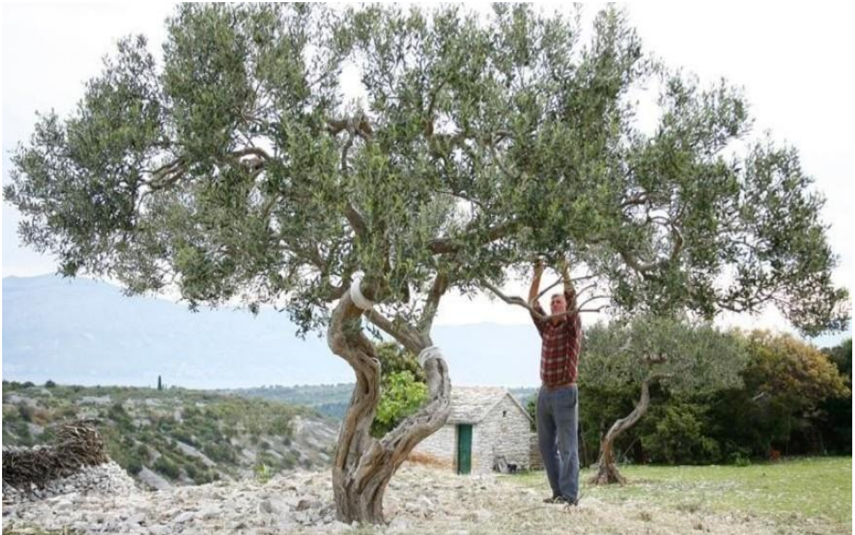
Slika 1. Maslina

Kantoci (2006.) u svome radu navodi kako su prva stabla masline posađena na području Mezopotamije, Sirije i Palestine prije 5 do 6 tisuća godina odakle se proširila mediteranom. Maslinu poslije preuzimaju stari Grci koji ju prenose u svoje pokrajine pa se tako udomaćila i u Italiji. Maslina je simbol postojanosti, mira, mudrosti, čistoće i pobjede (Slika 1.). Maslina je zahvaljujući svome plodu i sastojcima osnova mediteranske prehrane (Žura, 2020). Dio je naše najstarije tradicije i povijesti, poznata je dalmatinska uzrečica kako je maslina kao majka, uvijek spremna na nesebično darivanje (Grković, 2005.). Simbol je mudrosti, čistoće, mira, kulturnog, sredozemnog nasljeđa, hraniteljica i davateljica božanskog eliksira – ulja nad uljima. Jedna je od kultura koja zahtjeva najmanje brige. Upravo je to razlog zašto su ju ljudi najviše uzgajali još u povijesti te ju prenosili. Sada je njezino ulje uvelike cijenjeno ali i skupo.