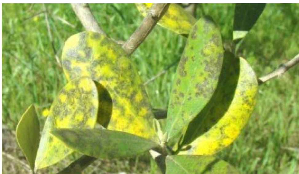
Slika 6. Paunovo oko

Paunovo oko je najpoznatija bolest masline. Karakteristični simptomi su pojava žućenja lišća, uljne pjege po sredini lista (slika 6.). Pjege spajaju i prekrivaju cijeli list. Zaraza na lišću javlja se dva puta godišnje a to je u jesen i u proljeće. Paunovo oko uzrokuje gljivica Spilocaea oleaginum . Nakon napada ove bolesti dolazi do opadanja lista. Gubi se na prinosu. Bolest se javlja na stablima koja su izložena vlažnijim mikroklimatskim uvjetima. Zaraza ovom bolesti na ostalim dijelovima masline je rijetka, ako i napadne takvi plodovi opadaju. Zanimljivo je da ljeti nema zaraze jer ova gljivica miruje ( https://www.agroportal.maslinarstvo.hr/1900 ).