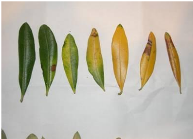
Slika 11. Olovna bolest masline

Sever i sur. (2012.) u svome radu navode kako je ova bolest raširena u svijetu te je kod nas ova bolest od manjeg značaja. Uzročnik ove bolesti je Pseudocercospora cladosporioides . Posljedica jačeg napada je defolijacija lista masline. Promjene mogu nastati na listovima, plodovima i izbojima. U početku razvoja bolesti promjene nisu uočljive na licu lista (Slika 11.). S razvojem bolesti na licu plojke postaju vidljive difuzne, klorotične zone nespecifična oblika koje s vremenom posmeđe i nekrotiziraju. Konidije se šire kapima kiše ili vjetrom, a optimalne temperature za razvoj bolesti su 12-28 °C. Konidije se šire kapima kiše ili vjetrom, a optimalne temperature za razvoj bolesti su 12-28 °C i uz povišenu relativnu vlagu zraka. Izvori bolesti mogu biti dijelovi micelija.