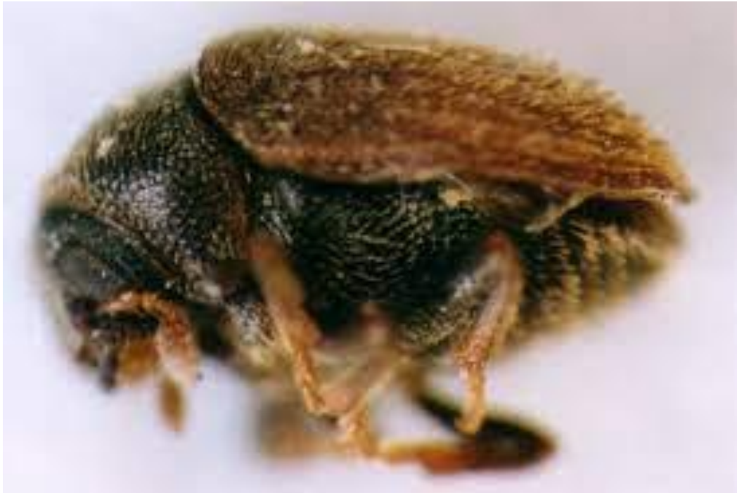
Slika 21. Maslinov smeđi potkornjak

Potkornjak pravi izravne i neizravne štete u maslininoj krošnji. Razvoj ovog štetnika se odvija na peteljci lista i na osnovi mladog izboja te dolazi do njihovog sušenja i opadanja tijekom ljetnog i jesenskog razdoblja.