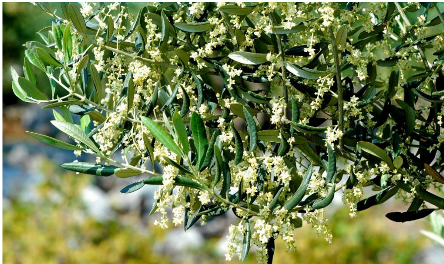
Slika 4. Cvijet masline

Cvjetovi su grozdasti, žućkasto bijeli i ugodnog mirisa (Slika 4.). Zbog velike suše i visokih temperatura kod nas u Dalmaciji dolazi do sušenja cvijeta. A neki od štetnika također smanjuju brojnost cvjetova masline. Cvjetovi su gusto raspoređeni, izgledaju kao kitice na granama masline.