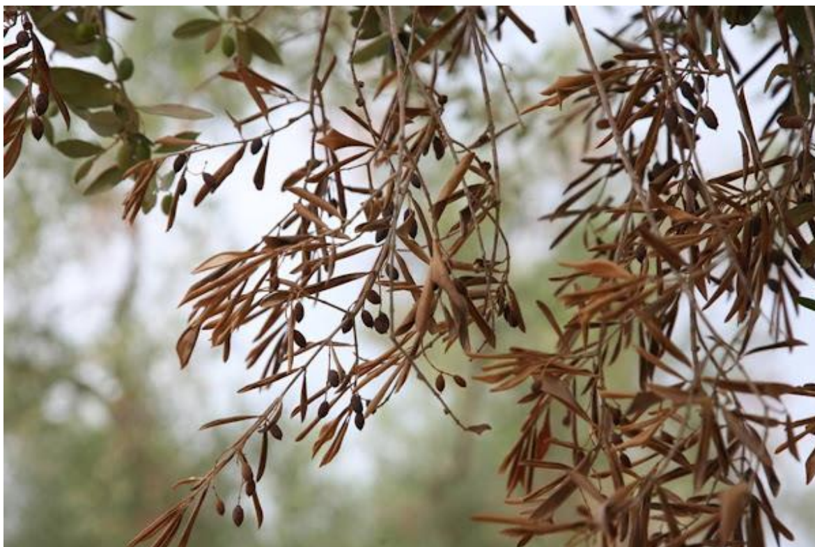
Slika 10. Sušenje ili nekroza izboja masline

Vektori ove bolesti su kukci iz reda Hemiptera podred Homoptera, odnosno vrste Cicadella viridis ( Cicadellidae ) i Philaenus spumarius ( Cercopidae ). Kukci se hrane tako što sišu sokove u ksilemu.