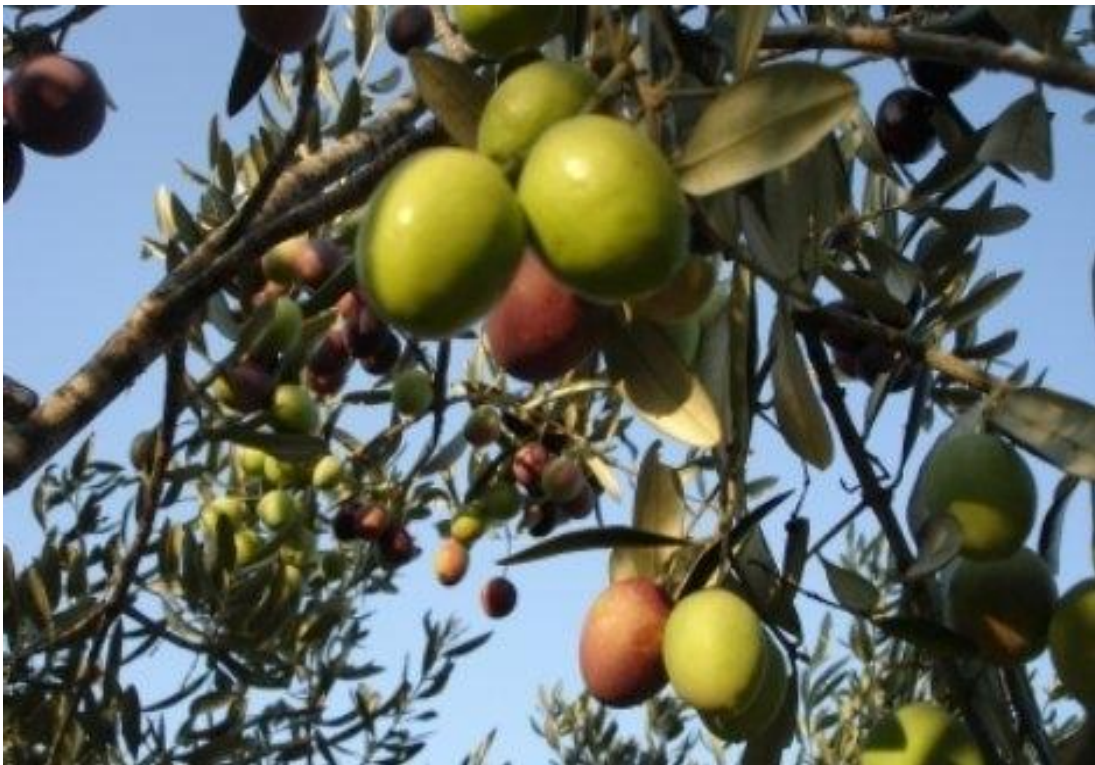
Slika 5. Plod masline

Nakon cvatnje i oplodnje razvija se plod (slika 5.). Oblik i veličina ploda ovisi o sorti masline. Talijanske sorte imaju manje plodove dok su pune ulja, naše autohtone sorte imaju veće plodove a sadrže manje ulja. Oblica ima dosta veliki, okrugli plod, ali s manje ulja. Plod Oblice dosta napadaju štetnici.