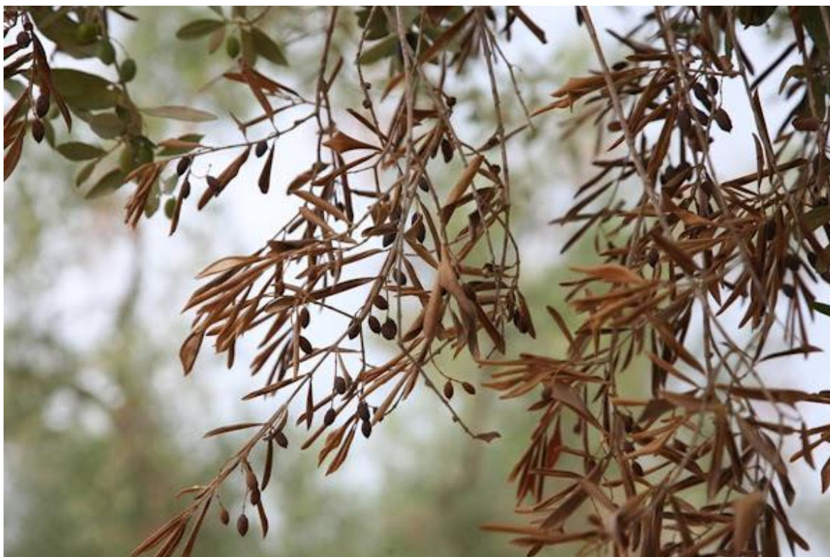
Slika 10. Sušenje ili nekroza izboja masline

Vektori ove bolesti su kukci iz reda Hemiptera podred Homoptera, odnosno vrste Cicadella viridis ( Cicadellidae ) i Philaenus spumarius ( Cercopidae ). Kukci se hrane tako što sišu sokove u ksilemu.