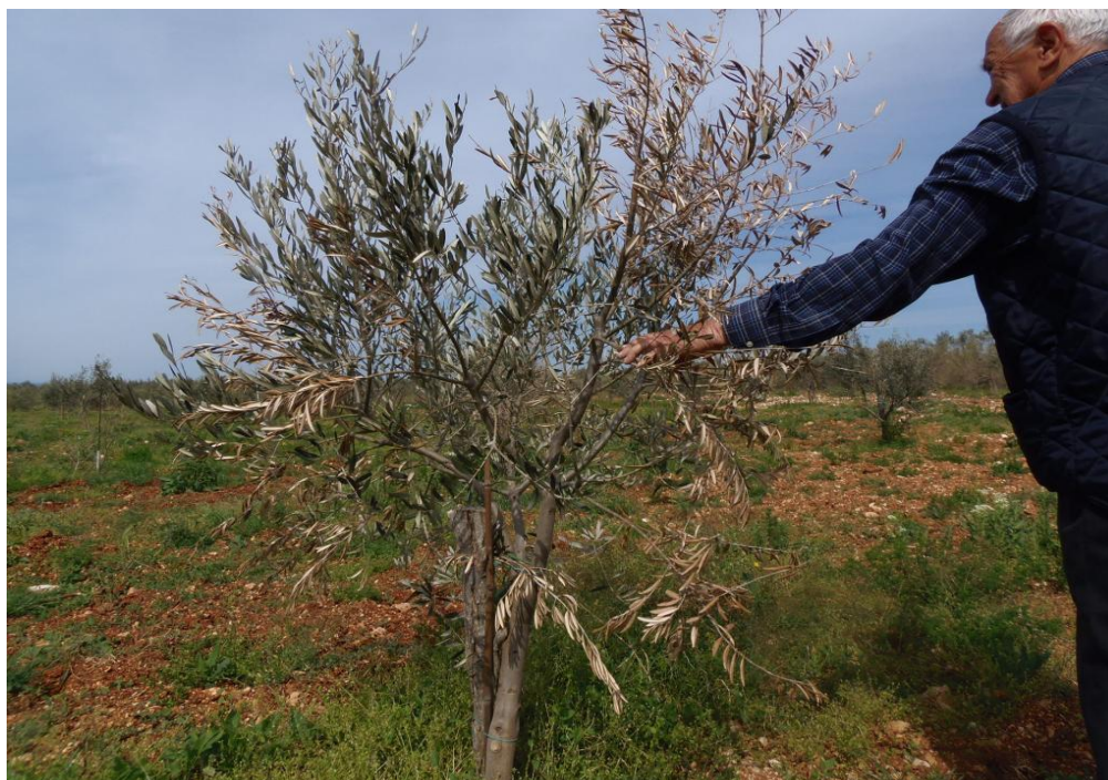
Slika 13. Djelomično ili potpuno sušenje stabala masline

novih bolesti od kojih su neke još uvijek nepoznate iskusnim maslinarima. Jedna od njih je i sušenje masline ili verticilijsko venuće ( Verticillium dahliae ), antraknoza ( Colletotrichum spp.) ili gljivični rak koji je uzrokovan vrstama iz porodice Botryosphaeriaceae u RH su to nove vrste i predmet su znanstvenih istraživanja.