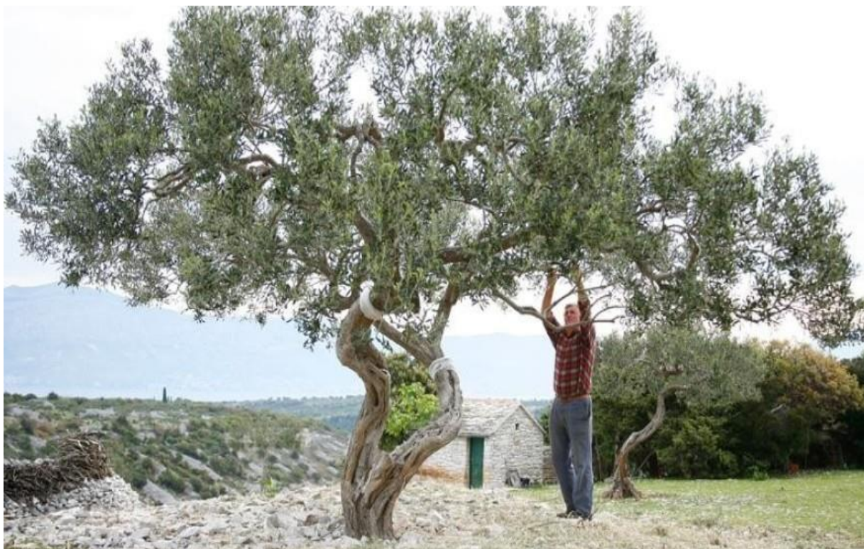
Slika 1. Maslina

Kantoci (2006.) u svome radu navodi kako su prva stabla masline posađena na području Mezopotamije, Sirije i Palestine prije 5 do 6 tisuća godina odakle se proširila mediteranom. Maslinu poslije preuzimaju stari Grci koji ju prenose u svoje pokrajine pa se tako udomaćila i u Italiji. Maslina je simbol postojanosti, mira, mudrosti, čistoće i pobjede (Slika 1.). Maslina je zahvaljujući svome plodu i sastojcima osnova mediteranske prehrane (Žura, 2020). Dio je naše najstarije tradicije i povijesti, poznata je dalmatinska uzrečica kako je maslina kao majka, uvijek spremna na nesebično darivanje (Grković, 2005.). Simbol je mudrosti, čistoće, mira, kulturnog, sredozemnog nasljeđa, hraniteljica i davateljica božanskog eliksira – ulja nad uljima. Jedna je od kultura koja zahtjeva najmanje brige. Upravo je to razlog zašto su ju ljudi najviše uzgajali još u povijesti te ju prenosili. Sada je njezino ulje uvelike cijenjeno ali i skupo.