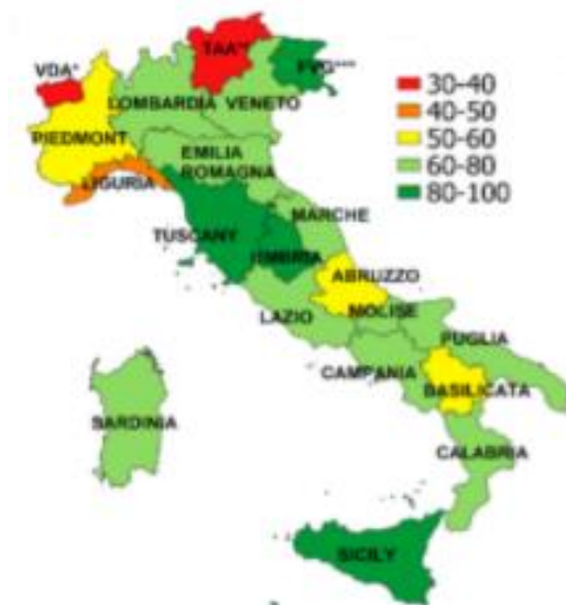
Slika 8. Prikaz klasifikacije mehaniziranosti talijanskih regija

parametrima bili su vrlo niski (između 3,8 \times 10^{-5} i 0,14), isključujući tako korelaciju parametara.