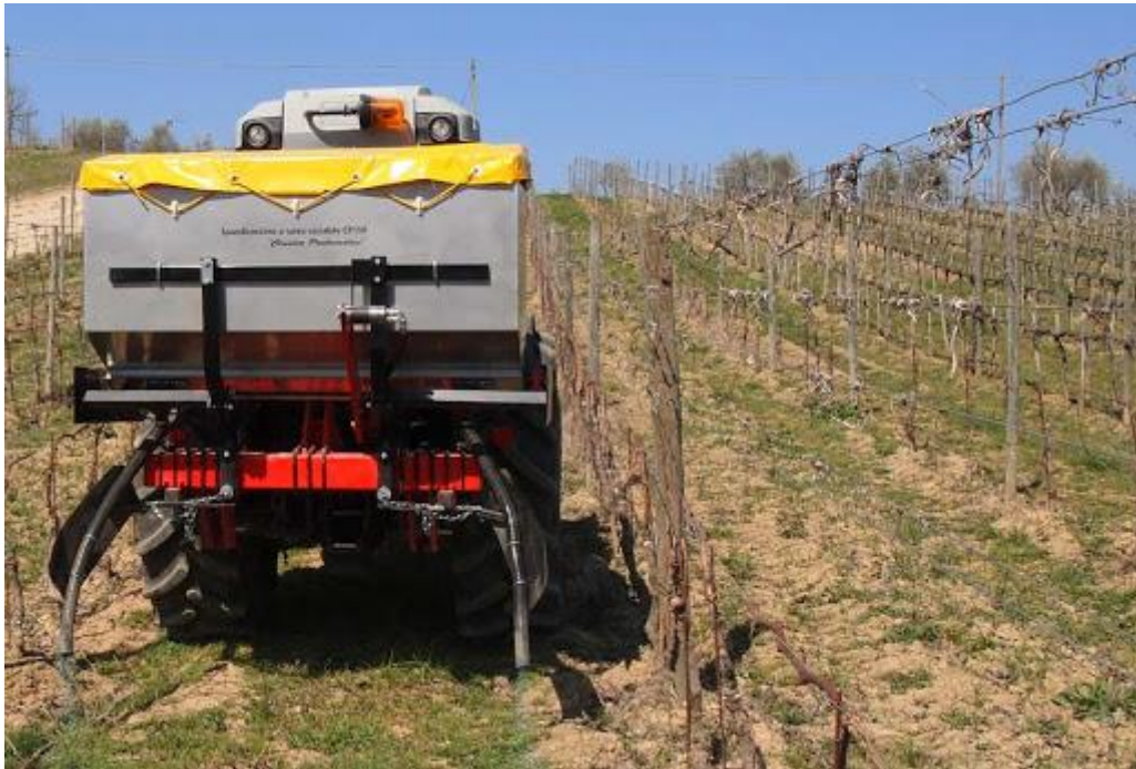
Slika 7. Gnojidba s promjenjivom stopom u vinogradu

služi za rezanje viška dušika i fosfata koji doprinose smanjenoj biološkoj raznolikosti u mnogim zemljama. Koristeći sustav za otkrivanje i mapiranje tla, koji je spojen na stražnju stranu traktora, uzimaju se uzorci tla na dvije različite dubine svakih deset metara. Skener automatski određuje varijacije u tlu i registrira karakteristike kao što su kiselost i sadržaj organske tvari. Previše kiselosti u tlu nepovoljno će utjecati na njegovu strukturu i korijenov sustav, glina se razvija u debele neprobijne ploče (Knowledge4food portal znanja (2015.)).