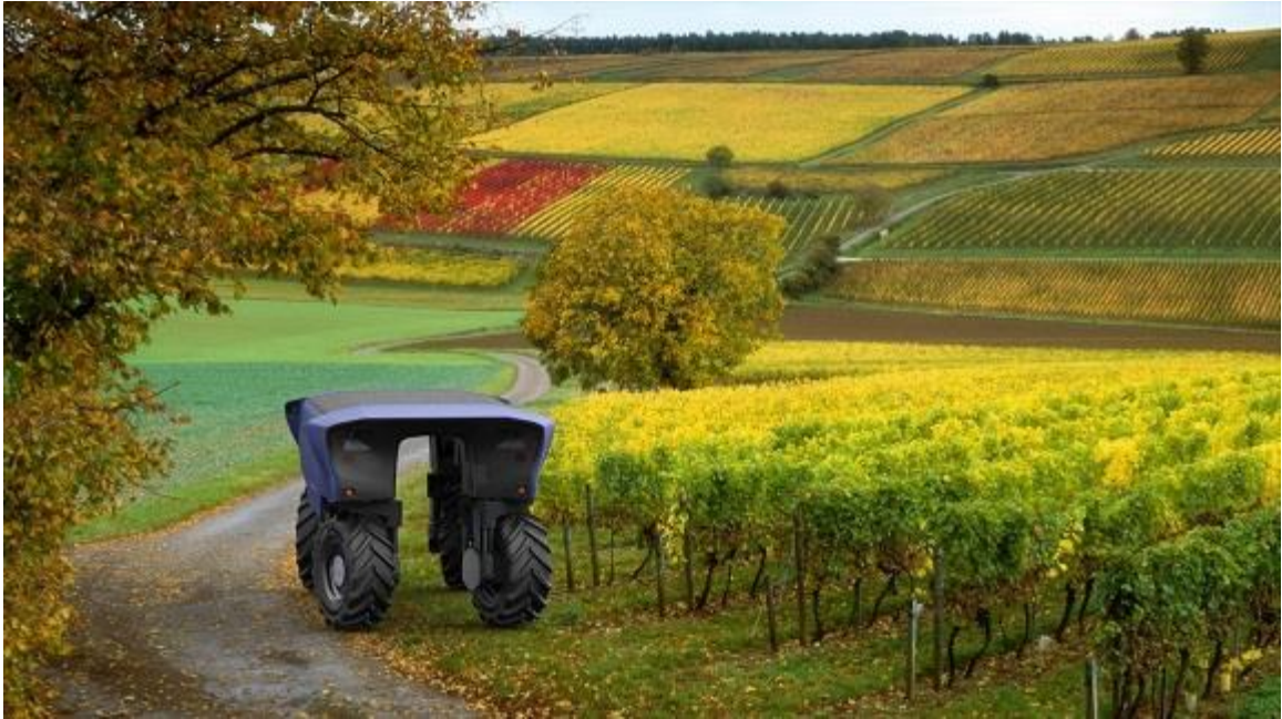
Slika 6. Prikaz robota za prorjeđivanje vinove loze

Prototip je još uvijek u eksperimentalnoj fazi. U razvoju je robotska ruka namijenjena berbi grožđa koja koristi umjetnu inteligenciju za vođenje robota u nizu operacija, kao što su lokalizacija, procjena stanja sazrijevanja te odabir i odvajanje grožđa od loze (Matese i Di Gennaro, 2015.).