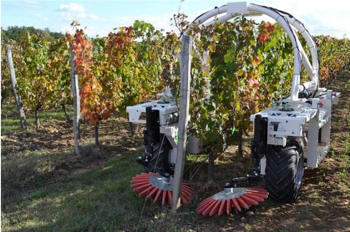
Slika 5. Robot za mehaničko uništavanje korova

Za precizniji rad između vinove loze odabrana je struktura koja obuhvaća red vinove loze. Ova je konfiguracija povoljnija za pozicioniranje alata, ali je stroža u smislu strojarstva. Vuča je električna, svaki kotač pokreće i upravlja, što omogućava više načina rada za manevriranje ili poravnanje. Navođenje robota u potpunosti je posvećeno RTK GPS-u, koji zasigurno omogućuje precizno pozicioniranje, ali se još ne oslanja na otkrivanje strukture vinograda. To bi se trebalo promijeniti u budućim mjesecima s integracijom novih senzora. Blagodati robota nadilaze jednostavnu potragu za konkurentnošću, jer raste zabrinutost zbog izloženosti vinogradara pesticidima i drugim potencijalnim opasnostima (Canopy vinski portal, 2019.).