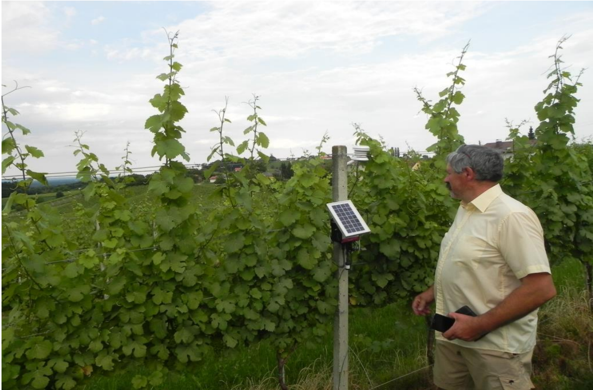
Slika 2. Bežični čvor senzora u vinogradu koji nadgleda mikroklimu vinove loze

Važan aspekt proizvodnje vrhunskih vina su grožđe bez bolesti i zdrava loza, bez štetnika. Ako vinogradar ima informacije o vinogradarskoj mikroklimi, poput temperature, vlage, vlažnosti lišća itd., tada može djelovati na vrijeme i zaštititi vinovu lozu od štetnika. Korištenjem sustava za podršku odlukama za upravljanje bolestima - koji može obraditi podatke o okolišu, zajedno s karakteristikama vinograda i prošlim aktivnostima vinogradara - vinogradari unaprijed dobivaju upozorenje o mogućoj opasnosti od štetnika na određenom vinogradarskom području, zajedno sa savjetima o tome kako postupati u takvim situacijama. Uz to, razvijeni su VRT (engl. variable rate technology - tehnologija s promjenjivom brzinom) za distribuciju pesticida s promjenjivom brzinom - prilagođavanje osnovice brzine prskanja veličini i gustoći vinograda, na temelju propisanih karata i podataka o geolokaciji (eVineyard, 2020.). Općenito, aplikatorima s promjenjivom brzinom koji se temelje na karti bit će potrebno više komponenti od aplikatora na bazi senzora, međutim, to je nadoknađeno činjenicom da se ove komponente mogu koristiti za više ulaza. Hardver i senzori koji omogućuju automatsku primjenu s promjenjivom brzinom uključuju regulator, mikroprocesor, aktuator, osjetnike tlaka, senzore protoka, osjetnike brzine i tehnologiju diferencijalnog globalnog sustava pozicioniranja (DGPS) (Apex Publishers (2021.)).