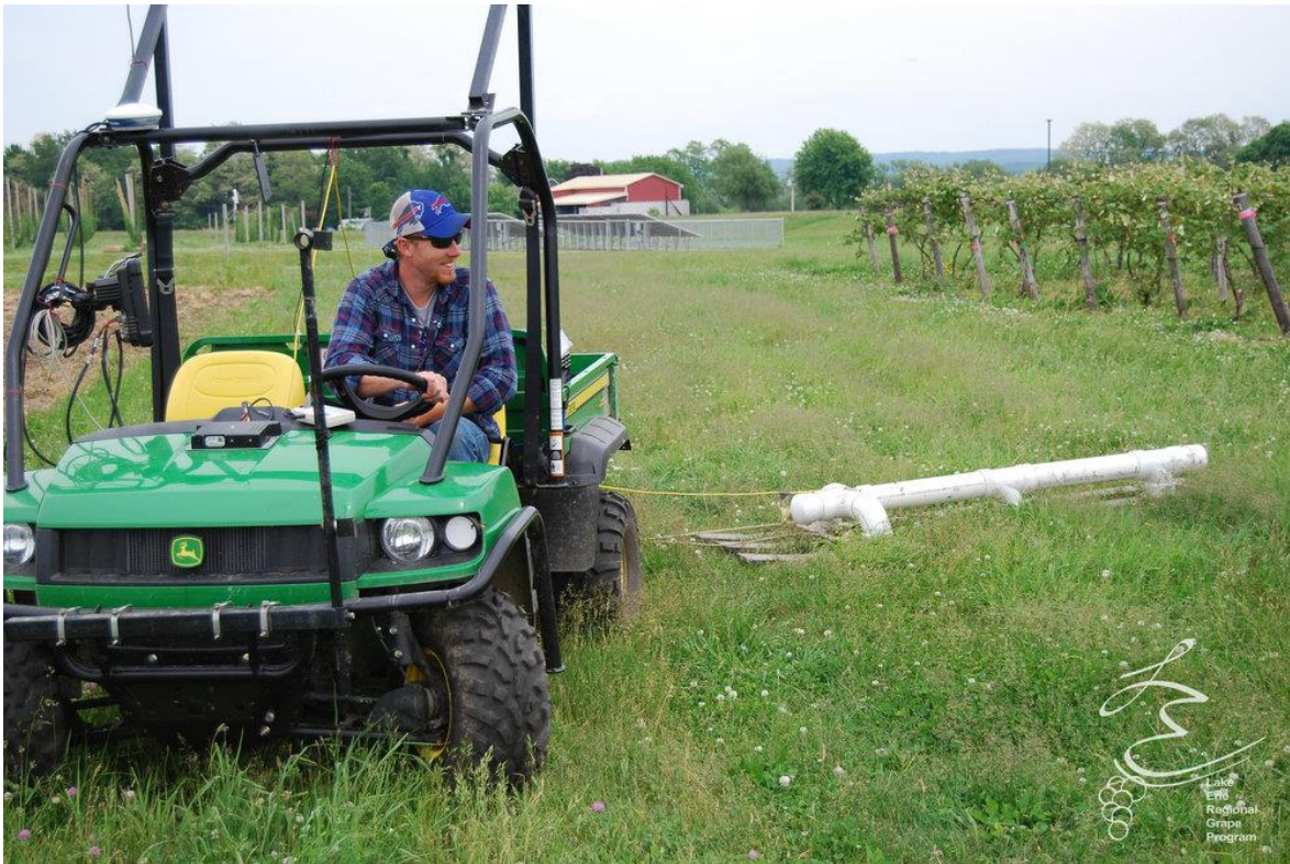
Slika 3. Senzor tla mjeri električnu vodljivost u vinogradu kako bi pružio kartu karakteristika tla

Senzori koji se koriste za ovu vrstu mjerenja su ili invazivni električni otpor ili neinvazivni elektromagnetski indukcijski senzori. Prvi tip (električni otpor) koristi se za kontrolu otpora, a time i vodljivosti, određenog volumena tla, generirajući električne struje i nakon toga mjereći razlike potencijala. Princip rada senzora za elektromagnetsku indukciju uključuje stvaranje magnetskog polja koje inducira električnu struju u tlu, što zauzvrat stvara drugo magnetsko polje razmjerno vodljivosti tla koju mjeri senzor. Postoje i novorazvijeni senzori za aplikacije mobilnih platformi, za mjerenje pH, ionskog sadržaja dušika i kalija, za mjerenje u blisko infracrvenom i srednjem infracrvenom spektru, radaru koji prodire u tlo i radiometrima (Matese i Di Gennaro, 2015.).