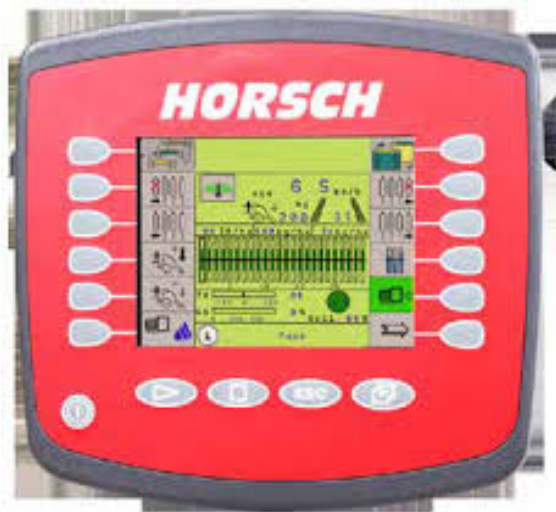
Slika 8. DrillManager