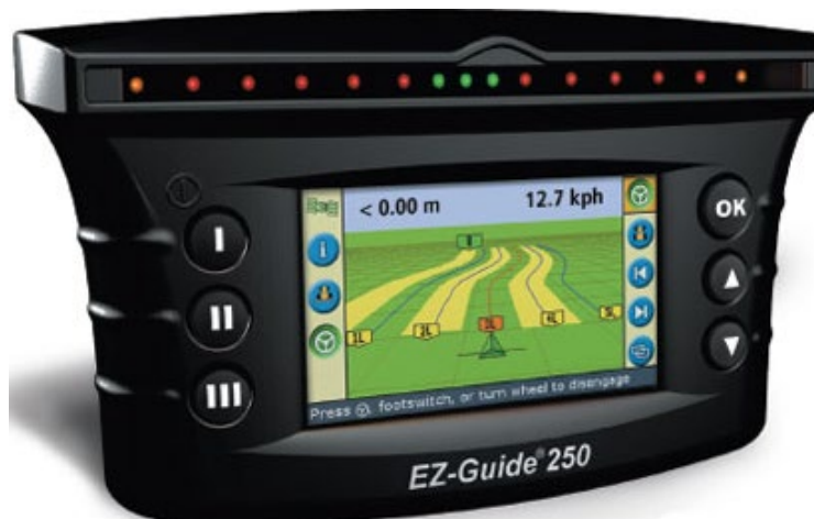
Slika 6. Ez-Guide 250 navigator