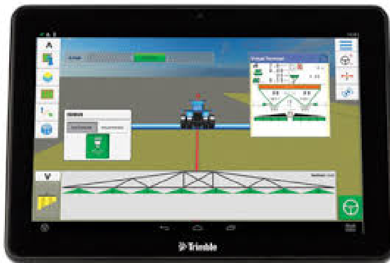
Slika 7. TMX-2050 navigator