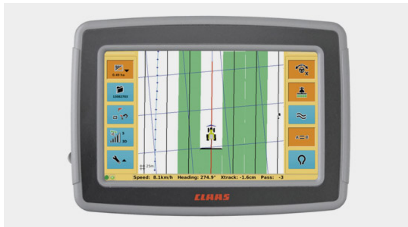
Slika 11. Terminal S10 (Jerković d.o.o.)

Korist programa navedenih u radu poput ovog je da nema preklapajućih ili neobrađenih područja , ušteda troškova, uređaj nam sam govori što treba uključiti ili isključiti. Uređaj nam nudi i automatsko okretanje na uvratinama u jednom potezu te ga precizno vode u sljedeći prolazak, što nam omogućava zaštitu tla i minimaliziranu štetu na usjevima prilikom postavljanja u redove usejva. Radno opterećenje vozača je smanjeno, što mu omogućuje koncentraciju na funkcije stroja.