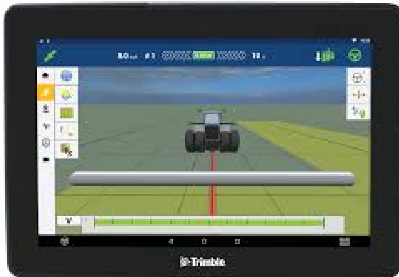
Slika 5. GNSS navigator