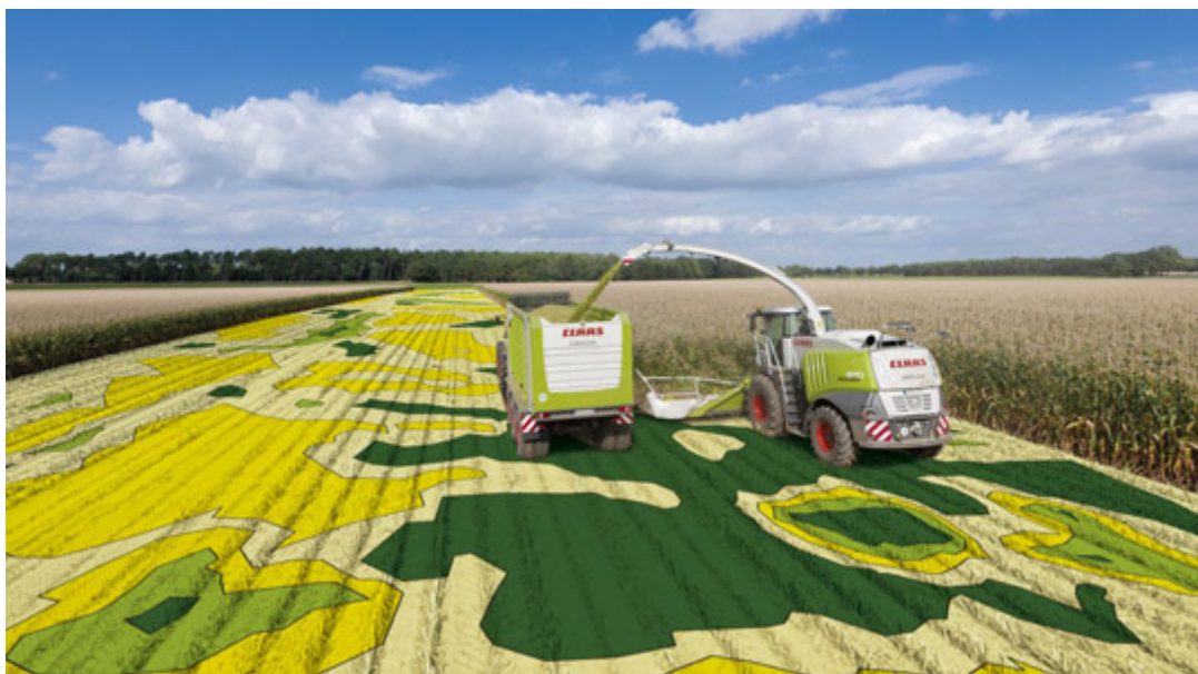
Slika 13 . Class kartiranje (Jerković d.o.o.)