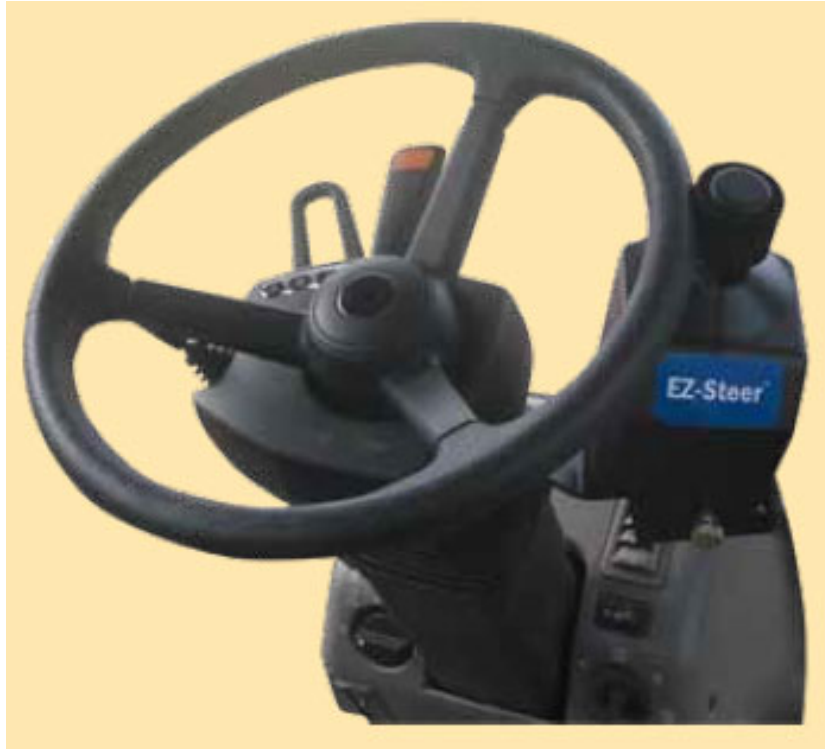
Slika 3. EZ-Steer