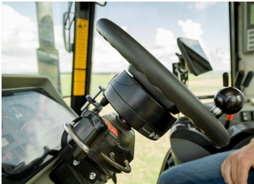
Slika 2. Autopilot sustav