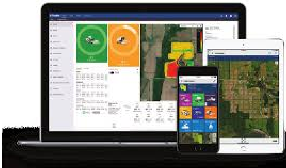
Slika 1. Ag App navigacija