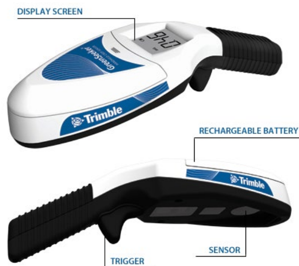
Slika 4. GreenSeeker

Koristite Connected Farm scout aplikaciju na smart telefonu ili tablet računalu, za brzo izračunavanje potrebne količine gnojiva, na osnovu očitanih vrijednosti s GreenSeeker ručnim senzorom stanja usjeva. ( Trimble Agriculture Portfolio )