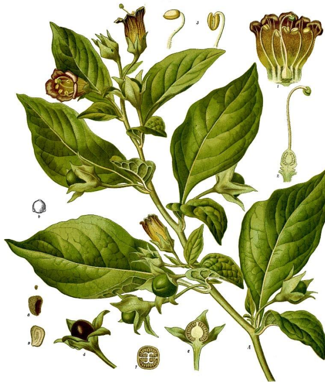
Slika 10. Shematski prikaz biljnih dijelova velebilja