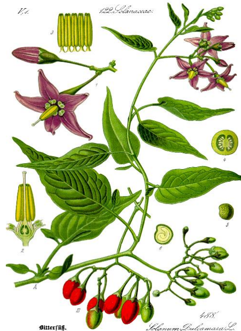
Slika 5. Shematski prikaz biljnih dijelova gorkoslada

Sjemenka je bubrežasta, na površini mrežasto naboran, oko 3 mm široka (Franjić i Škvorc, 2014.). Bobe ne dozrijevaju u isto vrijeme te se na biljci u isto vrijeme mogu vidjeti i nedozrele i zrele bobe (Slika 5.). Dozrijevaju u razdoblju od srpnja do rujna. Razmnožava se sjemenom i vegetativno reznicama ljeti.