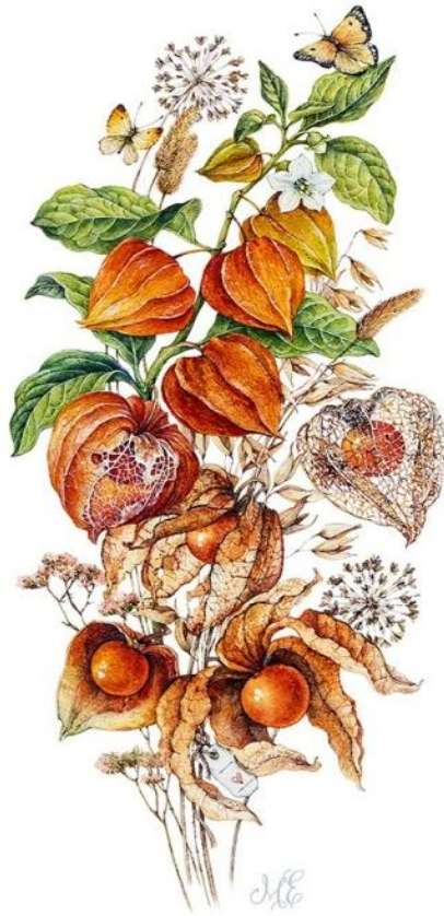
Slika 7. Shematski prikaz biljnih dijelova peruanske jagode