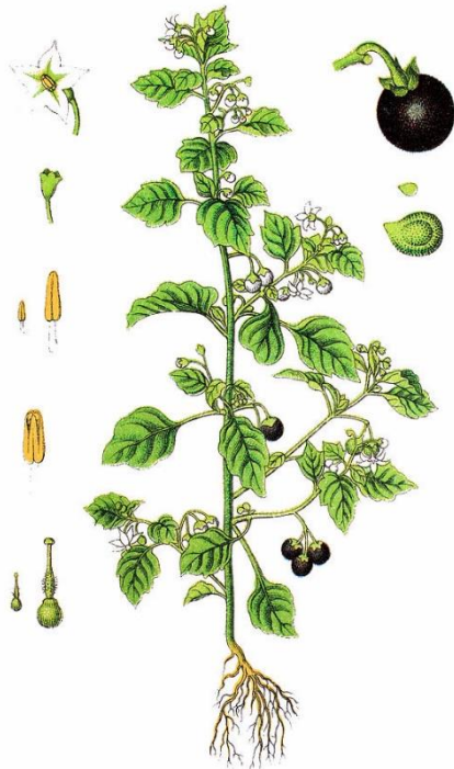
Slika 4. Shematski prikaz biljnih dijelova crne pomoćnice