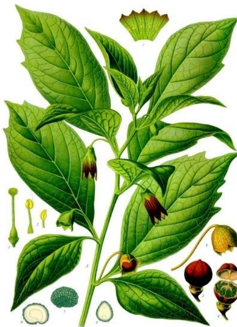
Slika 1. Shematski prikaz biljnih dijelova bijelog buna