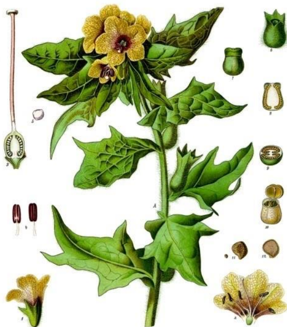
Slika 3. Shematski prikaz biljnih dijelova crne bunike