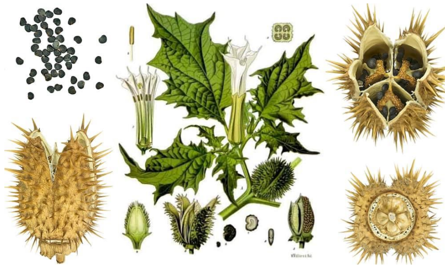
Slika 2. Shematski prikaz biljnih dijelova bijelog kužnjaka