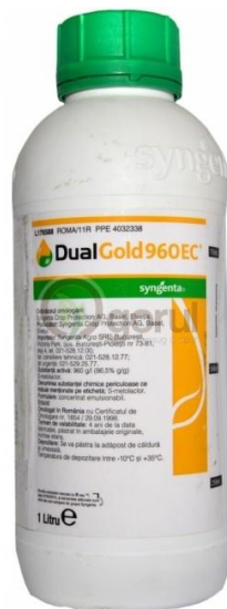
Slika 11. Dual Gold 960 EC herbicid