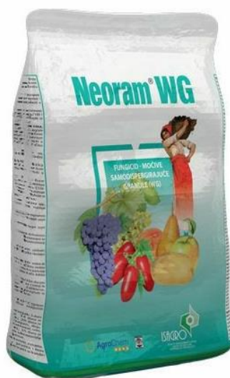
Slika 12. Fungicid Neoram WG

Fungicid (Slika 12.) se primjenjuje u slučaju jačeg napada plamenjače (Pospišil, 2010.)