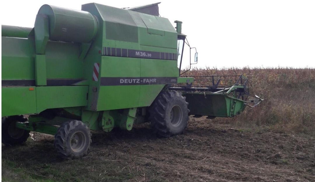
Slika 13. Kombajn Deutz Fahr M36.30

Žetvi soje treba posvetiti punu pažnju. Vrijeme žetve ovisi o duljini vegetacije soje, ali najčešće se obavlja u drugoj polovici rujna. Početak žetve treba planirati kad je vlaga zrna 14-16 %, a za čuvanje soje bez sušenja vlaga mora biti 13 % (Pospišil, 2010.). Žetva se obavlja kad je sjeme u gornjim mahunama u punoj zrelosti. Obavlja se žitnim kombajnom (Slika 13.). Brzina kretanja kombajna iznosi do 5 km/sat, a broj okretaja bubnja od 600-800/min. Prinosi soje na plodnim tlima uz pravilnu agrotehniku mogu biti i do 4,5 t/ha, a najčešće su 2,5-3,5 t/ha.