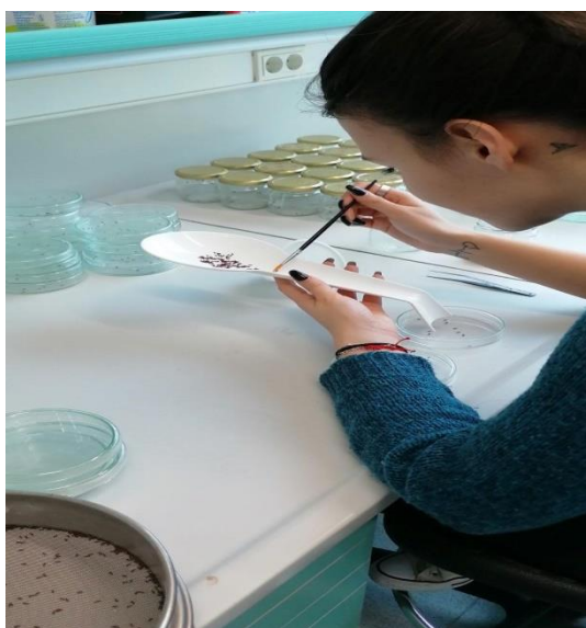
Slika 11. Brojanje odraslih jedinki R. dominica

Korištena je vrsta žitni kukuljičar ( Rhyzopertha dominica Fab.), koja po načinu ishrane pripada primarnim vrstama skladišnih kukaca. Kukci su uzgajani u kontroliranim uvjetima na temperaturi od 24-27 °C i rvz 70±5%, na uzgojnoj podlozi od zrna meke pšenice. Za testiranje i utvrđivanje insekticidne djelotvornosti testirane formulacije NanoS korištene su odrasle jedinke kukaca starosti 2-4 tjedna (slika 11.).