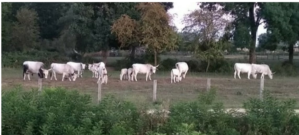
Slika 1. Stado slavonsko srijemskog podolca na OPG – u Glavačević

Zaštita ex situ podrazumijeva komponente biološke raznolikosti izvan njihovih prirodnih staništa. Ovakav je način zaštite izuzetno važan za vrlo rijetke i ugrožene vrste kojima prijeti izumiranje i zbog toga je potrebno sačuvati njih ili njihove gene te ih razmnožiti u svrhu očuvanja.