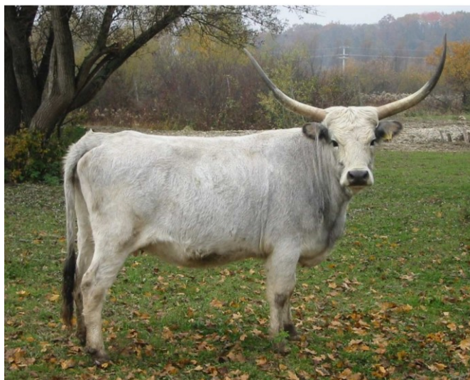
Slika 6. krava s rogovima u obliku lire