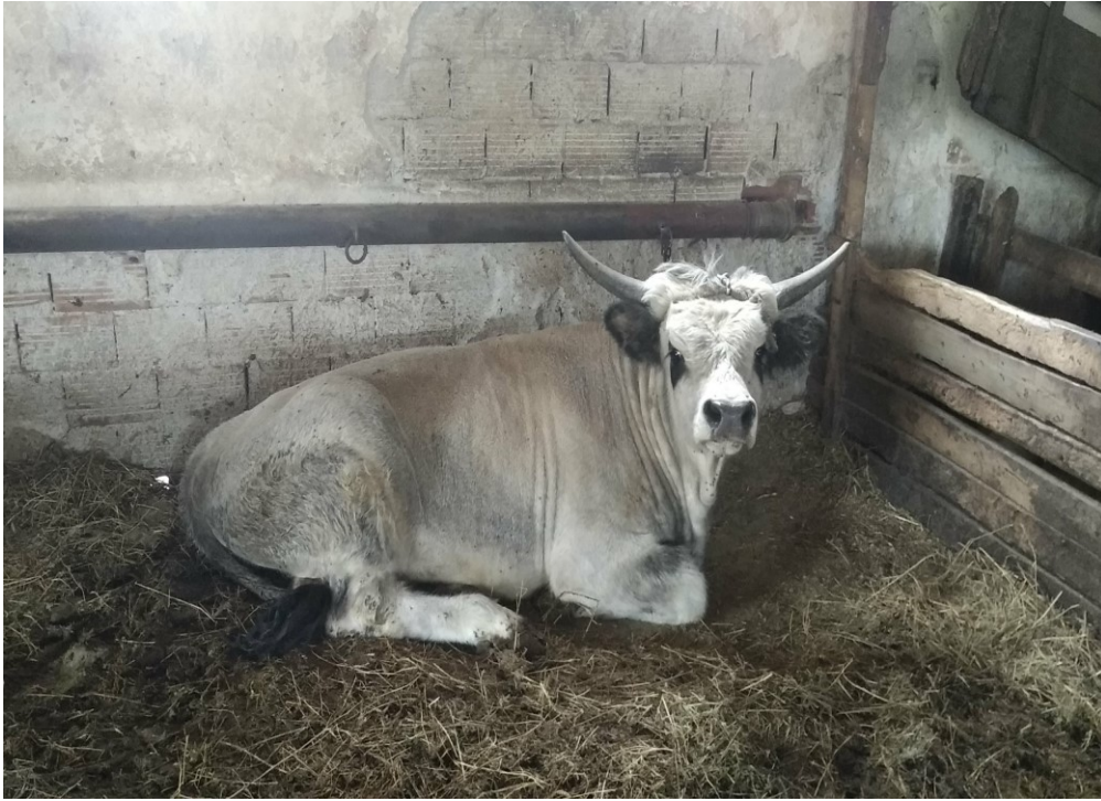
Slika 10. Slavonsko srijemski podolac na Opg- u Glavačević