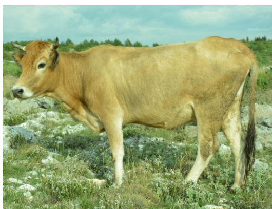
Slika 2. Buša

Životni vijek im je oko 20 godina. Mlijeko dobre kakvoće (4 – 6 % mliječne masti ). Mužnost je oko 1000 litara mlijeka što je rezultat slabe hranidbe, ali u boljim uvjetima bi bilo puno veće. Otporna na bolesti.