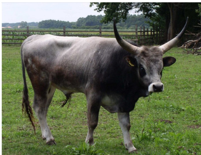
Slika 4. Bik slavonsko srijemskog podolca