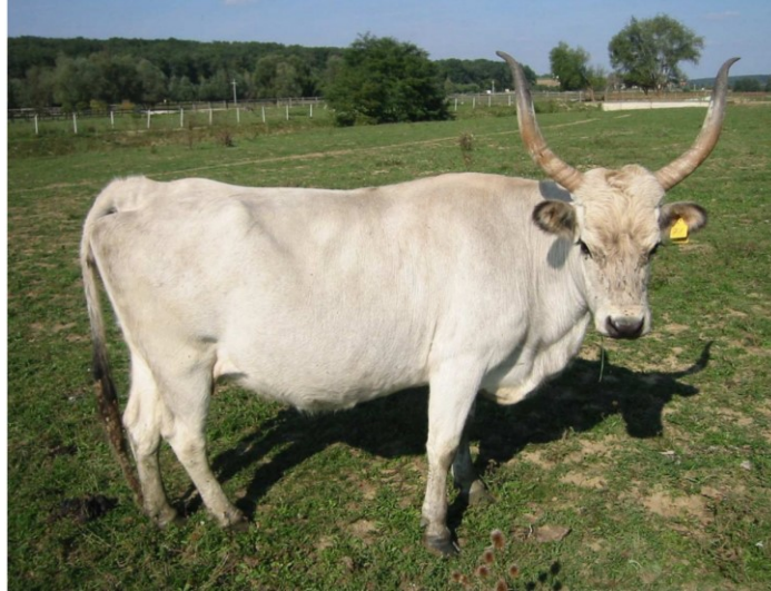
Slika 5. krava s rogovima u obliku vila