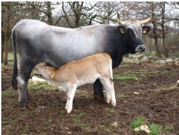
Slika 3. istarsko govedo

Kasnozrele pasmine. Glava im je srednje duga, klinasta, širokog čela. Sužava se prema gubici. Veliki rogovi u obliku lire. Rogovi mogu biti dugi do 1,5 m s opsegom rogova 30 cm. Krave su visoke oko 138 cm, dužina tijela im je oko 155 cm, a bikovi su prosječno visoki oko 155 cm, a mogu dosegnuti i do 170 cm. Prosječna težina je između 1000 i 1200 kg, a može čak dosegnuti i 1400 kg. Prsa duboka, uža i duga. Grube su konstitucije i snažne građe. Noge snažne, pravilnog stava, korektno građene. Boja je svijetlosiva do bijela s prijelazima u tamnije nijanse. Bikovi su obično tamniji od krava. Krave su svijetlosive do bijele boje, imaju prijelaze u tamnije nijanse.