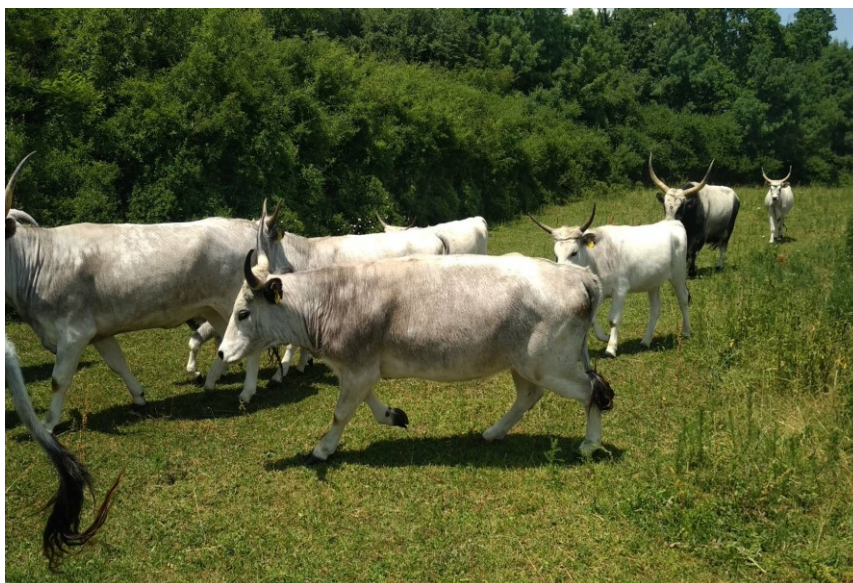
Slika 9. Stado na OPG-u Glavačević