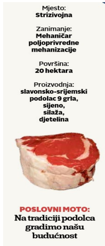
Slika 8. Meso slavonsko srijemskog podolca