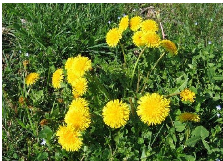
Slika 1. Maslačak ( Taraxacum officinale )