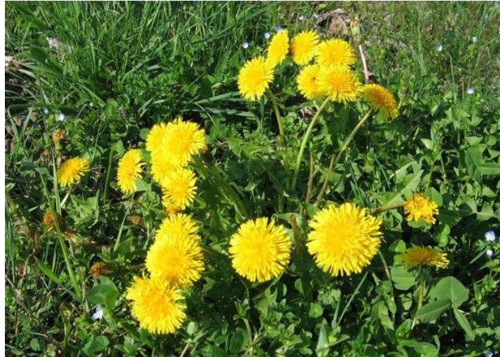
Slika 1. Maslačak ( Taraxacum officinale )