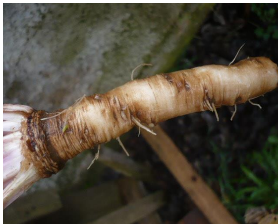
Slika 2. Izgled korijena maslačka

u prizemnu rozetu koji su prilegli uz tlo (Slika 2.), a tek se u kasnijem razvoju uspravljaju (Omeragić i Hadžiabdić, 2017).