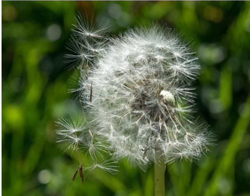
Slika 4. Plod maslačka