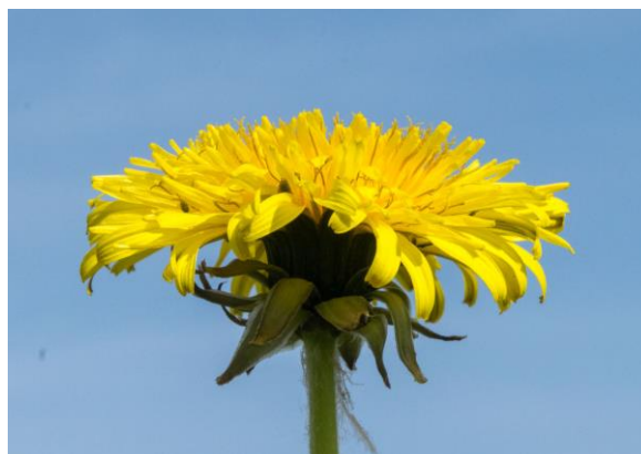
Slika 3. Cvijet maslačka

Listovi mogu biti promjenjivog oblika s glatkim ili pilasto nazubljenim rubovima. Zeljasta, šuplja stabljika je bez listova, visoka 15-25 cm, nosi po jednu žutu cvjetnu glavicu koja se noću te za vrijeme oblačnog i kišnog vremena zatvara. Cvjeta na proljeće, ponekad sve do listopada. Cvjetovi su dvospolni, jezičasti, zlatnožute boje, skupljeni u glavice promjera 3-5- cm (Slika 3.). Nakon cvjetanja glavica cvijet se pretvori u prepoznatljive loptice. Riječ je o plodu roška sa jednom sjemenkom papusom uz pomoć kojeg se ovi plodovi rasprostranjuju vjetrom (Slika 4. i Slika 5.). U jednoj sezoni jedna biljka maslačka proizvede 3000 – 8000 sjemenki koje zadržavaju sposobnost klijanja i nakon 600 godina. Svi dijelovi ove biljke sadrže mliječni sok gorkog okusa (Erhatic i sur., 2014.; Omeragić i Hadžiabdić, 2017.; Tabasum i sur., 2018.).