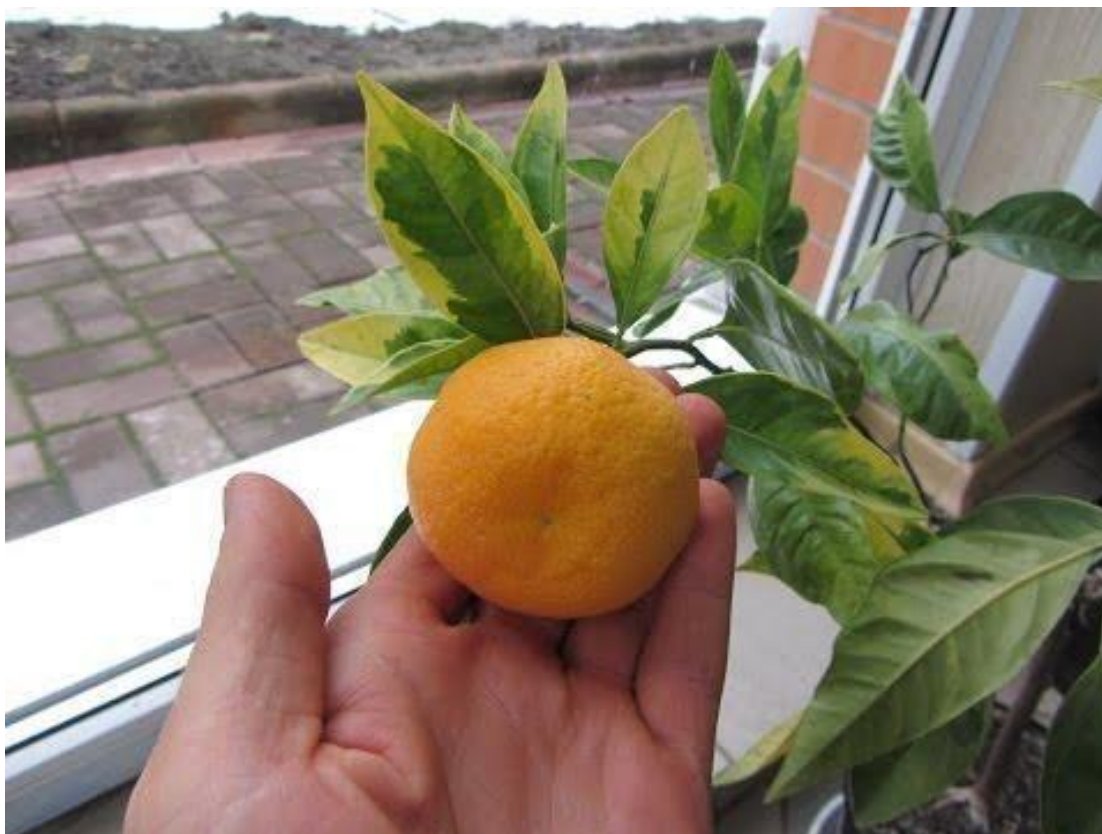
Slika 1. Unshui mandarina

Mandarina je biljka koja potječe iz porodice Rutaceae, a pripada rodu Citrusa ili ti Agruma čije biljke potječu iz tropskih krajeva jugoistočne Azije. Biljke iz roda citrusa su mala zimzelena grmolika stabla visine 5 - 15 metara Mediteranske klime. Biljke su osjetljive na hladnoću, te uvenu kad temperature padnu ispod 0 ° C zbog čega uzgajivači moraju voditi posebnu brigu da zaštite stapla od hladnoće. Agrumi počinju nositi plodove 3-5 godina nakon sadnje, a puna ekonomičnost se steče tek nakon 8 - 10 godina. Od cvatnje do berbe prođe 5 - 6 mjeseci ovisno o sredini gdje raste. Cvjetovi su jednostruki ili u oblika cvata, promjera 2 - 4 cm sa 5 bijelih latica i brojnim prašnicima, vrlo intenzivnog su mirisa zbog flavonoida i limonoida. Plovidi citrusa dugi su od 4 - 30 cm, promjera od 4 - 20 cm, te su bogati hesperidinom koji pozitivno djeluje na ljude kao antioksidans, imaju puno limunske kiselina sa velikom količinom vitamina C pa se od davnih vremena koriste kao lijek.