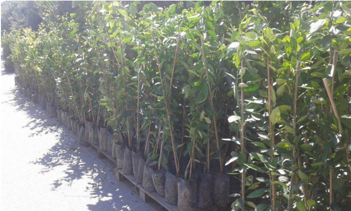
Slika 2. Sadnice mandarina

područjima mogu se saditi početkom jeseni, nakon prvih velikih kiša, a na hladnim i vjetrovitim područjima preporučuje se proljetna sadnja utvrdio je Krpina (2004.)