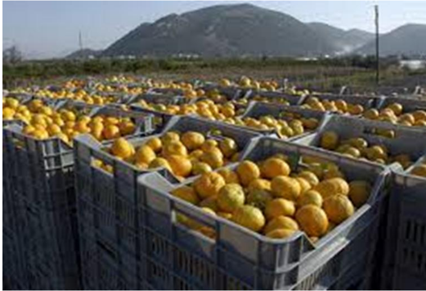
Slika 7. Urodi mandarina u Dolini Neretve