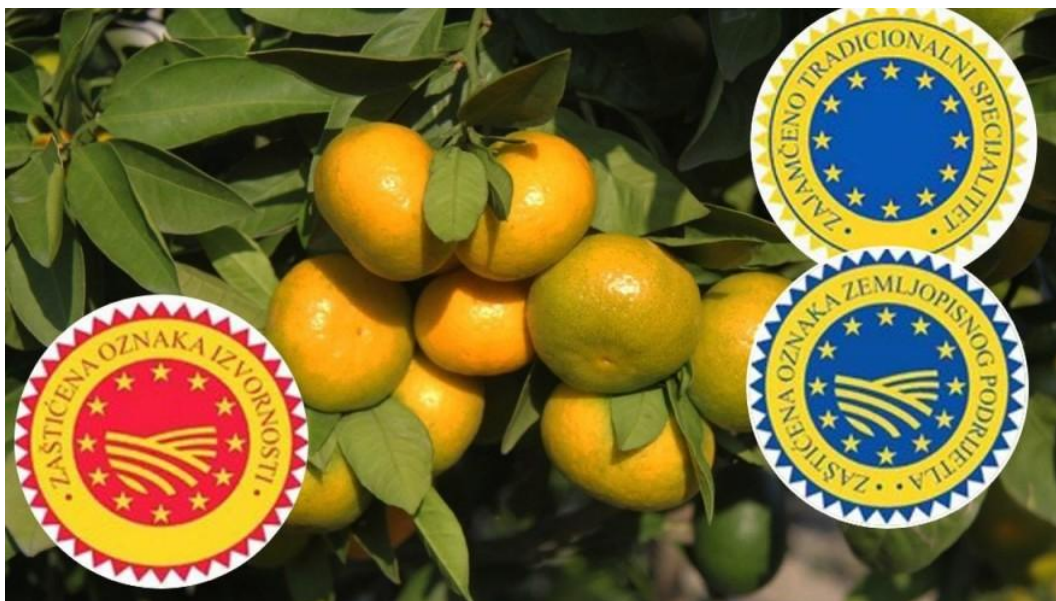
Slika 8. Oznake izvornosti i zemljopisnog podrijekla