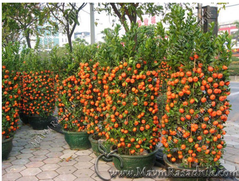
Slika 3. Stablo mandarine

Mandarina ima tendenciju stvaranja krošnje (Slika 3.) u obliku vaze, pa je zato lako oblikovati upravo takav uzgojni oblik. U tom cilju može se već u rasadniku ili nakon sadnje intervenirati orezivanjem na željenu visinu. Uglavnom orezujemo na visinu od 40 do 60 cm, na onome dijelu gdje je sadnica dovoljno zrela. Iz gornjih pupova se razvija nekoliko podstranih izboja, od kojih se dobiju tri do četiri pravilno raspoređena izboja, ostale izboje treba odstraniti. Da bi izboji dobili pravilan kut grananja, potrebno ih je usmjeriti, što se može učiniti pomoću trstike ili posebnih šablona specijalno napravljenih za tu svrhu. Kad primarne skeletne grane dostignu dužinu 30 do 40 cm i kad su na toj dužini zrele, prikraćuju se da bi se tijekom vegetacije iz njih dobili novi izboji koji predstavljaju sekundarne grane. Prikraćivanjem sekundarnih grana na istu dužinu dobivaju se grane trećeg reda, a njihovim prikraćivanjem dobijemo grane četvrtog reda utvrdio Krpina (2004.).