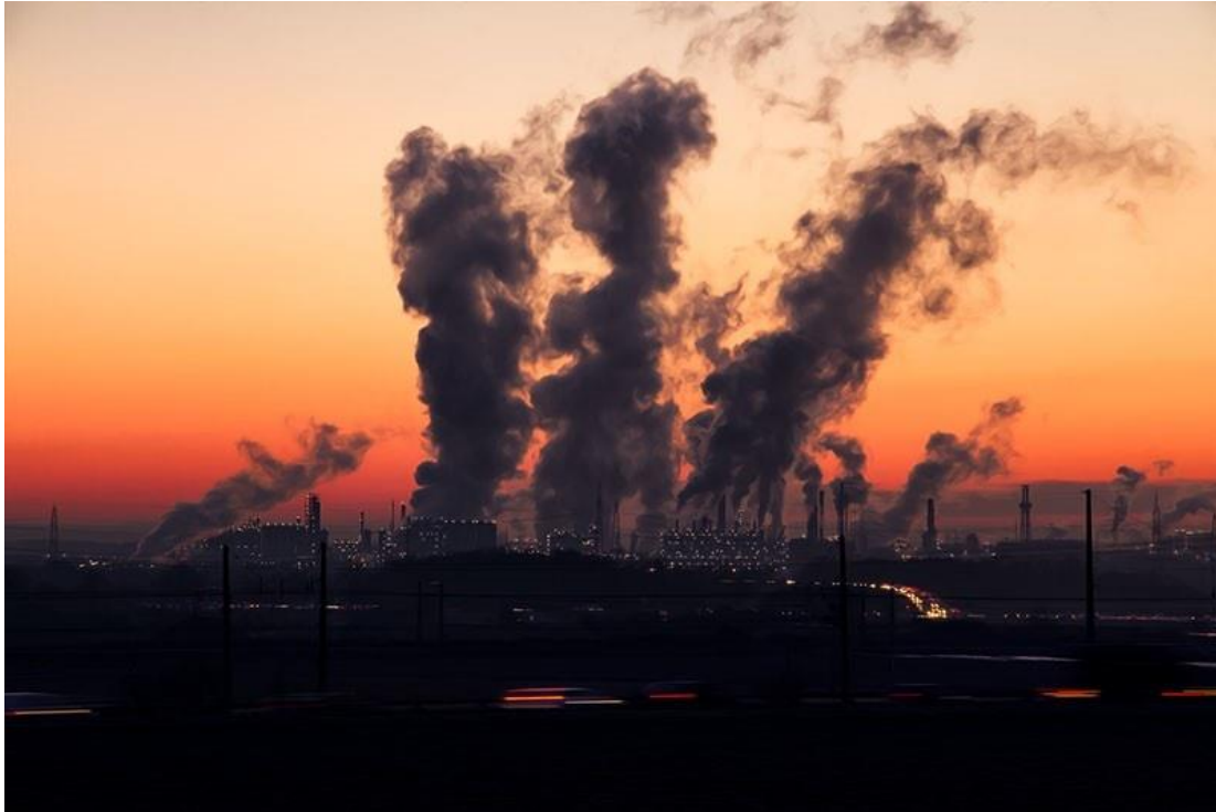
Slika broj 2. Otrovni dim samo od jedne tvornice u svijetu