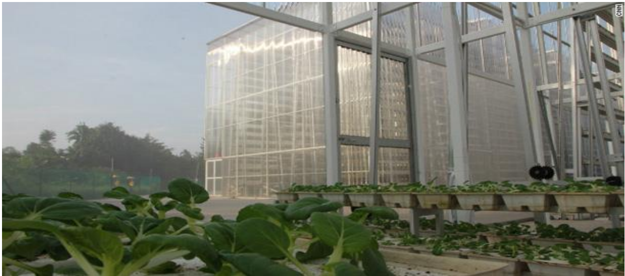
Slika broj 7. Iz prototipa u stvarnost! Prva vertikalna farma u svijetu.

2009. godine Singapur je napravio prvi prototip vertikalne farme. Kao grad koji ima preko 5 milijuna stanovnika i vrlo malo poljoprivrednog obradivog zemljišta ta ideja im je predstavljala višestruku korist. Zasad se još uvijek hrana proizvodi na malim površinama ali proizvode i do 5 puta više hrane nego na tradicionalan način. Izgrađeni tornjevi visine 9 metara već neko vrijeme uspješno proizvode povrće za stanovnike grada kao prva komercijalno usmjerena vertikalna farma u zemlji. U gradu gdje je gotovo nemoguće pronaći prazan komad zemlje, ova farma definitivno predstavlja utjehu da će se uskoro do hrane s vertikalnih farmi doći lakše i jeftinije.