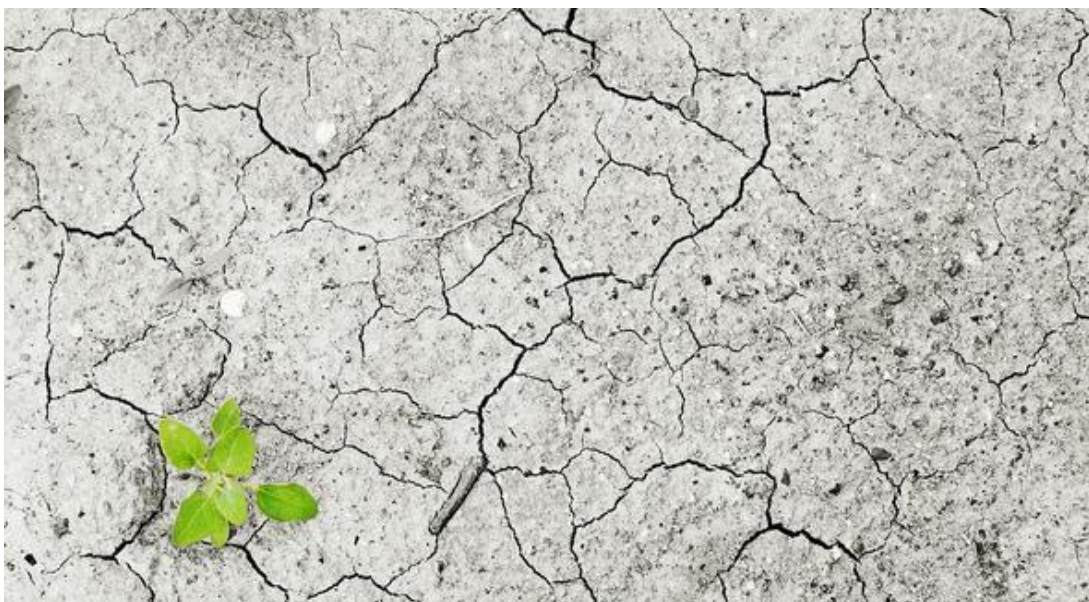
Slika broj 3. Suha zemlja uslijed nedostatka vode kao posljedica klimatskih promjena