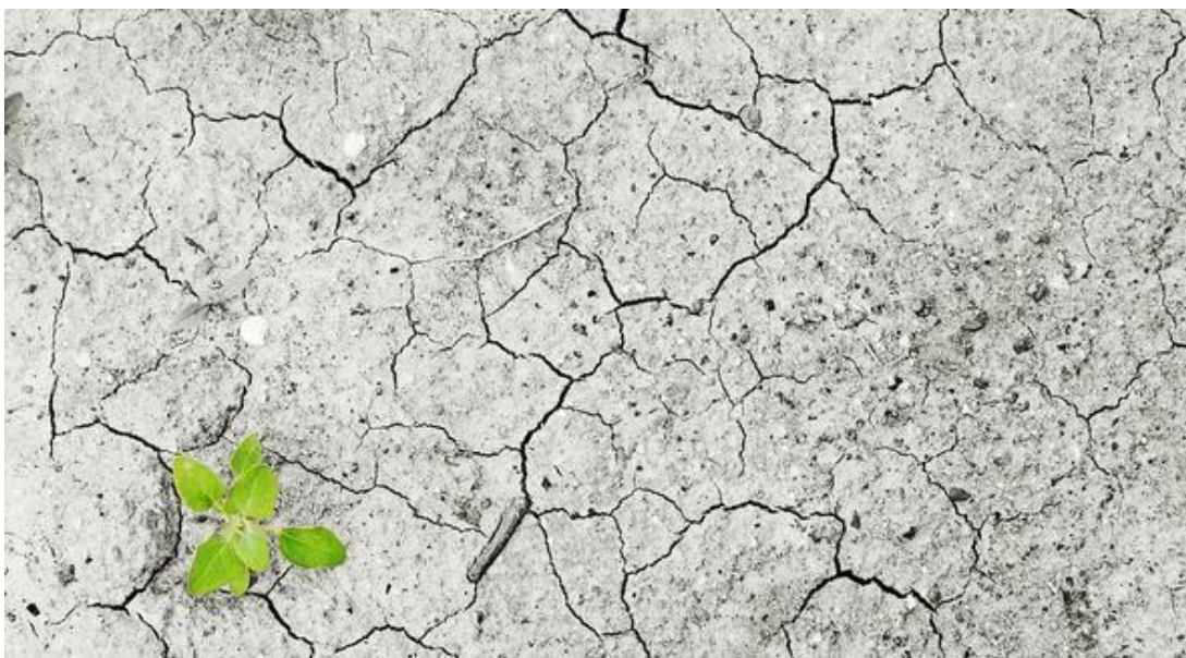
Slika broj 3. Suha zemlja uslijed nedostatka vode kao posljedica klimatskih promjena

(Izvor: http://www.naturala.hr/utjecaj-klime-na-ljudsko-zdravlje-proglasen-globalnim-zdravstvenim-problemom-21-stoljeca/5276/ )