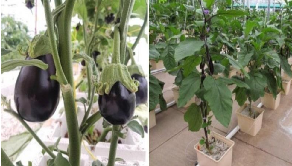
Slika 6. Patlidžan u hidroponu