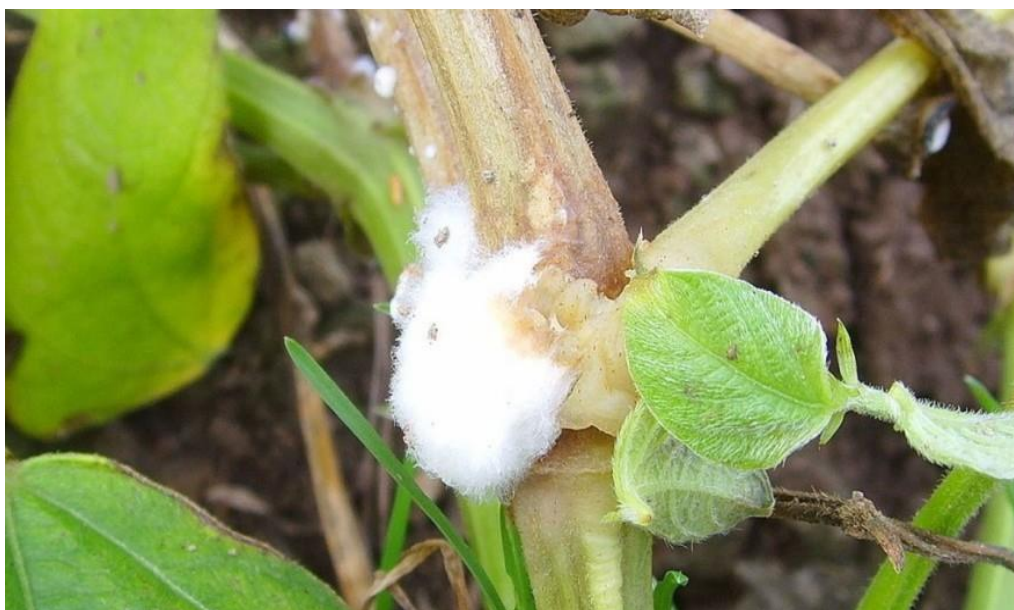
Slika 11. Bijela trulež

Bijela trulež ( Sclerotinia sclerotiorum ) je gljivična bolest koja zahvaća korijenski sustav, te se širi na plodove i stabljike (Slika 11.). Bolest se javlja pri nižim temperaturama i povećanoj vlazi u nasadu ili u zraku. Bolest se prepoznaje po bijeloj presvlaci koju čini splet micelija i koja se javlja na svim dijelovima biljke. Ako se bolest razvije na mladim presadnicama tada dolazi do polijeganja i propadanja biljke (Parađiković, 2009.).