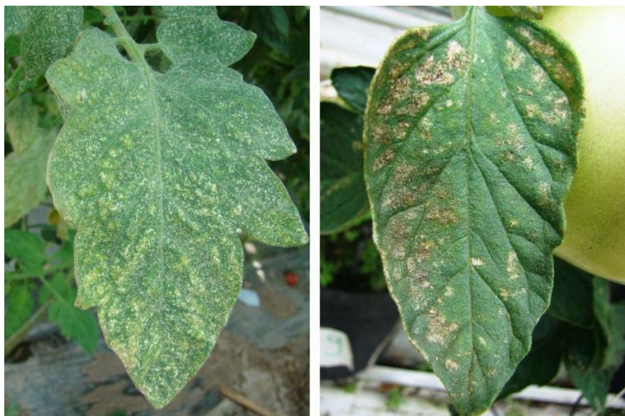
Slika 14. Grinje na listu patlidžana