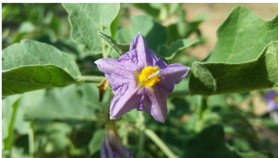
Slika 1. Cvijet patlidžana

Patlidžan (Slika 1.) je zeljasta jednogodišnja biljka koja se sastoji od korijena: brzorastućeg i vretenastog oblika, a glavna korijena se nalazi u oraničnom sloju do dubine od 30 cm. Stabljika: naraste od 0,5-1 m, a u zaštićenom području i tijekom duge vegetacije i više. Sastoji se od međukoljena i koljena, a u bazi je grmolikog oblika i drvenasta. Grananje je simpodijalno kada se istovremeno razvijaju 2 grane. Bočna grana koja se razvije iz pazuha lista koji je najbliže cvijetu, produžuje rast kao glavna os. List: Listovi su ovalni, krupni, manje ili više urezani, pokriveni sitnim dlačicama i valovitog ruba. Maslinasto-zelene su boje, a naličje je ljubičasto s izraženim žilama koje često nose bodlje. Dugi su oko 20 cm (Parađiković, 2009.).