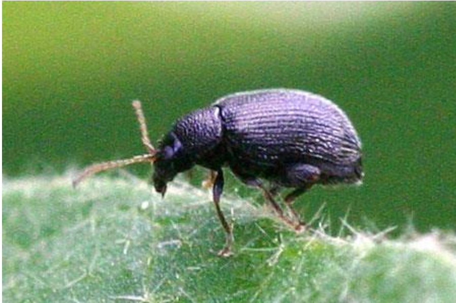
Slika 13. Epitrix fuscula