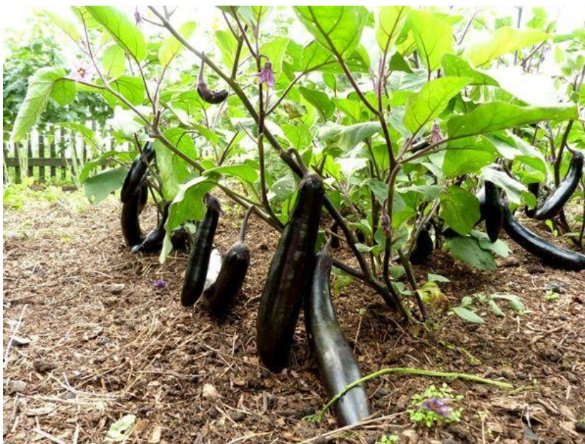
Slika 4. Patlidžan na otvorenom

Veličina lonca u koji se pikira treba biti 8 - 10 cm promjera, jer se u protivnom, dobiju slabije presadnice koje onda i u polju daju niži prinos. Temperatura prilikom proizvodnje presadnica igra veliku ulogu. Patlidžan je u toj fazi osjetljiv na promjene temperature, više nego ostale vrste povrća. Ako su noćne temperature 10 – 11 °C, dolazi do deformacije cvjetova, plodovi se slabo zameću i ako se razvijaju, deformirani su i neujednačene boje. Za 250 kvalitetnih sadnica potreban je 1 g sjemena (Parađiković, 2009.).