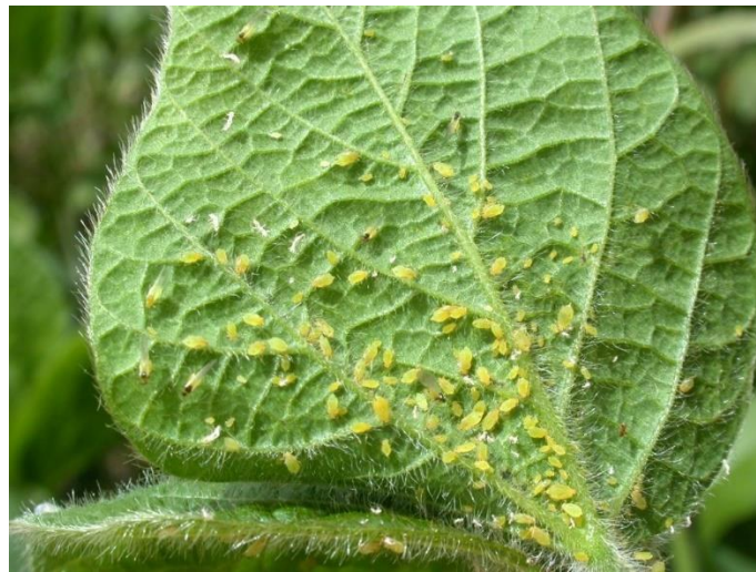
Slika 12. Lisne uši

Uši se obično pojavljuju na kraju sezone kada uzgajivači ne tretiraju aktivno. Iako su lisne uši manji štetnici, mogu utjecati na proizvodnju patlidžana. Ovi insekti oštećuju biljku, napadaju tkivo i isisavaju biljne sokove (Slika 12.). Lisne uši također mogu širiti biljne viruse (Mossler i Nesheim, 2012.).