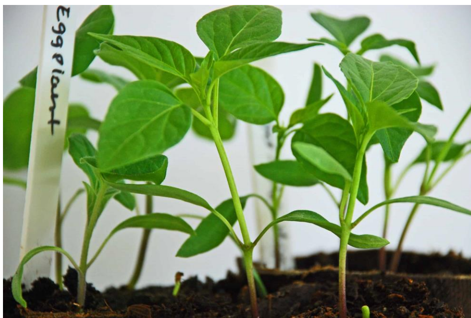
Slika 5. Presadnice patlidžana

cijepljene biljke mogu se izvaditi iz komore za liječenje i posaditi u staklenik ( http://feedingdiversity.vinelandresearch.com/ ).