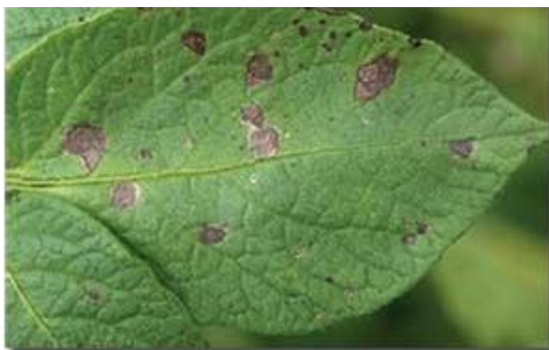
Slika 9. Koncentrična pjegavost na listu

Uzročnik je gljivica Phomopsis vexans (Slika 9.). Uzroci zbog kojih nastaje su: višak vlage, neprikladno tlo i gustoća sadnje. Ova bolest se javlja skoro svake godine. Prvi simptomi su na starijem, donjem lišću. Temperatura kojoj ovoj bolesti pogoduje je 24-29 °C i visoka vlažnost zraka ( https://www.chromos-agro.hr/koncentricna-pjegavost-lista-alternaria-solani/ ).