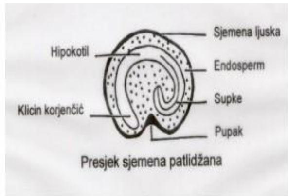
Slika 3. Sjeme patlidžana