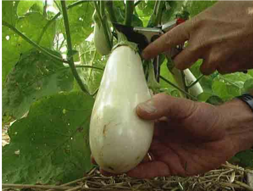
Slika 7. Berba patlidžana