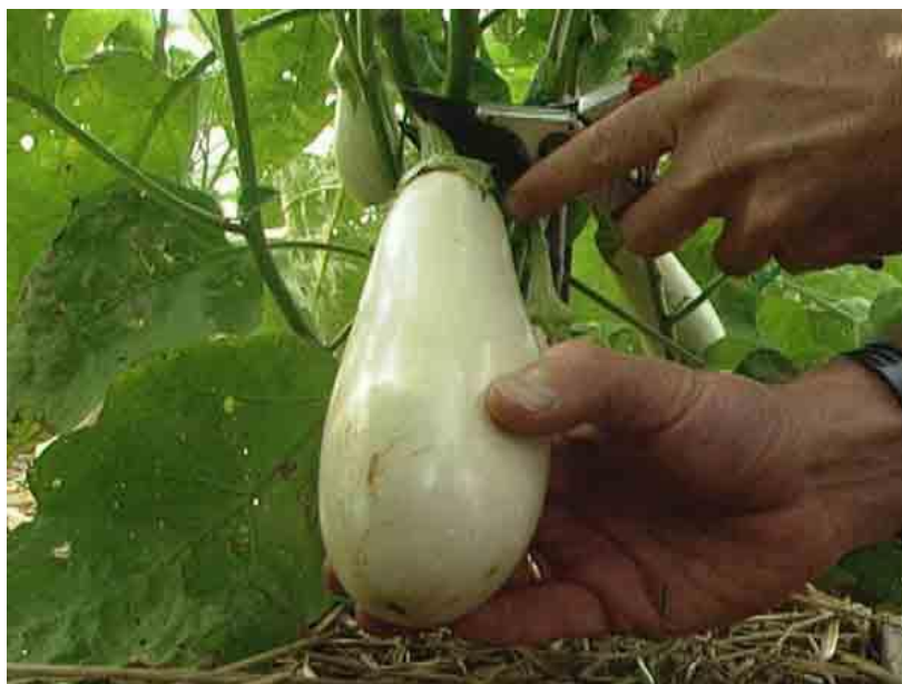
Slika 7. Berba patlidžana