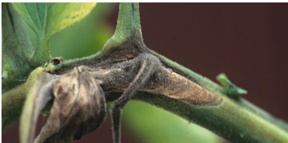
Slika 10. Siva trulež

Razvoju sive truleži ( Botrytis cinerea Pers.) pogoduju visoke temperature uz dugotrajnu povišenu vlagu zraka i povremeno kvašenje. Ako nastupi suho razdoblje, razvoj gljive može se potpuno prekinuti, a pri ponovnim oborinama micelij počinje dalje rasti (Slika 10.). Bolest se prepoznaje po sivoj prevlaci koju čine kondije i koja se može javiti na svim dijelovima biljke. Suzbijanje sive truleži je moguće, ali treba znati da su karence duže kod primjene preparata u zaštićenom prostoru u jesensko zimskoj proizvodnji, nego u ljetnom periodu kao i u vanjskoj proizvodnji. Treba napomenuti da je u zaštićenom prostoru moguća regulacija vlage i zraka koja može pomoći da se ove bolesti jednostavno ne razviju (Parađiković, 2009.).