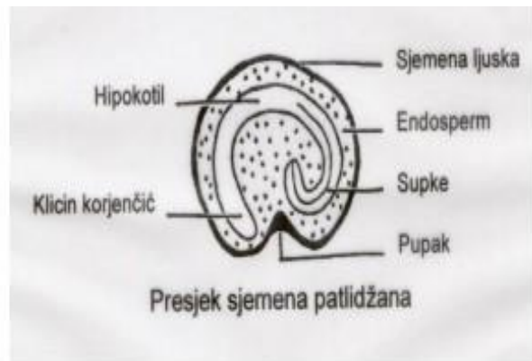
Slika 3. Sjeme patlidžana