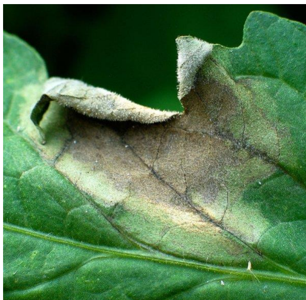
Slika 8. Plamenjača na listu