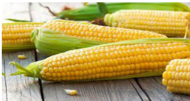
Slika 2. Kukuruz

Kukuruz (Slika 2.) je najrasprostranjenija žitarica ( Zea mays ) iz obitelji trava ( Poacea ) i potječe iz Amerike. Ova prehrambena kultura uzgaja se i koristi u kao hrana za ljude, stoku, kao sirovina u industriji te kao biogorivo. Kukuruz jeste visoka jednogodišnja biljka sa uspravnim, čvrstom stabljikom, ima uske listove koji su naizmjenice raspoređeni na suprotnim stranama stabljike. Muški i ženski cvjetovi kukuruza su odvojeni, plod mu je klip sa zrnjem koje je inače žute ili bijele boje (Britannica.com, 2022.).