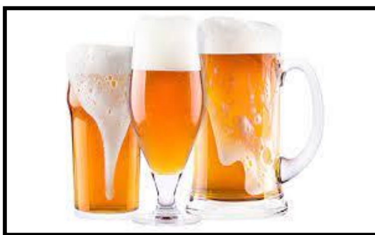
Slika 5. Pivo

Pivo (Slika 5.) je jedno od najstarijih i najpopularnijih pića u povijesti i dobiva se od ječmenog slada nepotpunim vrenjem ekstrakta uz dodatak hmelja. Pivo se dobija procesom alkoholnog vrenja iz hmelja, pivskog kvasca, slada i vode. Sadrži mali udio alkohola jer mu je glavni sastav napitka voda. Dok se slad dobiva od žitarica, u većini slučajeva od ječma, pivskim kvascem dolazi do alkoholnog vrenja gdje šećer prelazi u ugljiko dioksid i alkohol, dok hmelj konzervira pivo te mu daje gorak okus i ugodan miris tvrđi Franović (2016.).