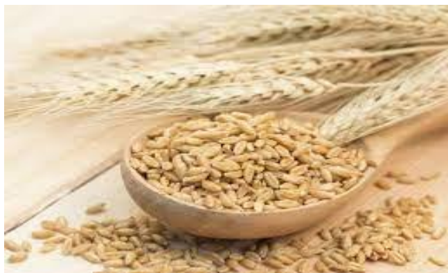
Slika 4. Ječam

Ječam ( Hordeum vulgare ) predstavlja četvrtu najveću uzgojnu žitaricu u svijetu, poslije kukuruza, pšenice i riže. Jednogodišnja trava iz obitelji Poaceae , koja ima uspravnu stabljiku s naizmjeničnim listovima. Ječam (Slika 4.) ima visoku hranidbenu vrijednost i koristi se kao stočna hrana, a u industriji za proizvodnju alkohola i piva zbog izuzetno kvalitetnog slada. Njegov slag upotrebljava se u tekstilnoj, pekarskoj i konditorskoj industriji, u proizvodnji škroba i kvasca. (Britannica.com, 2022.)