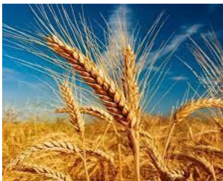
Slika 3. Pšenica

Pšenica ( Triticum ) je jedna od najvažnijih i najstarijih žitnih trava iz obitelji Poaceae , najviše se uzgaja i koristi za izradu kruha, tjestenine (špagete, makaroi itd.), brašna i kolača. Veliki značaj ima u mlinarstvu, farmaceutskoj i prehrambenoj industriji. Stabljika se razvija od 1 do 1,5 m visine. Na vrhu vlati nalazi se klas, u klasu se klasići sastoje od nekoliko cvjetova i pljevice. (Slika 3.) Zrno pšenice ima dlakavi vršak i duboku brazdu, te kada je zrelo ispada iz pljeve, može biti bijele do crvene boje ovisno o sorti pšenice. (Britannica.com, 2022.)