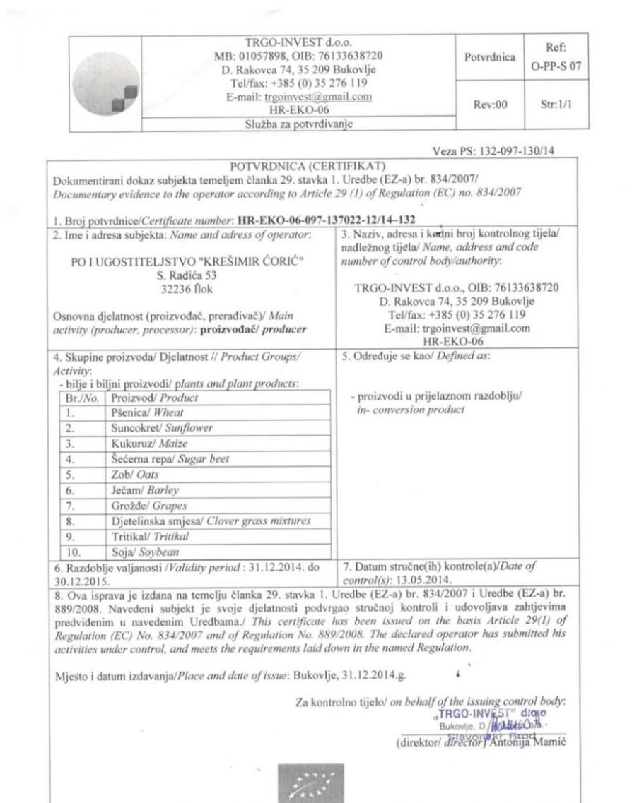
Slika 10. Potvrđnica (Certifikat) za POU Krešimir Ćorić

Nakon obavljene prve stručne kontrole i po upisu u Upisnik subjekata u ekološkoj poljoprivredi, POU Krešimir Ćorić je kontrolnom tijelu „TRGO-INVEST“ d.o.o. iz Bukovlja uputio zahtjev za dostavljanjem potvrđnice (certifikata). Uz zahtjev koji je precizno ispunio, ovjerio i potpisao POU Krešimir Ćorić je dostavio kontrolnom tijelu i svu potrebnu prateću dokumentaciju. Kontrolno tijelo je nakon pregleda zahtjeva i prateće dokumentacije, odnosno ispunjavanja svih uvjeta za bavljenjem ekološkom proizvodnjom POU Krešimir Ćorić dostavilo potvrđnicu (certifikat) (slika 10.), kojom je stekao pravo na korištenje eko znaka „Ekoproizvod“.