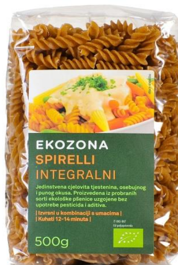
Slika 5. Deklaracija eko proizvoda iz Italije