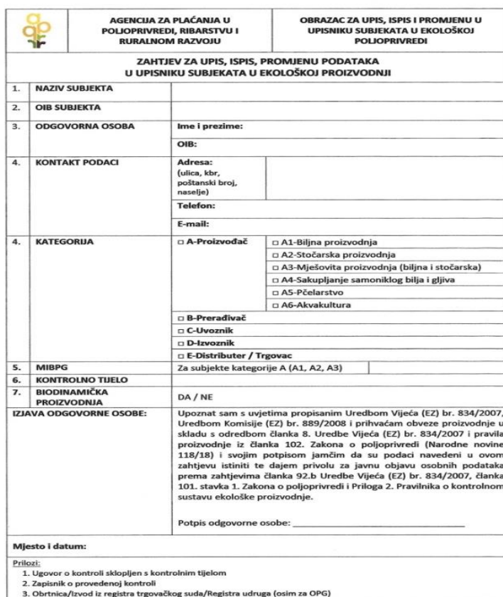
Slika 1. Zahtjev za upis, ispis, promjenu podataka u Upisniku subjekata u ekološkoj proizvodnji

Nakon obavljenog prvog stručnog nadzora i dostavljenog zapisnika o izvršenom prvom stručnom nadzoru proizvođač predaje APPRRR-u zahtjev za upis u Upisnik subjekata u ekološkoj proizvodnji (slika1.).