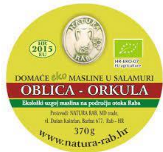
Slika 4. Deklaracija eko proizvoda iz Hrvatske

Poslovni subjekt, odnosno proizvođač je u obvezi svake godine obnoviti zahtjev za dodjelu eko znaka za svaki pojedini proizvod. Na slici 4. prikazan je eko znak eko proizvoda iz Hrvatske (domaće eko masline u salamuri), dok slika 5. prikazuje eko znak eko proizvoda iz Italije (tjestenina proizvedena iz ekološke pšenice).