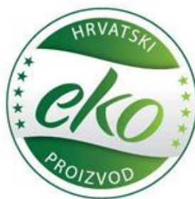
Slika 2. Logotip eko znaka RH za ekološku proizvodnju

Hrvatski ekološki znak otisnut je na bijeloj podlozi, zelene i bijele je boje i okruglog oblika (slika 2.). Deklaracija ekološkog proizvoda mora biti jasno vidljiva na omotu, te mora biti čitljiva i neizbrisiva, kako bi kupac stekao povjerenje u proizvod koji kupuje. Ukoliko nanošenje eko znaka bojom nije moguće tada se koristi naljepnica ili privjesnica. Veličina znaka varira ovisno o veličini ekološkog proizvoda. Ukoliko nije moguće koristiti znak u zelenoj i bijeloj boji, znak se može koristiti i u crnoj varijanti. Također je dopušteno koristiti eko znak i u varijanti u kojoj su riječi „HRVATSKI“ i „PRIZVOD“ napisane na engleskom jeziku.