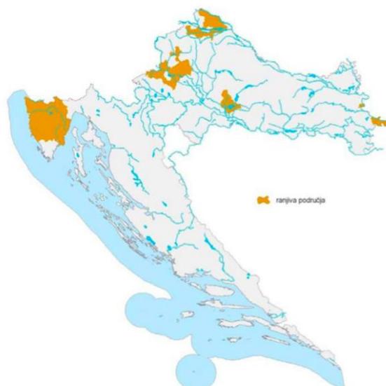
Slika 2. Kartografski prikaz ranjivih područja u RH