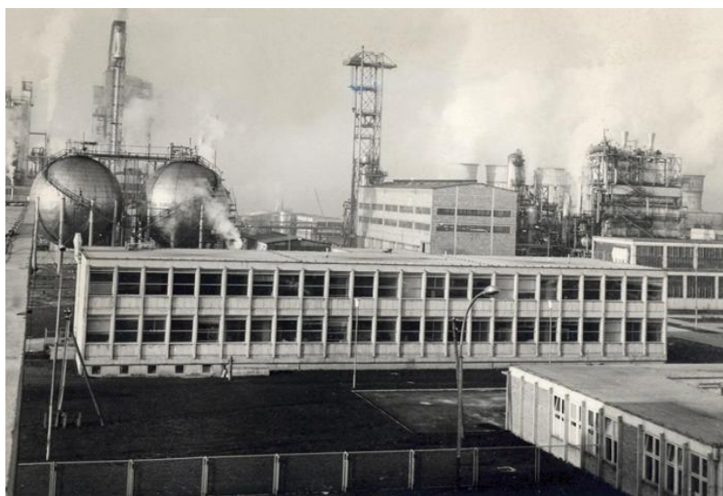
Slika 1. Panorama Tvornice mineralnih gnojiva; INA – Tvornica petrokemijskih proizvoda, 1969.