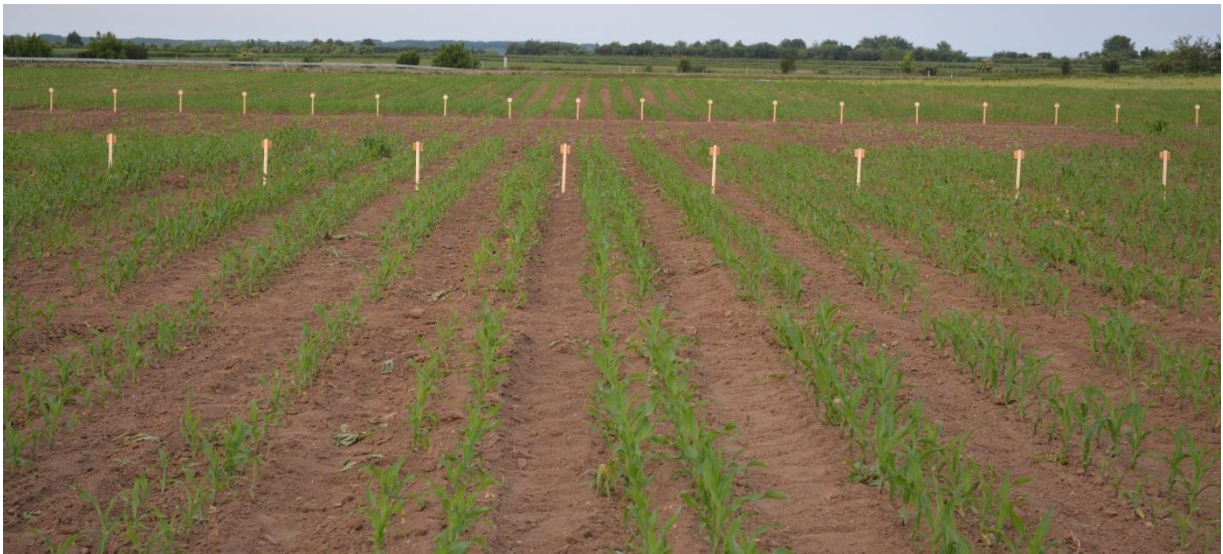
Slika 11. Tlo na pokušalištu Fakulteta agrobiotehničkih znanosti Osijek

Na pokušalištu Klisa (Slika 11.) prevladava eutrično smeđe tlo koje pripada odjelu automorfni tala, klasi kambičnih tala, sa sklopom profila P-C zbog antropogenizacije sklopa A-(B)v-C obradom tla. Tlo prema teksturi pripada u praškaste ilovače te je malo porozno s osrednjim kapacitetom tla za vodu u oraničnome i podoraničnom horizontu. Reakcija tla je alkalna u svim horizontima, s dosta humoznim oraničnim slojem s umjerenom opskrbljenošću fosforom 15,58 mg/100 g te s umjerenom opskrbljenošću kalijem (Tablica 1.). Neke pedomorfološke značajke korištenog tla prikazane su u Tablici 1.