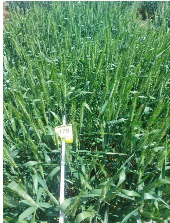
Slika 9. Kultivar MV Suveges