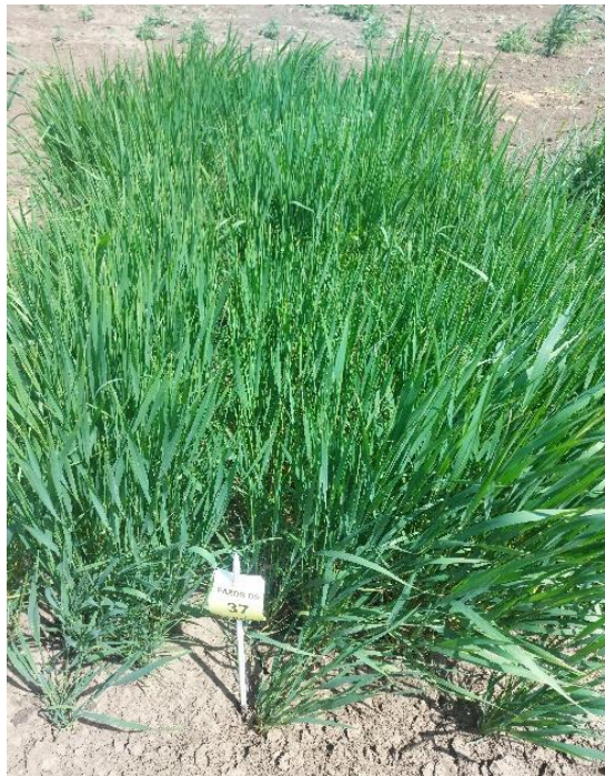
Slika 4. Triticum sphaerococcum L. u fazi vlatanja

Triticum sphaerococcum je heksaploidna pšenica (AABBDD, 2n = 6x = 42 ), porijeklom s Indijskog potkontinenta, ime je dobila po sferičnom obliku gluma (slika 4). Specifične kratke i jake stabljike, poluloptasti oblik zrna s plitkim naborima, sadrži nešto veći sadržaj bjelančevina, ali ima niži prinos u usporedbi s krušnom pšenicom. Otporna je na sušu i bolesti, ali posebno