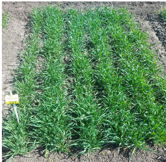
Slika 14. Busanje moderne sorte

U fazi vlatanja 4.05.2022. obavljen je drugi pregled pokusnih parcela pri čemu je praćeno svojstvo povijenosti lista zastavićara, boja, duljina i širina lista. Vlatanje u žitarica (slika 15) je faza naglog izduživanje stabljike i obićno traje 30 – 45 dana, a zapoćinje kada moćemo opipati prvo koljence stabljike u rukavcu gornjeg lista i pri temperaturama iznad 15 °C (Kovaćević i Rastija, 2014.). Pri kraju fenofaze vlatanja moćemo uoćiti zaćetak klasića.