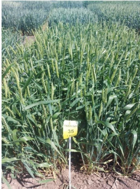
Slika 2. Triticum monococcum L. u fazi klasanja

visokih nutritivnih svojstava u zrnu, ne zahtjeva velika ulaganja i povećan je interes za njom u ekološkoj poljoprivredi (Békés i sur. 2017.).