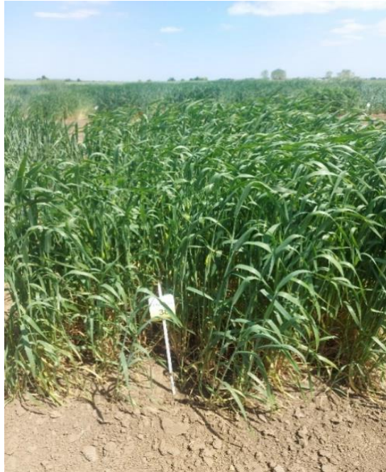
Slika 5. Triticum compactum L. u fazi vlatanja

na žutu hrđu uzrokovanu od Puccinia striiformis . Zrno nije povezano s glumama i lako se odvaja te je zbog toga olakšana žetva (Josekutty, 2008.).