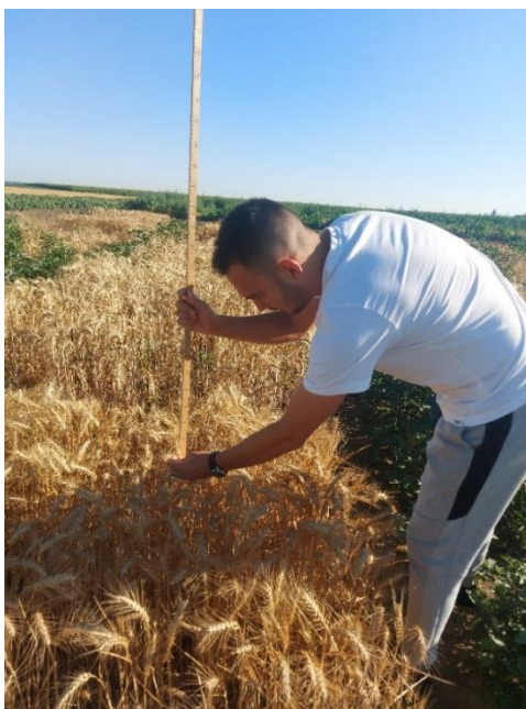
Slika 16. Mjerenje dužine klasa i visine stabljike

Mjerenja visine stabljike i duljine klasa obavljena su 14.06.2022. nasumičnim odabirom 25 biljaka na svakoj pokusnoj parceli, izmjereno je ukupno 250 biljaka od toga 125 biljaka divljih srodnika i 125 biljaka modernih sorti (slika 16).