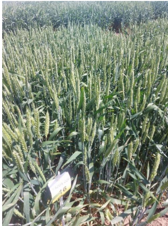
Slika 7. Kultivar krušne pšenice Zlata

visokorodnih kultivara gotovo se prestaje proizvoditi. S obzirom da su glume srasle sa zrnom teško se ljušti. Ova podvrsta pšenice ima vrijedna nutritivna svojstva, čak pri niskoj razini gnojidbe, s većim sadržaj proteina (16-17%), hranjivih tvari i minerala u usporedbi s običnom pšenicom. Stabljika je šuplja, tanka i cilindrična sastavljena od 5-6 koljenca i međukoljenaca. Raste u visinu do 1,5 metara zbog čega je sklona polijeganju te je ovo najveći nedostatak ove žitarice (Ugrenović, 2013). Nakon žetve ostaju klasići koji najčešće sadrže dva zrna čvrsto spojena s pljevama (Mlinar i Ikić, 2012.).