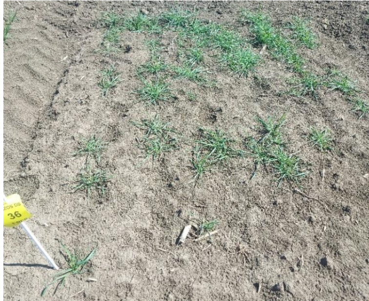
Slika 13. Prostratum tip busanja T. dicoccoides