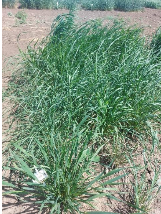
Slika 3. Triticum dicoccoides L. u fazi vatanja