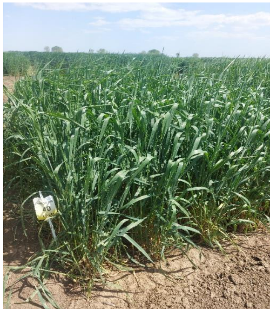
Slika 6. Triticum spelta L. u fazi vlatanja

Triticum compactum ili patuljasta pšenica je heksaploidna pšenica, specifičnog oblika klasa po kojemu je i dobila ime (slika 5). Niskog je rasta, jake stabljike prosječne visine oko 60 cm.