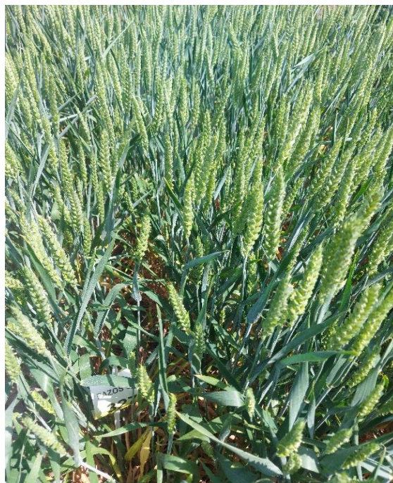
Slika 11. Kultivar Gemini