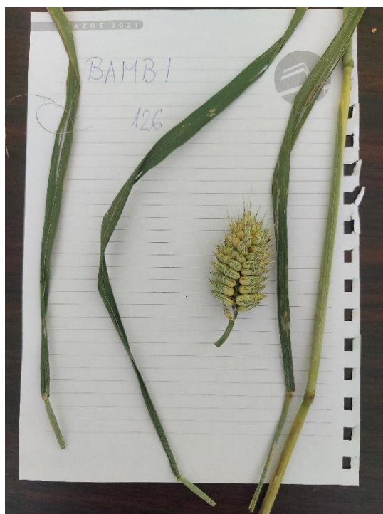
Slika 17. Triticum compactum L. građa biljke