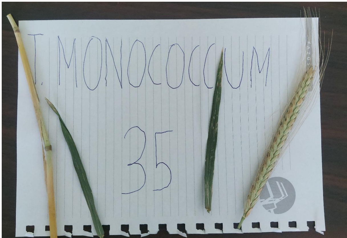
Slika 19. Triticum monococcum L. građa biljke

Specifičnosti u građi klasa kod različitih sorti su vidljive i na (slikama 17., 18. i 19.), klas Triticum compactum L. je karakteristične građe, kratak, zbijen po čemu je i dobio ime compactum , dok je Triticum spelta L. klas izdužen i rastresit. Triticum monococcum L. ima jednostavni klas, s jednim klasićem sa svake strane klasnog vretena.