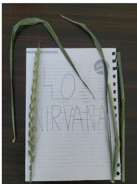
Slika 18. Triticum spelta L. građa biljke