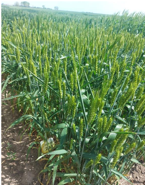
Slika 10. Kultivar WWMCB2