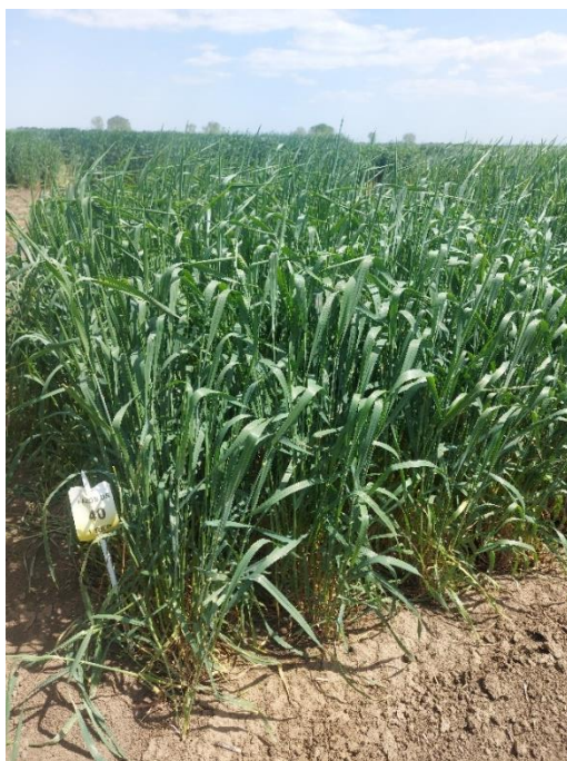
Slika 15. Triticum spelta L. u fazi vlatanja

Mjerenja visine stabljike i duljine klasa obavljena su 14.06.2022. nasumičnim odabirom 25 biljaka na svakoj pokusnoj parceli, izmjereno je ukupno 250 biljaka od toga 125 biljaka divljih srodnika i 125 biljaka modernih sorti (slika 16).