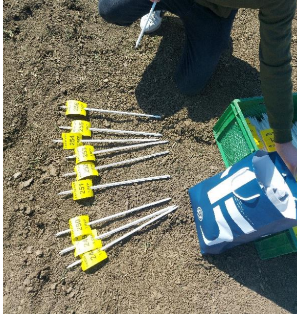
Slika 12. Obilježavanje parcela poljskog pokusa

Obilježavanje pokusa obavljeno je 06.04.2022. kako bi se moglo pratiti i bilježiti stanje genotipa u svim fazama rasta i razvoja (slika 12). Ocjenjivana su i praćena morfološka svojstva biljaka pšenice: visina biljke, duljina klasa, te duljina i širina lista te agronomski svojstva: broj klasića po klasu, broj zrna po klasu i prinos.