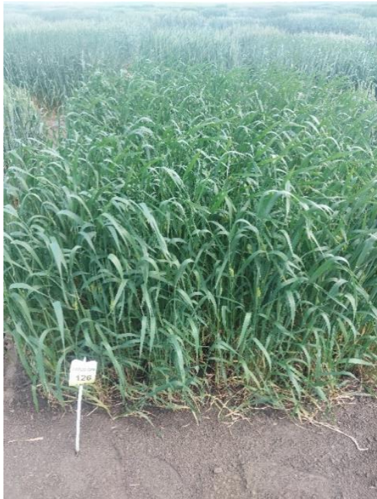
Slika 8. Kultivar Bambi