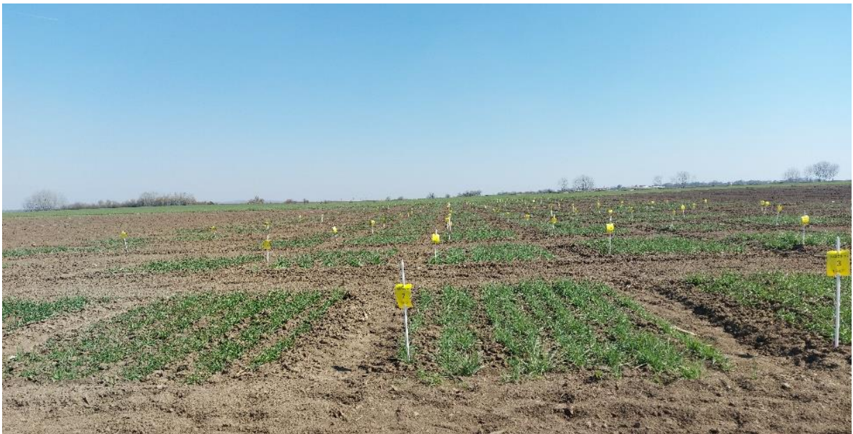
Slika 1. Poljski pokus faza busanja pokušalište „Tenja“

Genotipovi pšenice korišteni u istraživanju su dio poljskoga pokusa posijanog na pokušalištu Tenja Fakulteta agrobiotehničkih znanosti Osijek, u sklopu podmjere 10.2. „Potpora za očuvanje, održivo korištenje i razvoj genetskih izvora u poljoprivredi« u okviru Nacionalnog programa očuvanja i održive uporabe biljnih genetskih izvora za hranu i poljoprivredu u Republici Hrvatskoj. Genotipovi pšenice su posijani u dva ponavljanja, u studenom 2021. godine, a veličine parcele je iznosila 2,5 m 2 .