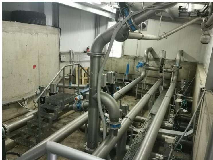
Slika 6. Dozirna stanica