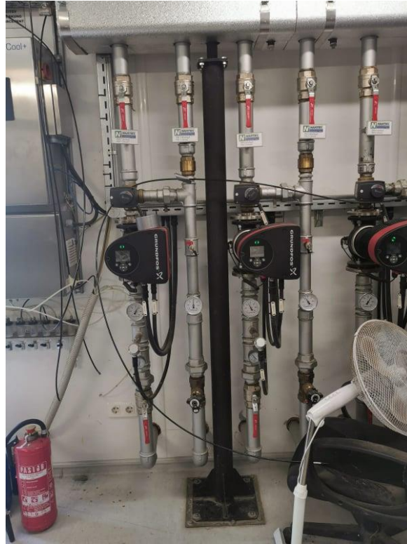
Slika 7. Pnemstski ventili