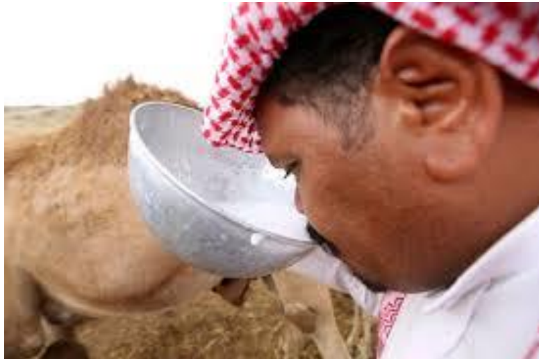
Slika 10. Devino mlijeko

Nomadska pustinjska plemena koriste devino mlijeko kao glavni dio svoje prehrane (Slika 10). Od toga mogu živjeti gotovo mjesec dana i smatrati ga kompletnim obrokom.