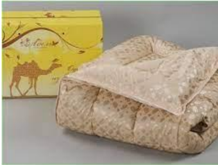
Slika 8. Deka od devine dlake

Zabilježena povijest pokazuje da su se čista vlakna devine dlake koristila još u 17. stoljeću. U 19. stoljeću koristila se mješavina vlakana vune i devine dlake. Ova vlakna devine dlake mogu se koristiti za tkanje ili pletenje ili heklanje (Heide, 2011).