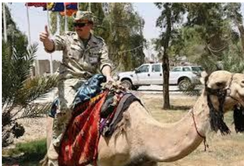
Slika 9. Deve u vojnoj upotrebi

Imperial Camel Corps osnovala je Velika Britanija 1916. Prvotno je bio namijenjen borbi protiv plemena Senussi, ali je kasnije korišten u bitkama Prvog svjetskog rata na Sinaju i u Palestini. Vojnici ICC-a bili su na devama i mogli su se kretati pustinjskim terenom; međutim, bili su sposobni i za borbu pješice. Nakon srpnja 1918., ICC se počeo gasiti jer nije dobio nova pojačanja i formalno je raspušten 1919. (Palmer, 1999.). Britanska vojska stvorila je Egipatski korpus za prijevoz deva od egipatskih vozača deva i njihovih deva (Slika 9). Ova je grupa podržavala britanske ratne operacije u Siriji, Palestini i Sinaju transportirajući zalihe. Godine 1912. kolonijalne vlasti britanskog Somalilanda stvorile su Somali Camel Corps, koji je prestao s radom 1944. (Palmer, 1999.).