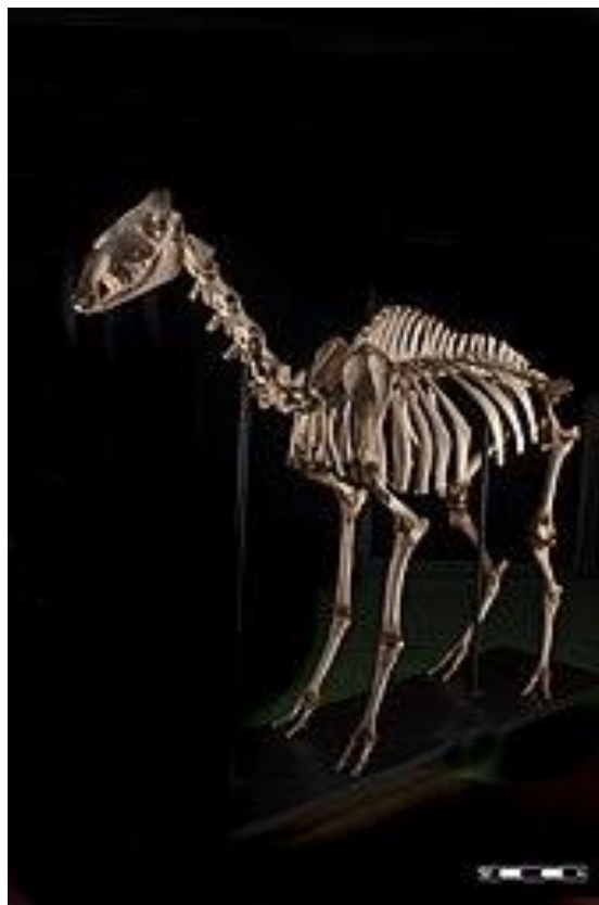
Slika 6. Kostur dvogrbe deve

Za razliku od većine drugih nožnih prstiju, koji se oslanjaju na vrh nožnog prsta za "oblačenje" kopita, deva dodiruje tlo pretposljednjim i zadnjim zglobovom prsta. Nemaju kopita, samo zakrivljene nokte koji štite samo prednji rub stopala. Nožni prsti počivaju na elastičnim "jastučićima" vezivnog tkiva, stvarajući široko, žuljevito stopalo. Po dva prsta (treći i četvrti) čine središnju os, dok su ostali prsti potpuno hipoplastični (Slika 6). Osim toga, lijeva i desna noga deve su istovremeno podignute i kreću se naizmjenično, što je također razlog zašto se deva trese pri hodu (Ramet, 2011.).