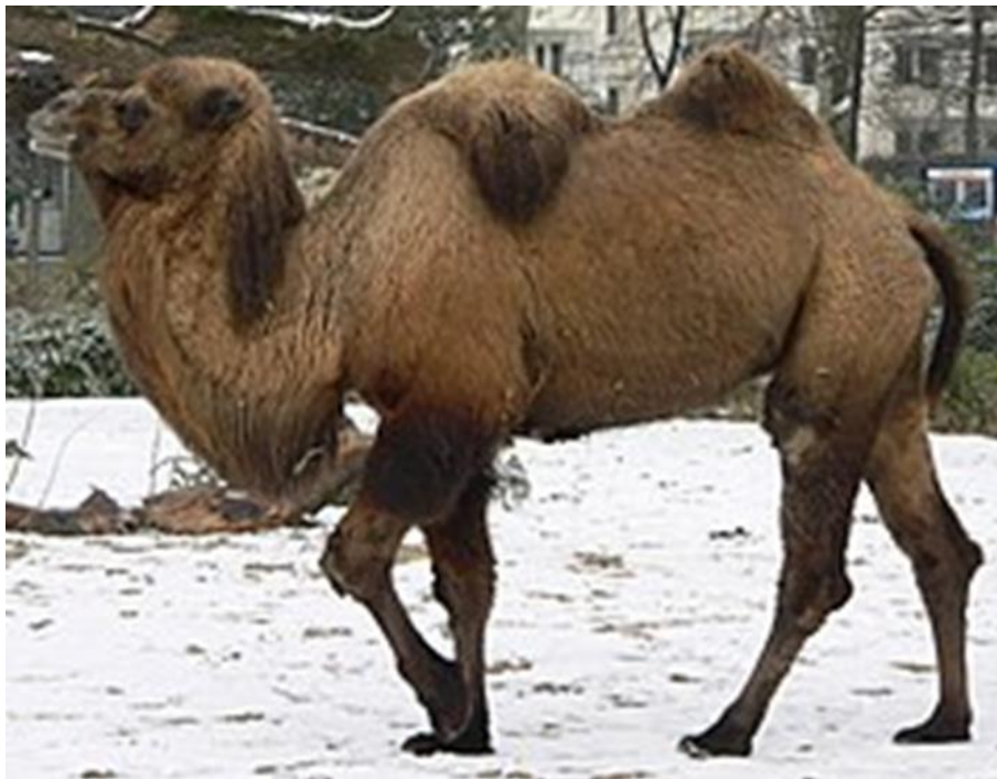
Slika 5. Dvogrba deva

Baktrijska deva je najveća živuća deva, a u ramenima je niža od dromedara. Visina u ramenima je od 160 do 180 cm s ukupnom visinom u rasponu od 230 do 250 cm, duljina glave i tijela je 225-350 cm, a duljina repa je 35–55 cm (Slika 5). Na vrhu grbe prosječna visina je 213 cm (Vannithone, 1999.). Tjelesna masa može biti od 300 do 1000 kg, pri čemu mužjaci teže oko 600 kg, a ženke oko 480 kg. Duga, vunasta dlaka varira u boji od tamnosmeđe do pješčano bež. Griva i brada, duge dlake pojavljuju se na vratu i grlu, duge su do 25 cm (Richard, 2003.).