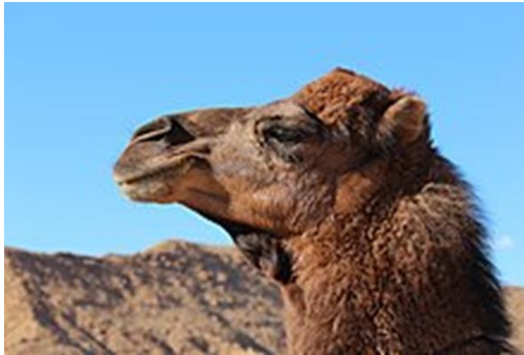
Slika 2. Glava deve

Dromedari također imaju istaknute supraorbitalne grebene koji štite njihove velike oči. Uši su im male i okrugle (Slika 2). Mužjak ima meko nepce dugo 18 cm. Tijekom sezone parenja napuhne se u veliku ružičastu vrećicu. Ova se vrećica često pogrešno smatra jezikom umjesto nepcem. Dule imaju izvrstan njuh i vid (Gilchrist, 1851.)