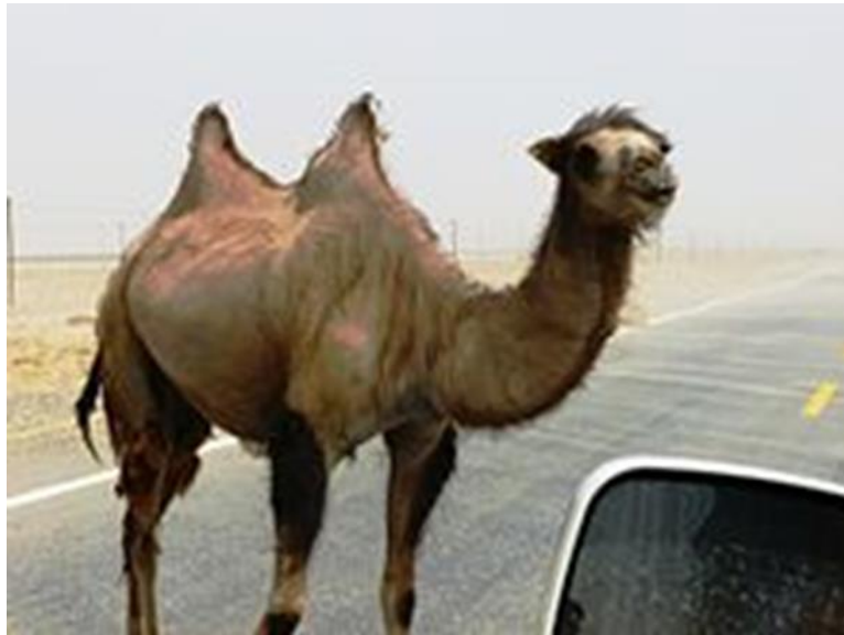
Slika 7. Divlja baktrijska deva

Divlje baktrijske deve imaju duge, uske nosnice poput proreza, dvostruke redove dugih, čupavih trepavica i krznene uši koje mogu izdržati pustinjske oluje s prašinom. Imaju tvrde nepodijeljene tabane, dva velika prsta raširena i kutikule koje im omogućuju hodanje po neravnom i vrućem kamenitom ili pjeskovitom terenu (Slika 7). Njihova gusta, čupava dlaka zimi postaje svijetlosmeđa ili bež (Moore, 2016.).