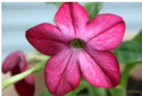
Slika 4. Cvijet duhana

Cvjetovi duhana (slika 4.) se mogu pojavljivati pojedinačno ili skupljeni u cvat (štitac). Cvijet je građen od pet međusobno sraslih lapova, pet sraslih latica, pet prašnika i tučka. Dužina cvijeta se kreće od vrlo kratkog (<20 cm) pa do izrazito dugog (>90 cm). Latice mogu biti raznolikih boja: bijele, zelenkastožute, ružičaste, tamnoružičaste, crvene, purpurno crvene i ljubičaste. Duhan je samooplodna biljka. Plod duhana je tobolac, pregrađen u dva dijela, koji kad sazrije pukne. Sjeme je sitno, okruglo i smeđe. U jednom gramu ima od 10.000 do 15.000 sjemenki, a s jedne biljke se može dobiti i do 50 grama sjemena. Masa 1.000 sjemenki iznosi od 0,07 do 0,1 gram. Sjemenke u sebi sadrže od 36 do 40 % ulja. 15